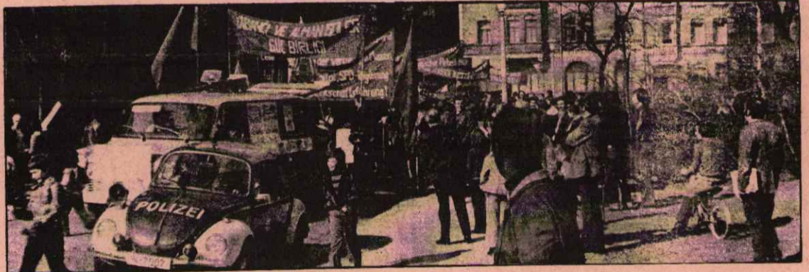
NÜRNBERG'TE İŞSİZLİĞİ, İŞTEN ÇIKARMA LARI PROTESTO EDEN BÜYÜK BİR YÜRÜYÜŞ YAPILDI.

Çok sayıda işçinin iştirak ettiği yürüyüşte, konuşmacılar işsizliğe karşı mücadelede, kapitalist sisteme karşı mücadeleden ayrılamayacağını, bu nedenle yalnızca ekonomik talepler etrafında birleşmenin yeterli olmadığını, siyasi olarak güçlenip kapitalist sistemin ortadan kaldırılması yolunda mücadelenin esas olduğunu söylemişlerdir.