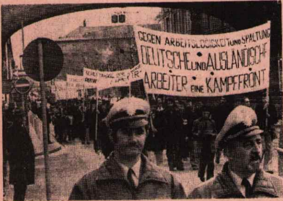
DARMSTADT'TA İŞÇİLER YÜRÜYÜŞ YAPILAR

İşsizliğin gelişmesi karşısında, ilerici birlemler çeşitli protesto hareketlerini yoğunlaştırmışlardır.