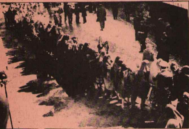
Sivas'ta şeker kuyruğu trafiği aksattı