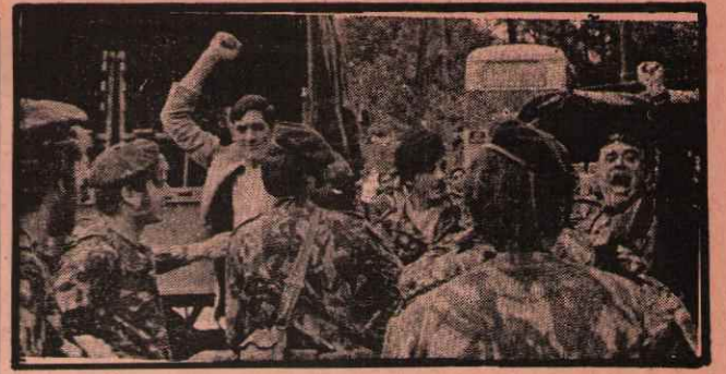
PORTEKİZ'DE DARBECİ ORDU TARAFINDAN TUTUKLANAN İŞÇİ-KÖYLÜ BİRLİĞİ ADLI TEŞKİLAT ÜYESİ 2 DEVRİMCİ

Yeni habes rejimi, tıpkı kendinin devirdiği Halie Selasiye rejimi gibi, eritre halkının mücadelesini kan ve ateşle bastırmaya çalışıyor. Ama bu boş çabadır. Yıllardan beri silah elde bağımsızlık mücadelesi veren Eritre halkı, bu baskılardan yılmıyor. Zafer Eritre halkının olacaktır.