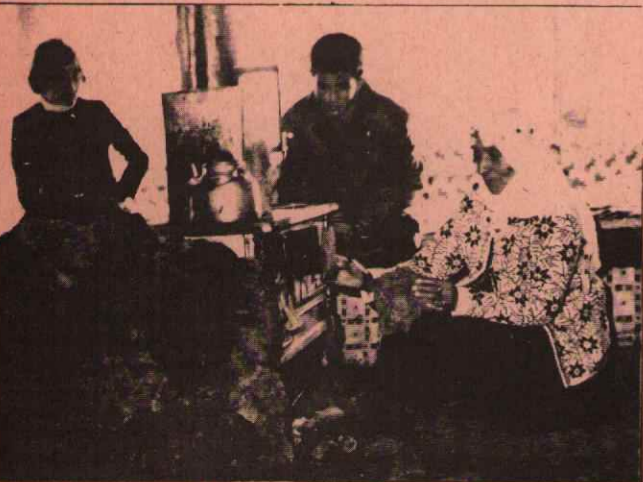
Pülümür'de tezeğin kilosu 3 liraya yükseldi