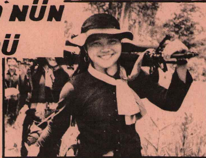
KADIN VIETKONG SAVAŞÇILARI KADININ KURTULUŞU ANCAK DEVRİMLE GERÇEKLEŞEBİLİR

Kurtarılmış bölgelerde duran demokratik iktidarı geliştiren, emperyalizmin hala işgalı altında bulunan bölgeler de kurtarılmaya çalışılıyor. Mart ayı içinde vietkong savaşçıları Tiyö'nün işgalı altında olan bölgeleri kurtarmak için genel taarruza geçti. Bu saldırıda 1 Nisan kadar emperyalistlerin ve usaklarının elinde bulunan 6 şehir daha kurtarıldı. Kurtarılan şehirlerin için de stratejik öneme sahip Da-Nang da var. Bilindiği gibi bu şehir, Tiyö rejiminin elindeki en önemli liman şehirlerinden biriydi.