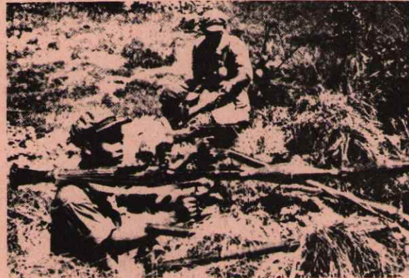
- KIZIL KMERLER -

Lon-nol'un işgali altındaki bölgelerde yaşayan halkın önemli bir bölümü, kurtarılmış bölgelere geçti. Kızıl kmerlere katılarak Amerikan emperyalizmine ve onun uşaklığını yapan yerli hakim sınıflara karşı mücadeleye atıldı. Lon-nol işgali altında bulunan bölgelerde de halk, bu faşist rejime karşı yiğitçe direnmeye başladı. Hatta hakim sınıflar içinde bile Lon-Nol'e karşı geniş bir muhalefet hareketi doğdu. 1975 yılının başında kızıl kmerler Kamboçya topraklarının % 90 ını, nüfusun ise %80 ini kurtarmış du-