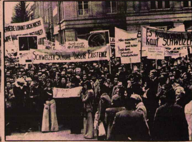
AVRUPA'NIN EN KÜÇÜK ANCAK DÜNYANIN SAYILI ZENGİN ÖLKELERİNDEN KABUL EDİLEN İSVİÇRE'DE İŞÇİ ÇIKARMA LARINI PROTESTO İÇİN YAPILAN MİTING

Aachen ve Çevresi Türkiyeli İşçiler Derneğinin de katıldığı bu yürüyüşte : İşsizliğin neden olduğunu, işsizliğin bulunmadığı bir düzenin olabileceğini, ancak böyle bir düzenin kapitalist sistemin yıkılmasından sonra kurulabileceğini açıklayan bir çok işçi Alman patronlarının tutumlarına protesto etmişlerdir.