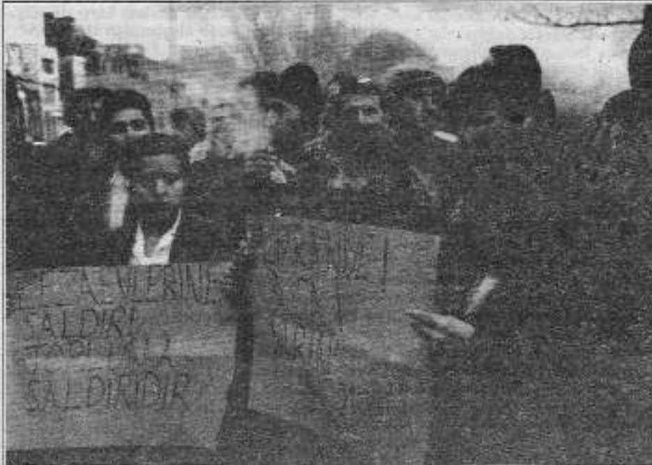
Analar, her zaman olduğu gibi oğulları için alanlara çıkarak onurlarını yalnız bırakmadılar.

Aynı akşam Okmeydanı'nda toplanan 50 kişilik kitle korsan gösteri yaparak Ümraniye katliamının hesabını soracaklarını belirttiler. DHKP-C, TKP(ML), TİKB ve DY'lerden oluşan kitle molotoflarla olay yerine gelen polise karşılık vererek ve atıkları sloganlarla eylemi sürdürdüler. Acizleşen polis uzaktan rastgele ateş açtı ve 2 kişi yaralandı. Protestocular eylemlerini başarıyla bitirerek olay yerinden ayrıldılar.