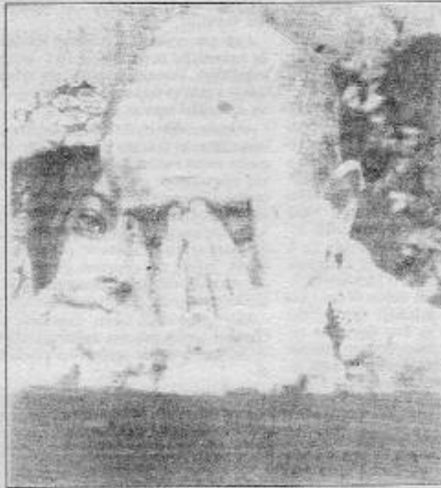
Halkı ağılatanları halk adaleti ağılatıyor

DHKC (Devrimci Halk Kurtuluş Cephesi) tarafından yapılan açıklamada: "Topraklarımız; çocukları öldürülen, kaybedilen anaların gözyaşlarıyla sulandı. Binlerceimizi katledip içyüzünü üzerinde insanımızı kaçırdılar, kaybettiler. Yetmeyince bu kez de eli kolu bağli tutsaklarımızı saldırdılar ve katletmeye başladılar. Her yer kan dola, heryere pislik bulaştı ve kapkara bir tablo oluştu. Bu kara tabloyu yatanlar, iki elin parmaklarını geçmeyen bir avuç sömürücü azınlıktır. Emperyalizmle işbirliği yaparak ülkeyi ve halkı sömüren işbirlikçi tekellerdir. Hükümetler kurar, hükümetler yıkar, cun-