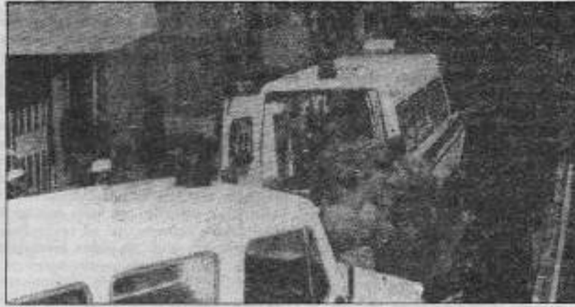
Saldırıdan sonra yaralı tutsaklar hücrelere konulurken öncelikle, devletin şakıdıkları hastanelere kaldırıldı.

4 Ocak günü Ümraniye Cezaevi'ne, demir çubuk, oyp, kalas ve diğer aletlerle saldıran, polis, jandarma ve bir kısım gardiyanlar ele geçirdikleri tutsakları ölesine döverek 3 devrimciyi aynı gün katlederken 10'u ağır olmak üzere, 40'ın üzerinde devrimci tutsağı da yaraladılar. 4 Ocak günkü saldırıda Abdülmecit Seçkin, Rıza Boybaş, Orhan Özen aldıkları darbeler sonucu şehit olurken, ağır yaralanan Gültekin Beyhan 11 Ocak günü yatığı Haydarpaşa Numune Hastanesi'nde şehit oldu. Sömürücü sınıfların, temsilcileri tarafından 4 Ocak günü yapılan saldırının sayım verilmediği gerekçesiyle yapıldığı belirtilirken, özgürlük tutsaklarıyla görüşen İHD ve ÇHD'li Avukatlar söylensinlerin yalan olduğunu, aksine olay günü sabah saat 8.00'de sayım yapıldığını, daha sonra tekrar koğuşlara gelen gardiyan, jandarma ve polislerin saat 10.00'a doğru B-1 ve G-1 koğuşlarında bulunan tutsaklara saldırdığını, tutsakları hücrelere götürüp tekrar koğuşlara getir-