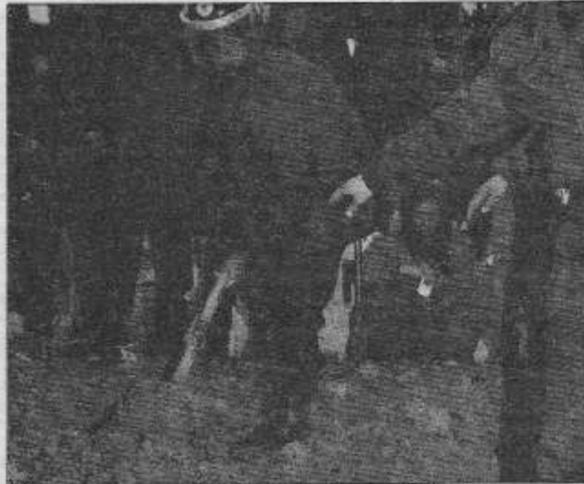
Katlettiği insanların kanıyla yaşayan katil polis, kanlı ellerini cenazelerimizin üzerinden çek.

TKP(ML) Yurt Dışı Bürosu ve ATİK yayınladıkları bildiri'de, "Devrim şehitlerini anmak, onların can bedeli yükselttiği direnişi aktif bir şekilde desteklemek demektir, şimdi gündemi özgürlük tutsaklarının devrimi ilerletmede önemli bir rolü olan işyanları oluşturmaktadır. Bu işyanı büyütelim, yükseltelim!" denildi ■