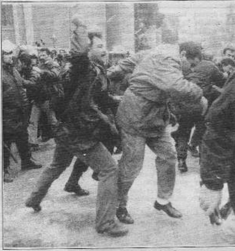
Devletin "şeffaflı polisi" her zamanki gibi toplumun huzurunu sağlamak için iş başında.

Maltepe ilçesine bağlı Gülsuyu Mahallesi'nde yaklaşık 300 kişilik bir grup tarafından "cezaevlerindeki devlet terörü" ve Ümraniye Cezaevi'nde faşist diktatörlüğün 4 devrimciyi katedmesini protesto etmek amacıyla korsan gösteri yapıldı. TKP(ML), DHKP-C, MLKP ve TİKB militanları tarafından yapılan korsan gösteriyle ilgili yapılan açıklamada; "Dost da düşman da bilsin, devrimci tutsaklar yalnız değildir. Bu anlamda tüm katliamların hesabını sorduk, sormaya devam edeceğiz" denildi.