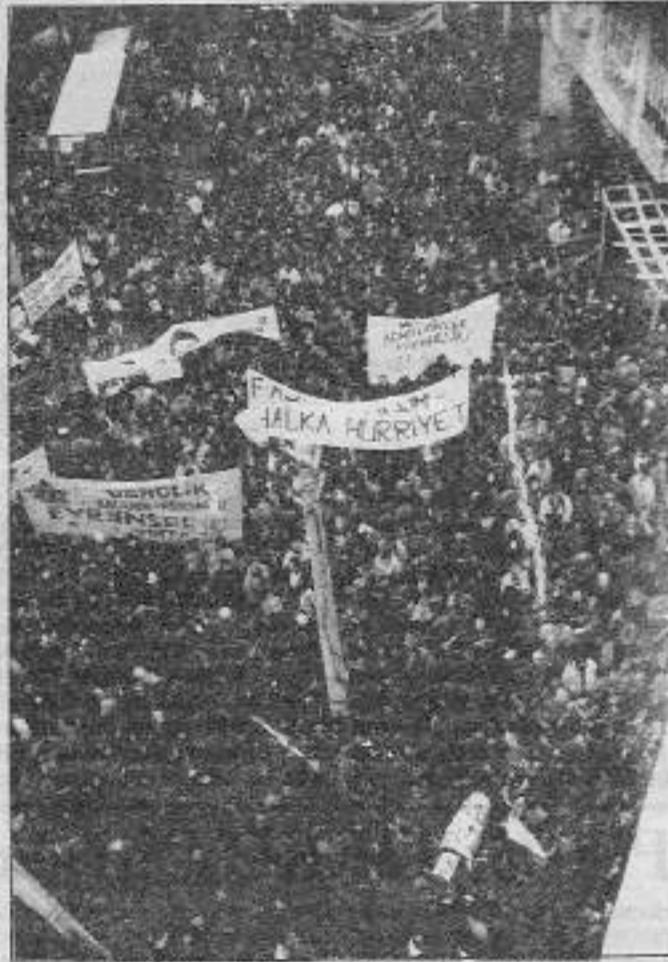
Metin GÖKTEPE'yi san yolculuğunda binler uğurladı.

Bir grup basın mensubu, sabah saat 11:00 civarında Metin'in katledilmesini protesto etmek amacıyla İstanbul Adliyesi önüne