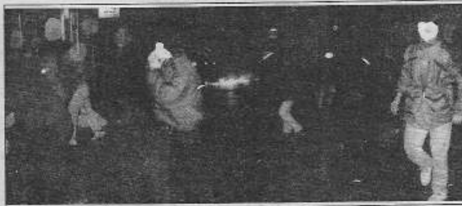
Sarımsız: insanları katleden polis, molotoflu militanlar karşısında şaşkına uğradı.

Umarız, çözümü parlamentoda arama heveslisi olanlar, halkın tercihlerini dikkate alıp, halkın gerisinde kalan politik belirlemelerden vazgeçerek bu yanlışları düzeltirler. Çünkü, egemen sınıfların vahşi uygulamaları bu cephenin (boykot) hergün yeni katılımlarla güçlenmesine neden olmaktadır. ■