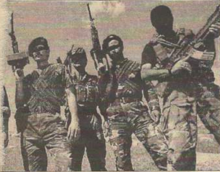
TC hükümetinin resmîleşirmeye başladığı ölüm mangaları bundan böyle daha çok yakacak yıkacak...

■ Özel Tim denilen "Rambo" tipinin binlercesi yetmezmiş gibi bu sayı tam sekiz katına çıkarılıyor. Tansu Çiller tarafından "böcek yiyen böcekler" olarak tanımlanan ve mevcudu üç bürokratça çoğaltılabilecek bir özel ordu kurma girişimleri başladı bile... Bu da göstermektedir ki bundan böyle daha çok katliam daha çok soykırım yapılacaktır.