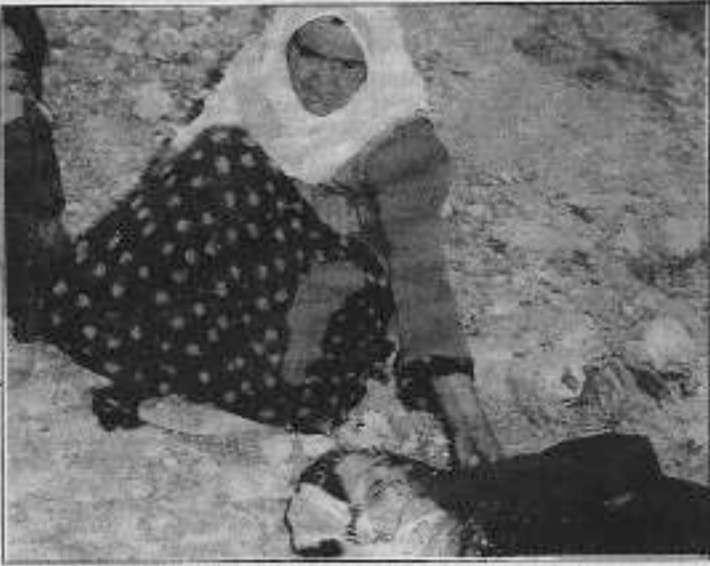
Nice isyanlar, nice kavgalar görmüş olan Dersim halkı PKK'nın tehditlerini onur kırıcı buluyor

Son zamanlarda Dersim halkı, kabullenemeyeceği ve daha da önemlisi hiç de hakemediği tehditlerin, dayatmaların şaşkınlığını azülerek yaşıyor.