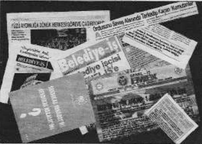
Süregiden Genel-İş ile Belediye-İş arasındaki rekabet sendikaların yayınlarıyla körükleniyor.

Küçükçekmece'de bu son eylem oldu. Bu olaydan sonra Genel-İş devreye girdi. Ve sendikal rekabet devri başladı.