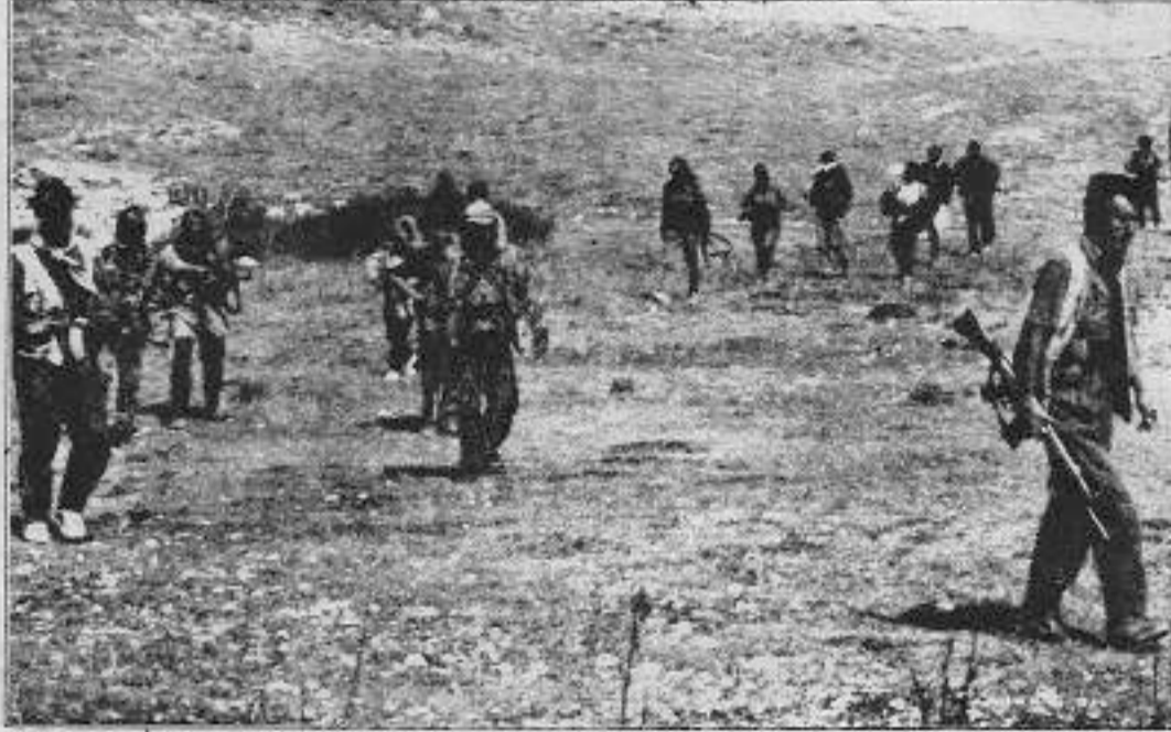
TKP/ML-TİKKO gerillalarının eylemleri 1. Olağanüstü Parti Konferansından sonra yoğunlaştı

alıcı olmuştur. Bu yüzden takviye birlikleri etkisiz kalmıştır. Gerillalar üslerine kayıp vermeden geri dönerken geride 10'dan fazla TC askeri ölü, 18 kadarını da yaralı bırakmıştır.