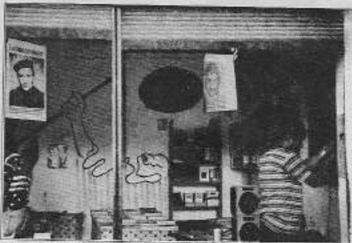
Bütün baskı, işkence ve tutuklamalara rağmen Özgür Gelecek Kitabevi hep açık kaldı.

Süreç, Kayseri devrimci-demokratlarına güzel duygular yaydı ve demokratik hakların ancak mücadeleyle kazanılıp, mevzilerin direnilerek ve dayanışmayla korunup geliştirileceğini gösterdi. Ve Kayseri Fuarı'nda Sosyalist basın kazandı.