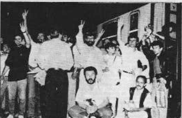
Sosyalist Basın 1990 yılında Sansür Süngün (413) Karamamelerine karşı çeşitli eylemler düzenlemiştir.

Newroz Dergisi hakkında da iki ayrı kapatma davası açıldı. Newroz'un 18. sayısında yayınlanan davada da derginin kapatılması istendi.