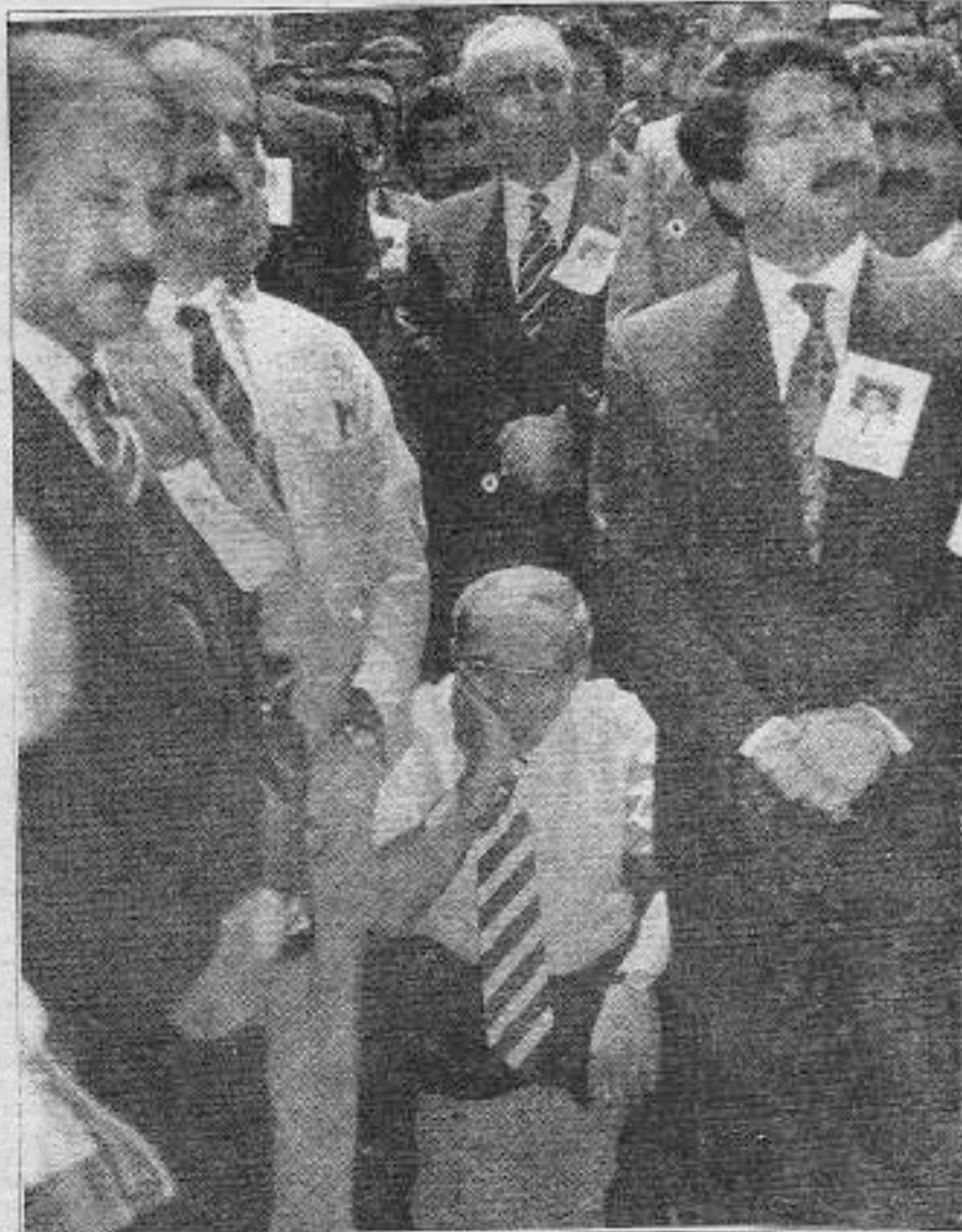
Önce hükümete güvenoyu vermek ve katliama ortak olmak, sonra da ağlayıp sızlanmak fayda vermiyor.

"Ağır tahrik var" diyenler ırz düşmanlarıyla aynı kafayı taşıyorlar. Tecavüzcüdü bunların hepsi Mumcu'nun ölümünün hemen ardından faillerin bulunacağına dair namus sözü vermişti bunlar. Namussuzluklarını açıkça belgeliyorlar. Almanlara Solingen'deki dazlak katliamında itfaiye 7 dakika geç geldi diye küfür edenler 7 saatlik Sivas katliamıyla küfürün hangi düzeyini hak ediyorlar. Ekip otosunun hıparlörünü katliamcılara tahsis edecek, birlikte oteli taşıyacak kadar adileşen Türk polisi; Sultanahmet'te Sivas olayı protestosunda, Ankara'daki memur eylemlerinde kendisi de memur olduğu hâlde görev ve yetkisinin çok ötesinde davranarak (emir kulu lafı adı bir yalan) çirkefleşebiliyor. Herkesle dalga geçer gibi bu namussuzlar ve katiller sürüsünün en tessüllilerinden Türkiye aynı günlerde gazetelere, seçimlerde bile vermediği çapta yarım sayfa "ülke bütünlüğü tehlikede" ilanı veriyor. Bütün bunlar, çıkan çivinin kaybolduğu yani yerine konma şansının olmadığını gösteriyor.