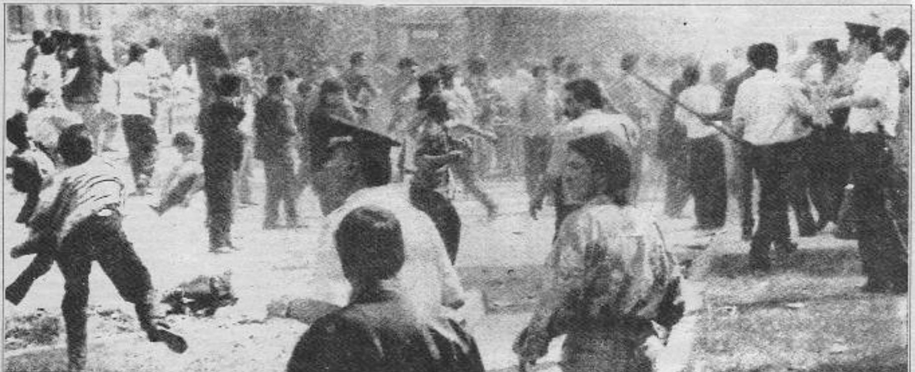
Ekip otosunun hopörlerini katliamcılara tahsis ederek, birlikte oteli taşıyacak kadar adileşen polis düzene sadakatini yerine getiriyor.

Sivas katliamı vesilesiyle değinilmesi gereken bir diğer konuda aydınlardır. Bir kere her şeyden önce biz, aydın deyince bilimsel, kültürel, sanatsal bir faaliyet yürüten ve kendi çapında etkili olup da anti-faşist anti-emperyalist bir politikanın takipçisi olmanı anlıyoruz. Yoksa her öğretim üyesi, her yazar, her ozan aydın olmaz. Türkiye'de aydın bugün için ismine uygun bir aydınlatıcılık fonksiyonunu çok cılız biçimde oynamakta, esas olarak ideolojik siyasi hattındaki temelli sakatlıklar nedeniyle proleteryanın davasına ciddi bir katkıda bulunamamaktadır. Toplumsal olaylar ve gelişmeler karşısında genel olarak tutarsız bir tavır izlemekte sınıfta kalmaktan kurtulamamaktadır. Aydınlarımız, bugün her türlü pislik, olumsuzluk ve kötülüğün esas kaynağı olan devletin ve sistemin dışında kalabilmeyi, onunla or-