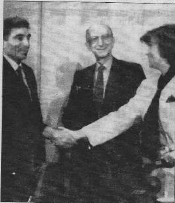
Meral; "Biraz geç oldu ama temiz oldu" diyor sanki. Çiller ise, "Hemen güneliyim TÜSİAD bekliyor" dercesine aceleci. İnönü de; "Yi yaptın Tansu" der gibi...