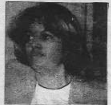
İşçiyi 2 anahtar (I) vaatmişti

Siyasi iktidara karşı konulan tavır verdiği umut, umutsuzluğu doğurmuştur. Toplu iş sözleşmelerimizi sını-