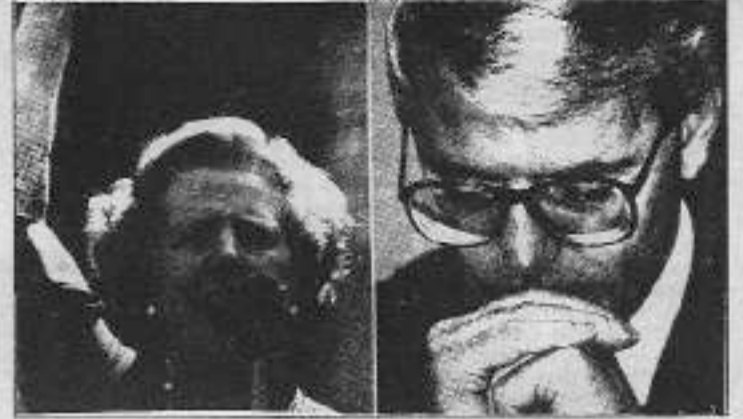
Demir Leydi ile Major arasındaki fark, İngiliz burjuvazisinin eski durumu ile yeni durumu arasındaki farkın ta kendisidir.

gününde anlaşmaya varamayan, dört işbirlikçi tartışmaya devam edeceklerdi. Ama İrlanda işlerinden sorumlu devlet bakanı Peter Brooke, görüşmelere devam etmenin gelecekteki görüşmeleri olumsuz etkileyecek riskli bir tutum olacağını belirterek toplantılara son verdi. Ünlü "İngiliz demokrasisi" ulusal soruna tartışılmayacak kadar korkak davranmak zorunda kalmıştı. Bu arada IRA, eylemlerini İrlanda'dan İngiltere metropollerine kaydırmaktaydı.