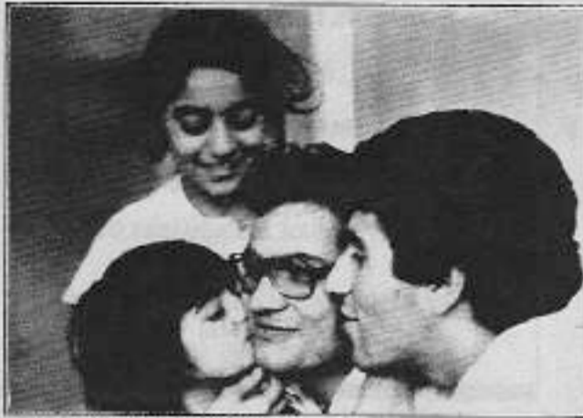
M.Ali, sevgi yumağı içerisinde