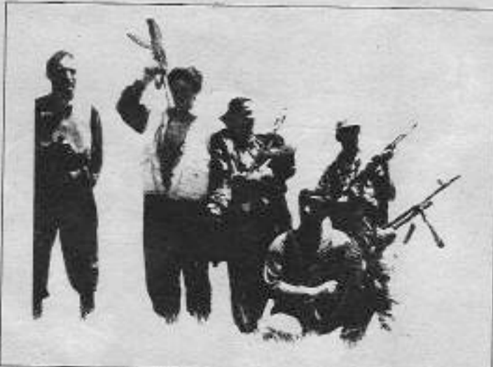
Gerilla kadınlardan çağrı: "Kurtuluş, parti çatısı altında birleşmek ve birlikte savaşmaktan geçer."