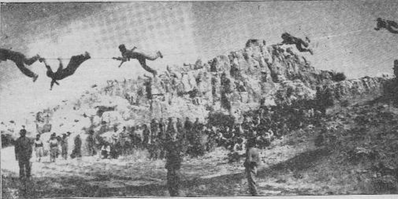
PKK gerillaları Bekaa'daki kampta eğitim yaparken.

sempatizanlarını vergiye bağlama ve kendi örgütsel işlerini yapmaya zorlaması, kabul etmeyenlerin sürgünle tehdit edilmesi.