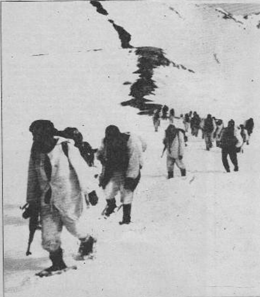
Yürek alesi, kavgaya ateş, neyler ki kış?

Ve alınan karar kavgamızı dağlarda sürdürerek dağı aşmak, diğer münkadaki kamplara ulaşmaktı. Göç dizildi dağlara, son hazırlıklar yapıldı. Birçok yoldaşın durumu iyi değildi. Birlik kalabalıktı ve ağır