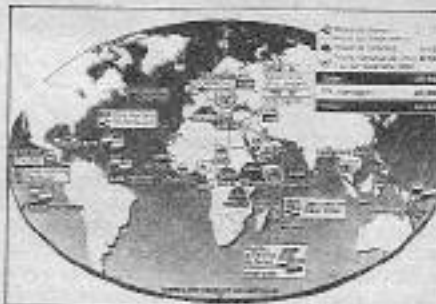
Dünyadaki Fransız ordu güçleri

Somali işgali öncesi bir yıl içinde Fransa BM denetimine yolladığı asker sayısı 14. sıradan 1. sıraya geçmiştir. Yapılan raporlarda Fransı askerleri uzmanlar, Fransız ordusunun kendi potansiyel sınırının dışında fazla asker yollayacağını belirtiyorlar. Şayet, sağlıklı bir plan yapılmazsa, diğer askeri operasyon bölgelerinden (Yugoslavya-Kamboçya) çekilmezse Somali tipi yeni bir operasyonla Fransa'nın yakın bir zaman içinde tehlikeli ve hassas bir durumda karşı karşıya kalacağını belirtmekte. Savaş bölgelerine asker yollamak için insan bulmak mümkündür. Fakat askerlerin eğitim sorunu, askeri operasyonlar için barınan finansmanların, savunma bütçesine oldukça yük olacağı ve bunun, varolan Fransa'nın ekonomik durgunluğuna daha fazla sebebiyet vereceği belirtilmektedir. Körfez savaşından sonra Fransa toprakları dışına yollanacak askeri güçlükleri konusunda