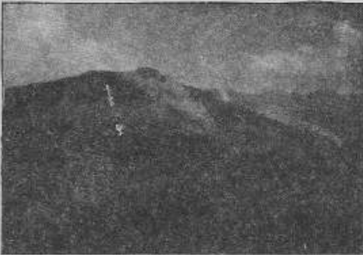
Gerillanın korumaya aldığı ormanlar, devlet tarafından acımasızca yakılıyor.

Tam da bu alanda Mao'nun teorisi aciliyetini hissettirir. Esas olan, başta gelen DEVRİMİ KAVRAMAKTIR. İmperyalist düzensizliğin düzeni "yeni dünya düzeni" ne, görelî güç kazanan gökkubberin altındaki sağlığı ve dünya gerçikliğine karşı Mao'nun öğretisi bugün fevkalade çözümdür. Onu kullanmasını bilenler için. Maoizmi yakalamasını bilelim. Geçirmiş olanlar için 100. doğum yıldönümü, isterim ki bir vesile olsun.