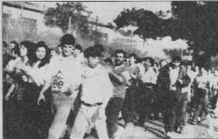
Deri işçileri: "Bu bir savaş ve biz bu savaşı kazanmak zorundayız."

Sendikacıdan sonra söz alan bir işçi ise arkadaşlarına şu sözlerle güc veriyordu: "Yıldardır açlık ve sefalet içinde sürdürdüğümüz yaşamımıza son vermek istiyorsak birlik olmalıyız. Değersizden kurtarıcı