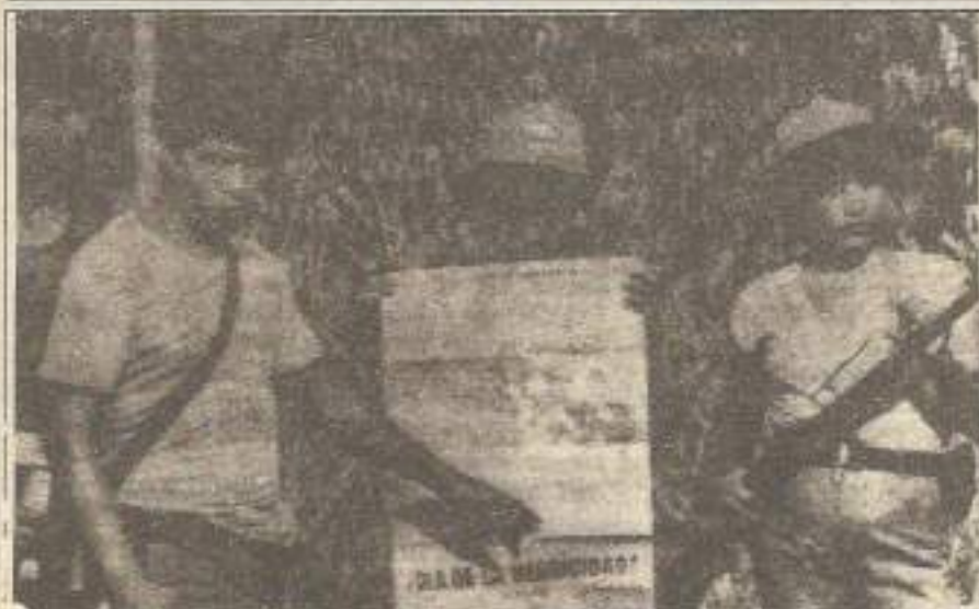
aşist Peru rejimi PKP'yi durduramıyor.