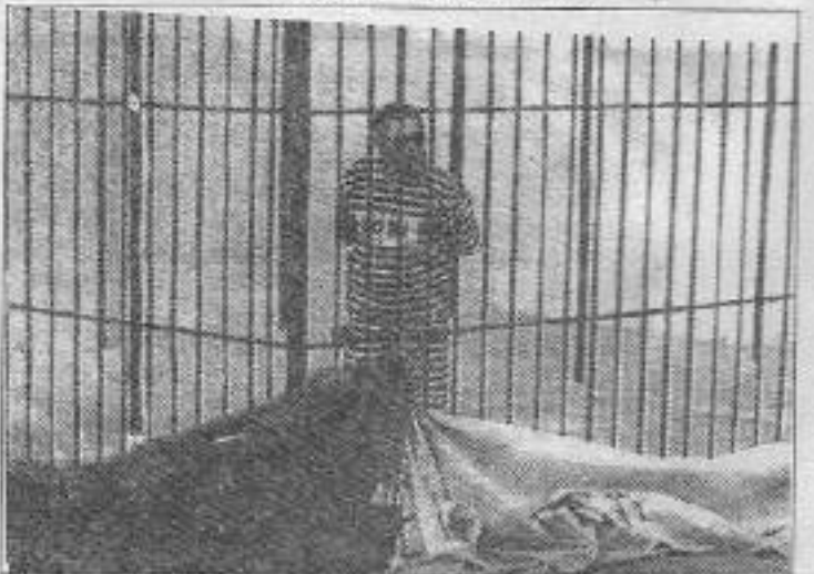
Dr. Abimael GUZMAN'ın O'nu baskı gören herhangi bir insandan ziyade bir komünist olarak savunmalıyız