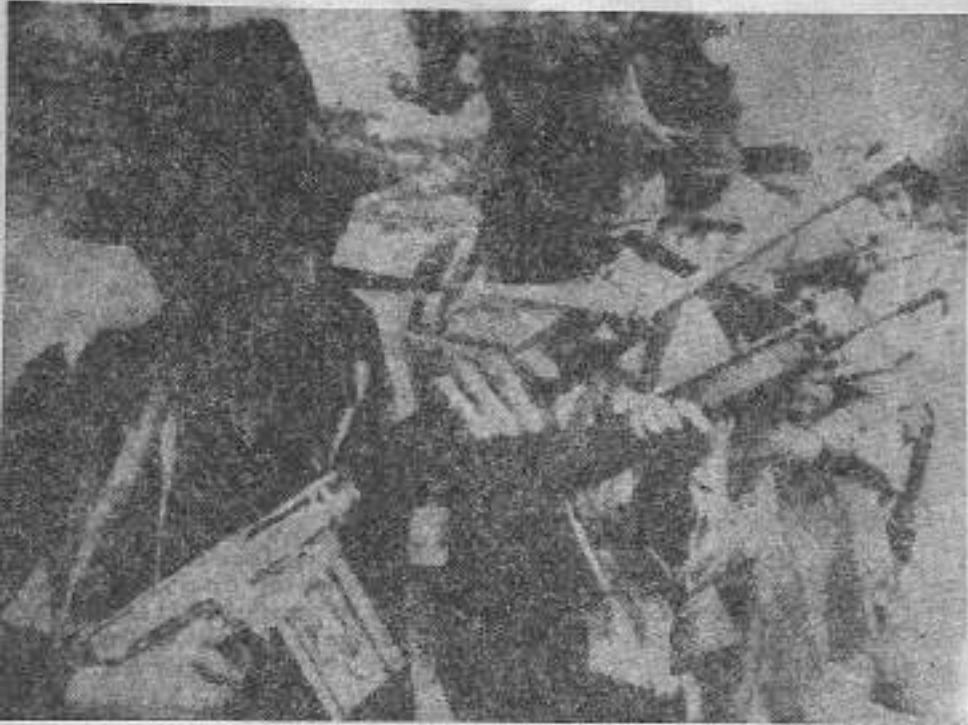
PKP Halk Gerilla Ordusu, bir günde yüzlerce vuruş yapabilecek kapasiteye ulaşmıştır.

MPP, bu görüş değişikliğine Avrupa'da, özellikle de Almanya'da siyasi güçlerle yaptığı tartışmalar sonucu vardığını açıkladı.