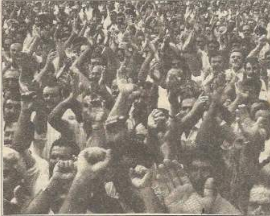
3. Sayfa Bu pisliğe "Temiz Eller Operasyonu" değil, bu ellerin kudreti gereklidir.

■ Eğer devlet, halkın bağımsızlık ve Halk Demokrasisi mücadelesini kanla, kurşunla bastırmayı gelenek haline getirmişse, toplumsal çürümenin baş nedeni ise ve bu gerçek ayyuka çıkmışsa, bu onun ömrünün bir hayli kısaldığını gösterir. Bu pislikten bireyleri kurban ederek kurtulamazsınız! Ancak muazzam bir alt-üst oluş, yani bir devrim sizleri bütün pisliklerinizle beraber layık olduğunuz yere gömecektir.