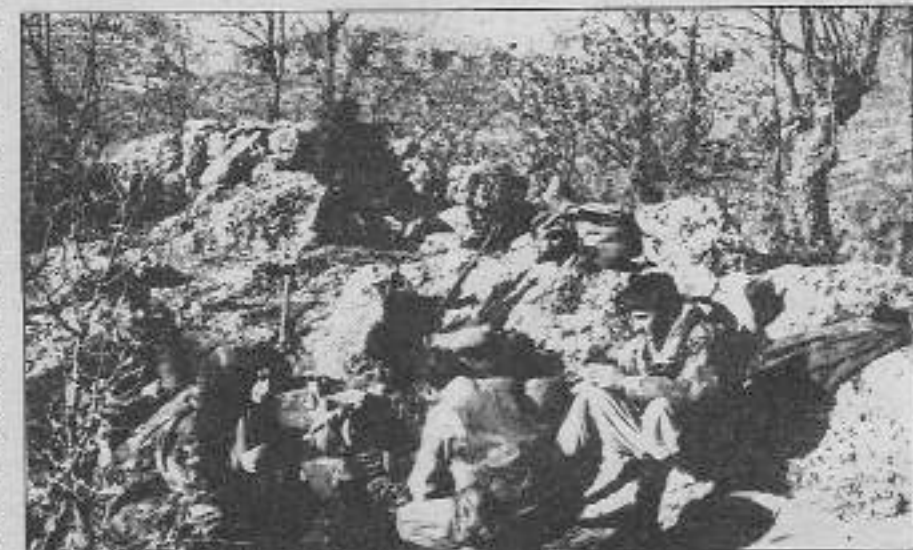
PKK gerillaları bir planı tartışırken.

PKK Temsilcisi: Siz de iletin. TKP/ML Temsilcisi: Elbette.