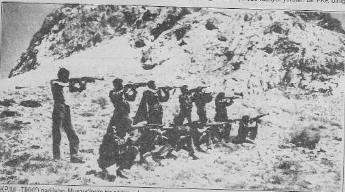
TKP/ML-TİKKO gerillaları Munzur'larda bir eğitim çalışmasında.