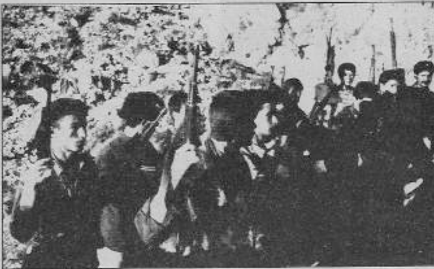
TKP/ML-TIKKO gerillaları bir birling esnasında.

anlayışıyla gelinmesin. Şayet Kürt halkının diğer temsilcileri varsa, onlara da hesap verilir ve hesap da alınır.