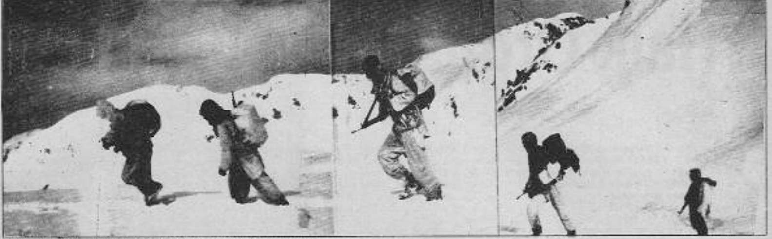
Dünyanın en güzel resmini yaratana kadar yürüyecekler...

yoldaşlar "Önümüzdeki birçok köyde düşman var" dedi. Güneş almıyla birlikte yeniden başladı kavgamıza. Bu kez karşı koyamadık, düşman rasgele tarıyordu dağları. Uçaklar ve helikopterlerin vızılını kulak çınlattı. Rüzgar izimizi kapatmıştı. Öğleden sonra düşman, boşa çıkan ope-