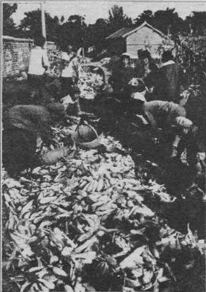
Revizyonistlerce dağıtılan köy komünlerini, “efsanevi” Çin köylüsü yeniden yaratacaktır.

Geçmişte öncüsüyle birlikte tart kendisi hak da karar al Çin köylüsü şimdi 1976 öncesinin ortamını yeniden yaşama çabası içerisinde