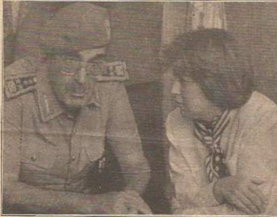
3. Sayfa "Asker sivil elele topyekün savaş sendromuna"

■ 70 yıllık soykırımcı, politikaya rağmen, Dersim, Botan vb. bölgeler egemenler için "çıban başı" olmaya devam ediyor. Hem de eskisinden daha güçlü ve daha bilinçli olarak. Paşaların deyimiyle "Cumhuriyetin kahredici orduları" gerilla savaşı karşısında aşıp kalmışlardır. Her geçen gün gerilla alanlarının çoğalması ve geniş halk kesimi tarafından destek görmesi onların baş çıkmazı durumundadır.