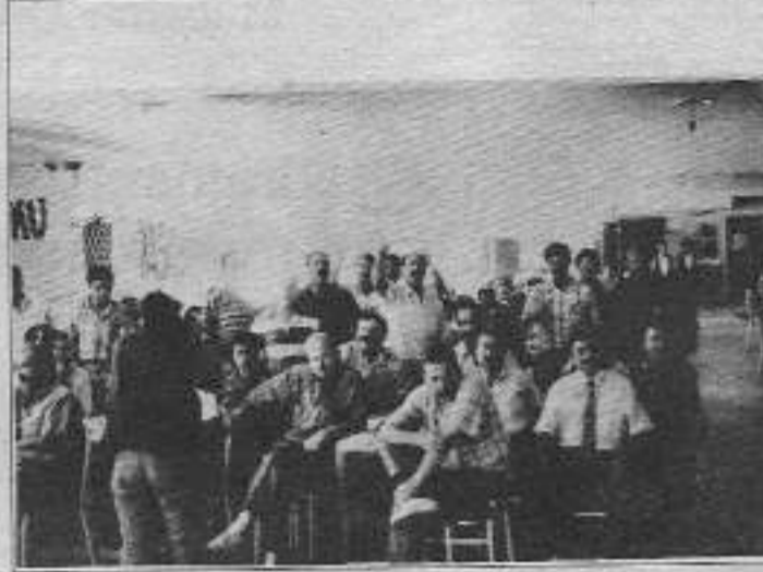
Temsilciler ısrarla genel grev dedi...