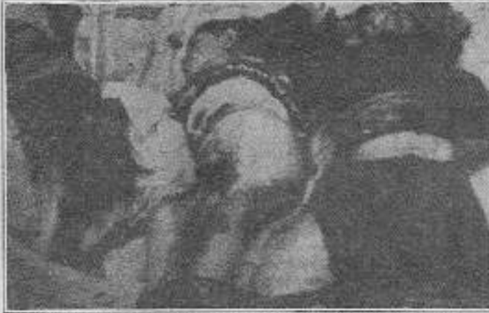
Kontrgerilla Sündüz Yaylası'nda acımasızca çocuklar ve kadınlardan oluşan 23 kişiyi katletti

DEP Diyarbakır Milletvekili Hatip Dicle katliamla ilgili yaptığı bir basın açıklamasında "Olayın kontrgerilla tarafından yapıldığına inanıyoruz. Kontrgerilla, PKK'ya karşı psikolojik üstünlük sağlamak için bu tür katliamlara yöneliyor. PKK'nın terörist bir yapı olduğunu kanıtlamaya yöneliktir" diyordu.