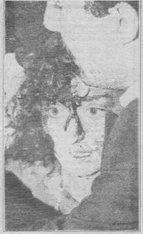
Kadın-erkek, genç-yaşlı demeden yakılarak ağır yaralanan insanların tedavileri dahi engellendi.

Çünkü en boyuk deyimle bu bir devlet politikasıydı ve benzer durumlarda verilecek demeç ve emirler anayasada yazılıymışçasına belliydi. Bu yüzden kimi çevrelerin yaptığı gibi olayı devletten soyutlamak için bireysel suçlular (içişleri bakanı, vali, emniyet müdürü vb.) ilan etmek bilinçli ya da bilinçsizce katlimin gerçek yüzünü gizlemeye yaramaktadır. Zaten devlet de hemten emniyet genel müdüründen Sivas emniyet müdürüne, validen belediye başkanına kadar tüm alt kademelere tırpan vurarak akılsıra kendini kurtarmıştır. Olayda, suçlu A.Nesin'e ve katliama uğrayanlara yüklerle-