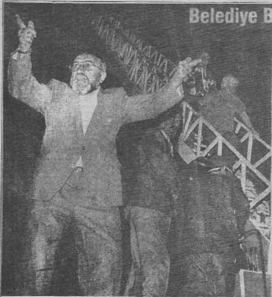
Egemenlerin "görevini yaptık" dedikleri, otelde mahsur kalan insanları kurtarmak için gelen itfaiyenin merdivenlerini oteden uzatıştırmaktır.