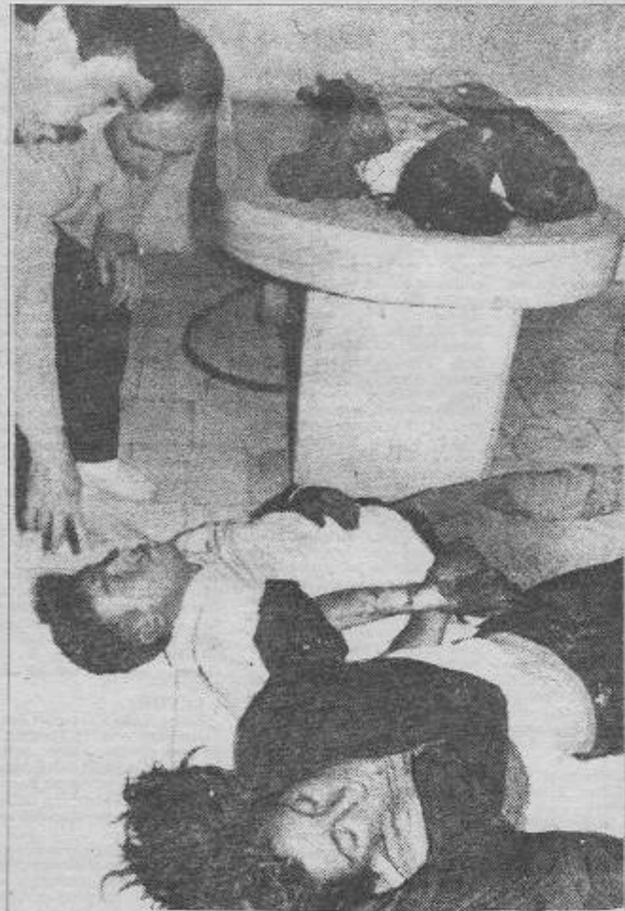
TC'nin beslemeleri kendilerine biçilen rolleri en mükkemel biçimde oynatarak savunmasız devrimci-demokratları Sivas yangının dumanlarında hunharca katlettiler.

Kamuyunun belli bir kesiminde oluşan alışlagelmışin dışında sayılabilecek tepki yoğunluğu katlimin ilk günlerindeki yorumların İlerleyen günlerde değişmesine yol açtı. Ancak olaydan devlet sıyrılmaya çalışma tavrı genel olarak değişmedi. Faşizm ile anladığı cilden mücadele etmenin karşısında olanlar ile olayı laik-anti laik, şeriatçı-kemalist çatışması şeklinde göstermeye çalışanlar da sonuçta bu cephenin içinde kalıyorlardı. Elbette, bugün görünürde bu tip çekişme ve çelişmelerin varlığından söz etmek mümkündür ancak laikler ile anti-laiklerin, şeriatçılar ile kemalist cumhuriyetçilerin aynı soydan gelme kardeşler olduğu gerçeğini de kitlelere kavratmak, haklı doğru bilinçlendirmek durumunda-yız.