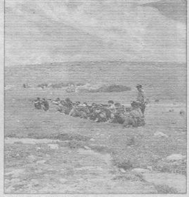
Umut dağlarda ataktadır şimdi.

Artık iki kalışmıktaydık, üç bombamız ve bir miktar cephanemiz var-