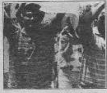
1 günlük uyarı eylemlerinden

Deri-İş sendikası Tuzla Şubesi'nden bir temsilci de işçi sınıfının çetire sorunları karşı karşıya kaldığını söylüyor ve bu sorunların uluslararası sermaye ve onların yerli işbirlikçilerinin emperyalist saldırılarından kaynaklandığını