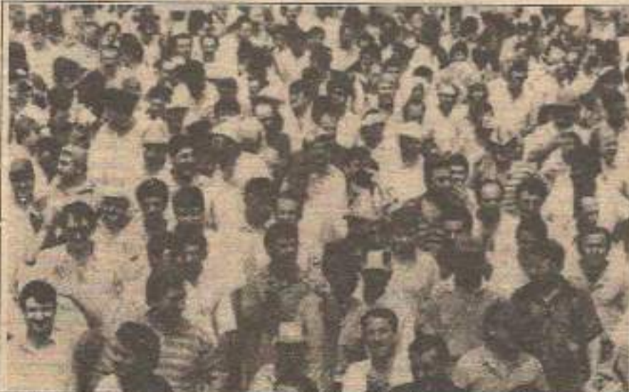
Toplu sözleşmelerin yaklaşmasıyla birlikte sınıf, ekonomik ve demokratik taleplerini sokağa taşıyor.