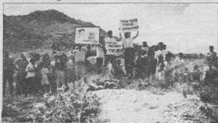
Tekin Çakmak mezarı başında yoldaşları tarafından anıldı

rim şehitleri için saygı doruğunda bulundu. Bir yoldaşı Tekin Çakmak'ın hayatı ve mücadelesi üzerine konuştu: "Dersim yöresinde bir Devrimci Sol savaşçısı olarak düşünene korku salan ve halk arasında Altıparmak olarak ünlenen Tekin Çakmak 12 Eylül darbesinden sonra İbrahim Kaypakaya'nın görüşleriyle tanışmıştır. Halkın gerçek öncüsünün TKP/ML olduğuna karar vermiş ve özleştireti vererek TKP/ML saflarına katılmıştır. Öncünün saflarında şehit düşüğü güne dek tam 3 yıl savaşmış ve herkesin büyük sevgisini kazanan örnek bir gerilla olmuştur." Anma sloganları eşliğinde sona erdirildi.