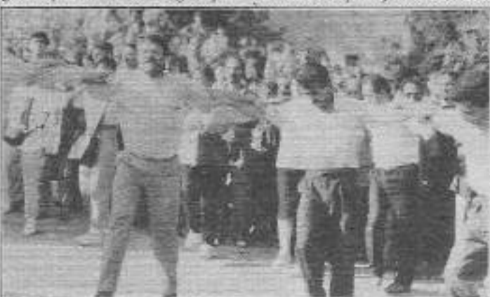
Memurlar Sultanahmet'te halayda. Mücadeleye kabildikça o klasik memur imajını değiştiriyorlar.

Bildiride "Zenginlerin trilyonlara varan vergi borçlarına bir çarpıda kalem çekenlerin, emekçilere yüklenmeleri ve memurların örgütlü gücü olan sendikaları mahcup almadıkları" vurgulandı. Bildiri şöyle noktalanıyordu: "Kamu emekçileri olarak bundan sonra haklarımızı alıncaya kadar meşru ve demokratik zeminde mücadele edeceğiz."