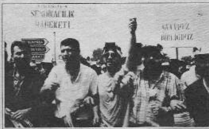
22 Temmuz'da bütün emekçiler yollardaydı.

Millî Eğitim Basımevi, Damga matbaası ve Darphane'den yaklaşık 800 işçi Sultanahmet SSK Dispanserine geldi. Onlara 120 kişilik TEK memurları da katıldı. Yürüyüşte polisin yoğun önlemler aldığı görüldü. TEK işçileri bir davulcuyla yürüyor ve davulcu sloganlara ritim tutuyordu. Kafe Eminönü Belediyesi önünden geçerken onları Tüm Bel-Sen Üyesi memurlar alkışladı. Belediye önünde toplanan memurlar ve işçiler birbirleriyle "sloganlaşarak" selamlaşarak, işçilerin en çok attığı slogan genel greve ilişkin sloganlardı. Sloganlar