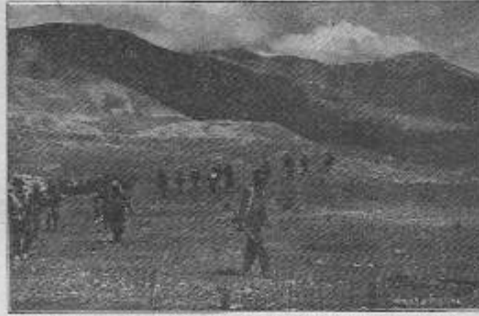
TIKKO gerillaları Dersim'de Topyekün savaşa karşı koyma yürüyüşünde.

Çemişgezek ilçesi TIKKO gerillaları tarafından basıldı. Roket ve ağır silahların kullanıldığı çatışma-