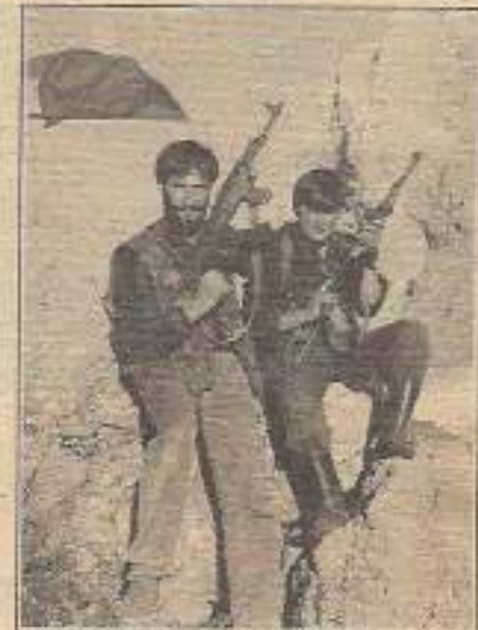
Esaretten kurtuluşun şah damarını gerillada bulan kadın Muztur'un zirvelerinde özgürlüğü soluyor.