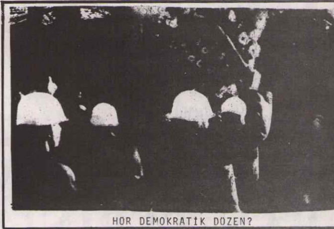
HÜR DEMOKRATİK DOZEN?

dirler. "Bu yüzden" halk kısırtıcı ajanlara karşı uyanık olmalıdır". 12 Mart kısırtıcı ajanların tahriklerine kapılan bir avuç nene yüzünden demektir. Simdi aynı oyun yeriden oynanmak istenmektedir."