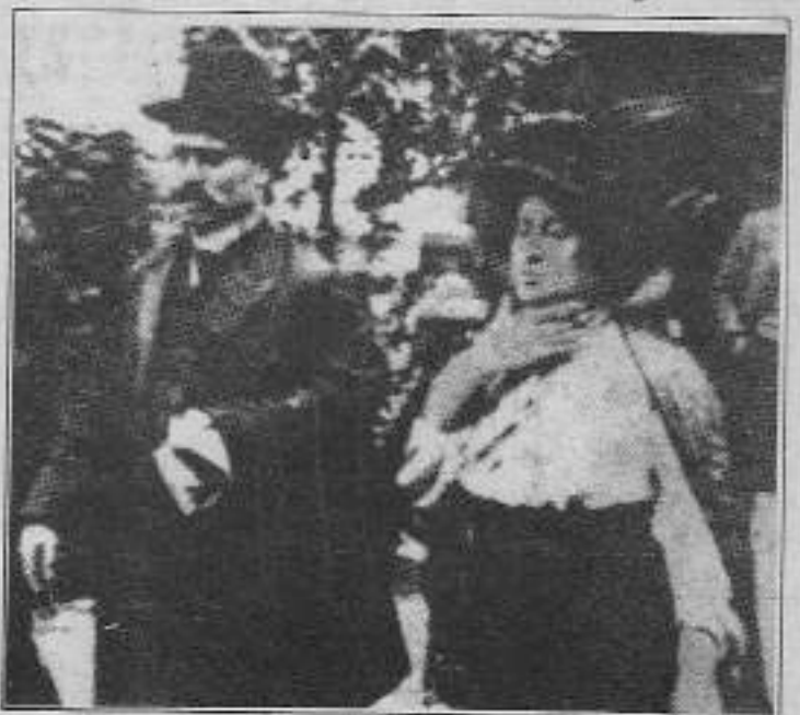
li komünist lider faşist Alman devleti tarafından 75 yıl önce hunharca katledildi.

O Rosa ki, yaşamını emperyalist sosyalist bir ruh ile dünya halklarına adanmıştı. Polonya'da dünyaya gelen Rosa, ilk gençlik yıllarından itibaren sosyalist harekette yer aldı. Politik nedenlerle ülkesini terkederek Rosa Avrupa'nın çeşitli yerlerinde aktif olarak mücadele yürüttü, sürgüne uğradı ve zindarlarda yatı. Paris'te, "İşçi Davası" gazetesinin önde gelen yazarlarından oldu. Almanya'da "Yeni Çağ" dergisinin teorik öne ilüğüünü yaptı. Birinci Dünya Savaşı patladığında arkadaşlarıyla birlikte Alman Sosyal Demokrat Partisi'ne (SDP) cepheaden savaş açtı. Savaş önderleri için olumsuz oy kullandı. "Emperyalist savaşçı iç savaşa dönüştür-