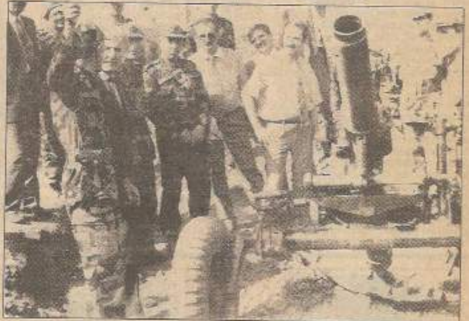
Halk çocukları zorla askere alınıp halka karşı savaşılırken kodamanların çocukları keyif yapıyor.