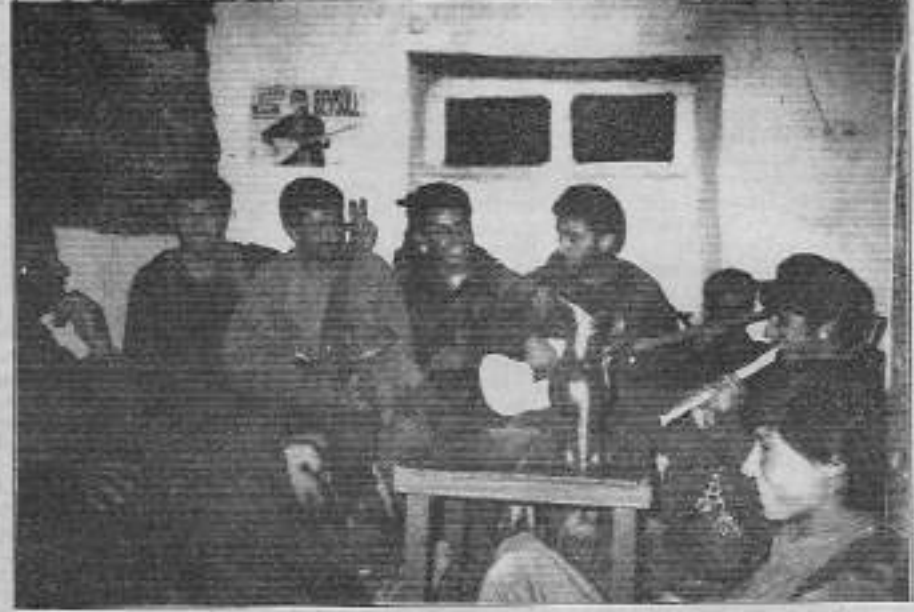
Çeşitli gerilla birliklerinin, dinlenme saatlerinde yaptıkları bazı kültürel faaliyetler.

Halk savaşının temel toplumsal dayanağı köylülük olduğundan, ordunun oluşumunda esas olarak köylü ağırlıklı olacaktır ve bu durum nesnel olarak ordu bünyesinde belirleyici bir güç