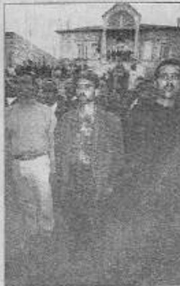
Rabin-Arafat antlaşmasıyla, polislik yapan Filistinliler

Çözumsuzlük görüşmeleri Filistinliler ile İsrail askerleri arasındaki çatışmalar eşliğinde sürerken, Ürdün Kralı Hüseyin, Arafat'ı son bir dile uyandı. 2 Ocak günü Askeri Komuta Köşeyi önünde yaptığı konuşmada, Hüseyin "Ona sözünden konfederasyon terimini silmesini söyledim," dedi. "İki taraf arasında belirlenen yükümlülükler geçiş yükümlülükler olmalıdır, havada kalan sözler değil," şeklinde konuşmasına devam eden Hüseyin, "Var olmayan antlaşmalar konusunda sürekli konuşup duramazsınız. Bu nedenle anlamlı bir yükümlü-