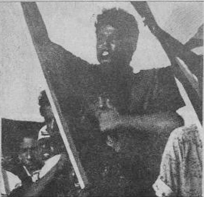
İsyanı haykıran Filistinliler.

Bütün bu karmaşık trafiğin ortasında, Filistin halkının haklı silahlı mücadelesi filizleniyordu. Bu filiz, çok fazla zamanı gerek duymadan güçlenecekti.