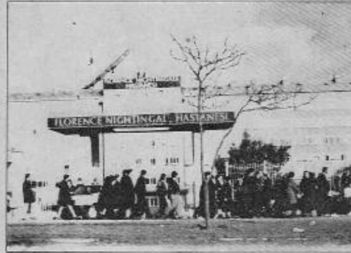
Florence Nightingale işçileri hastanenin önünde yürüyorlar.

ise karma bir yapıya sahip. Yeni alınan elemanların hemen hepsi bu şirkette bulunuyor; biyolog, laborant, hemşire, sekreter, röntgen, elektrik teknisyenleri, anestezi teknikerleri.