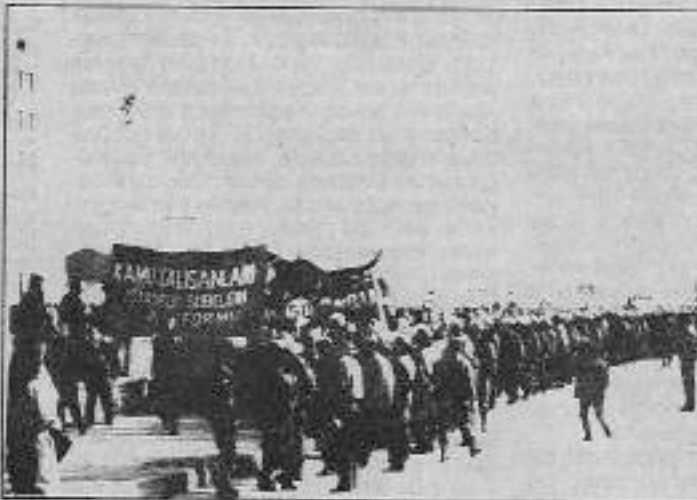
Memurlar ekonomik ve demokratik hakları için yürüdüler.

Kamu Çalışanları Sendikaları Platformu'nda yer alan 26 sendikaların ortak kararıyla yapılan eylemlere, PTT, TEK, Demiryolları ve İnanlarda işçiler de katıldı. Bir çok işyerinin önüne "Bu işyerinde grev var" yazılı pankartlar asıldı. Kamu çalışanlarının İstanbul'daki iş bırakma eylemine yoğun katılım sağlandı. İşyerlerinde işler durdu. Avrupa yakasında kamu çalışanlarından bir bölümü İSKİ önünde toplandı. Pankart açıp yürümek isteyen memurları polis engellemeye