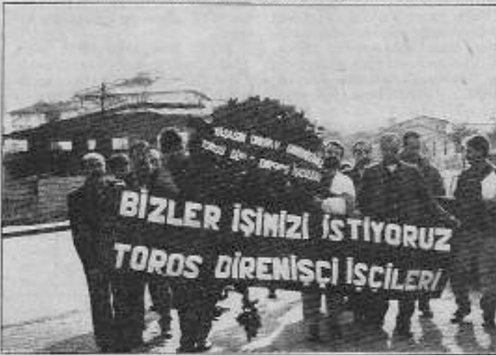
Atılan işçiler, Toros Gübre merkez binasına siyah çelenk bıraktılar.

Sermayenin ülke çalışanlarına "Acı Reçete" denen ekonomik politikalar uyguladığı, dünyada esen tasarruflaştırma, özelleştirme, küreselleşme rüzgarının ifemizi de etkilediği belirtilen açıklamada; "Enflasyon, işçi kıyımları, işsizlik ülkemizin gerçekleri" olarak ifade edildi. İnsan onuruna sahip tüm insanları, bu sorunlarla ilgilenmesi, çözümü için çaba harcamasının kaçınılmaz bir görev olduğu vurgulanarak; "Seçim meydanlarında, insanların ekonomik-demokratik taleplerini sömürerek iktidar olduktan sonra, sorumluluklarını