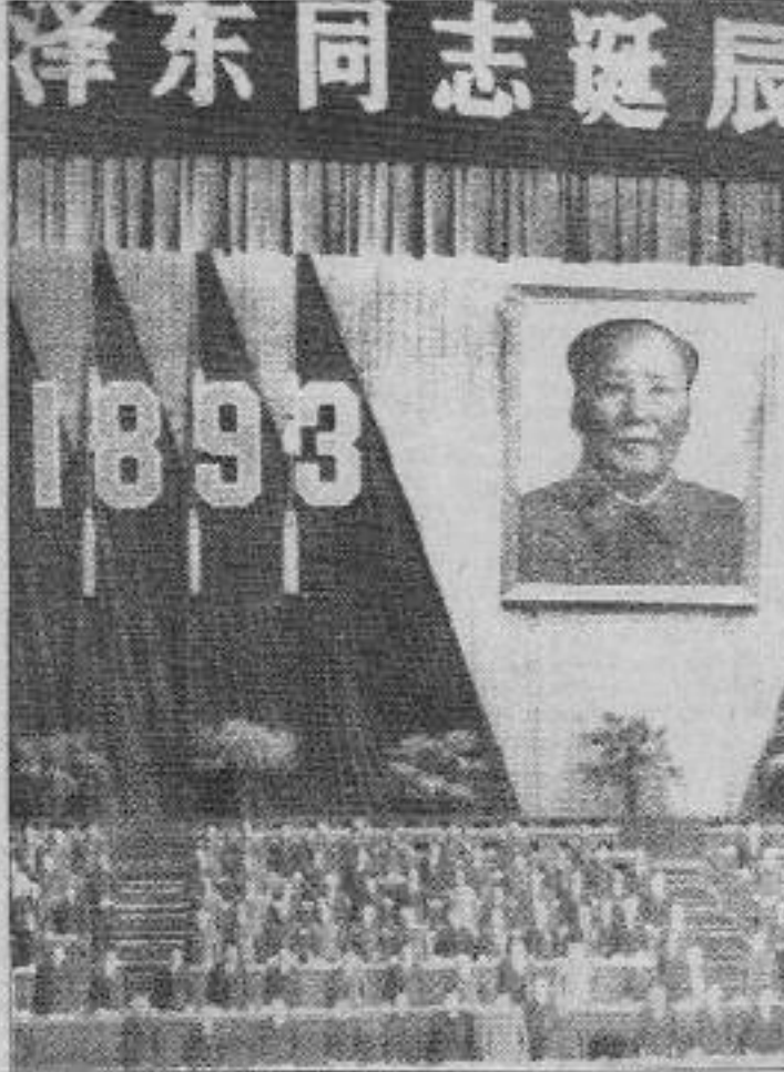
Çinli revizyonistler, hâlâ Mao Zedung'u aptıktan açığa reddedemiyorlar. Üstelik ihanetlerini, "Mao'dan esinlenerek" gizlemeye çalışıyorlar.

Deng haini, nedense (!) kutlamalara katılmamıştı. Ama Zemin, onun boşluğunu doldurmaya çalışarak, konuşmasını şöyle devam ediyordu: "Deng, Mao'nun katkısına öncelik verilmesini istedi. Mao'nun ileri yaşlarında yaptığı hataların, katkılarını gölgelemesine izin vermezdi." Neydi Mao'nun "hataları"? Revizyonistlerin sözcüsü Zemin'e göre, Mao, 60'lı yıllarda başlayıp 1976'ya kadar sürmüş büyük bir ekonomik gerilemeye ve milyonlarca kişinin ölümüne neden olmuştu. Üstelik Kültür Devrimi'ni yaparak, toplumu yıkıma uğratmıştı. Dünya çapında incelendiğinde, Başkan Mao'nun 100. doğum yıl-