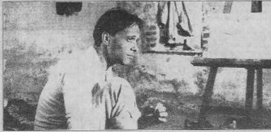
Mavi Sürgün filminden bir sahne.

Yönetmen Sineması kişilik bulma anlamında Yeşilçama oranla bir nitelik sıçraması yarattı. Geline aşama da ise kişiliğini oturtamadı. Uluslararası sermaye ve onun çekim merkezi olan festival-yarışmalar gizli bir ismarlamacılığı ortaya çıkardı. Uluslararası yarışmaya katılan yerli filmlerin teknik ve estetik olarak emperyalist sinemaya rakip olamayacağı ortada. Gene de dereceler koparıyor! Bunun nedeni ise emperyalizmin kendi insanlığıyla ilgili bütün günlük ve insani değerle-