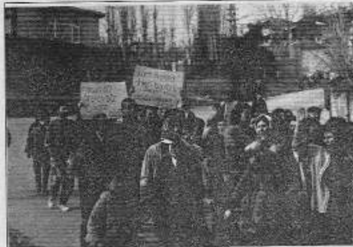
Gülsuyu halkı son zamlara isyan etti.

Gülsuyu Meydanı'nda öğleden sonra toplanıyorlar... Yaşlı, genç, çocuğu, kadını, erkeğiyle... Yaşlı bir adam konuşmaya başlıyor: "Biz Gülsuyu halkı olarak devletin baskılarını protesto için burada buluyoruz. Ülkemizde devletin "demokrasi" yalanları eşliğinde zamları, insanlara işkence yaptıklarını çok iyi biliyoruz. Devlet yolsuzluklarının, yürüttükleri kirli savaşın faturasını yapıp zamlarla bizden çıkarıyor. Konuşma süresince insanların kimileri metaktan, kimileri bikerek geliyorlar meydana... Toplanan grubun sayısı her geçen dakika da artıyor. Yaşlı adam artan ekonomik zorlukların emekçi sınıfa sırtına yüklediğine dikkat çeken sözlerini şöyle sona erdiliyor: "Zamlara, işkencelere karşı sessiz kalmamak, Kürt halkına uygulanan katliama karşı müca-