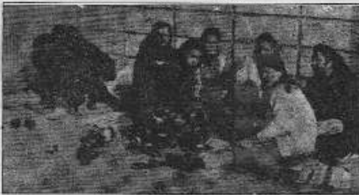
İşçiler "Ya iş başı yaparız, ya da buradan cesedimiz çıkar."

İşgallerini işbaşı yapana kadar sürdürebileceklerini belirten işçiler,