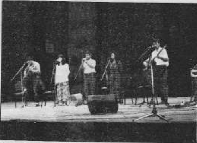
Grup Munzur ezgileriyle bir isyan ateşi.

Programına, "Değerli dostlar geçtiğimiz Ocak ayı uluslararası proletaryanın ve Türkiye proletaryasının sınıf savaşımında çok önemli bir yere sahip olan bir aydır. Uluslararası proletaryaya ve Türkiye proletaryasına birçok ustasını, öğretmenini ve savaşçısını bu ayda şehit vermiştir. Bu anlamda Türkiye proletaryası Ocak ayının son haftasını devrim Şehitleri Haftası ilan ederek meşaleleştirmiştir. Bu bağlamda ey yarınımıza ışık olup karanlığı burju burju deho yanımıza ışık olan kızıl karanfiller and olsunki zafere kadar dalgalanacak meşaleniz" sözleriyle programına başlayan Grup Munzur'u bütün kitle ayakta "Devrim Şehitleri Ölmüştür" sloganıyla yanıladı. Devrim şehitlerinin anısına hazırlanan, halkımızın kurtuluş umudunu getiren aydınlatıcı, duygusal ve yeni gerilla adaylarının gerillaya olan özlemini dile getiren şiir otantik enstrümanların eşliğinde okundu. Kitle şiiri heyecanlı dinledi. "Babanın Türküsü"nü Grup Munzur