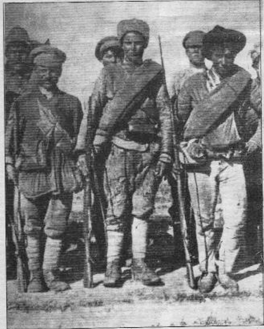
İlk Kızılordu'yu oluşturan bir grup gönüllü asker.

Stalin'in ölümünden sonra başa geçen Kruşçev ve ardılları, Kızılordu'yu da revize ederek onu sosyal-emperyalist işgal ordularını haline getirmişlerdir. Bugün ise, kapitalist yolda yürüten ve adından başka Kızılordu'yla hiçbir ortak yanı olmayan bir ordudur, bugünkü "Kızılordu".