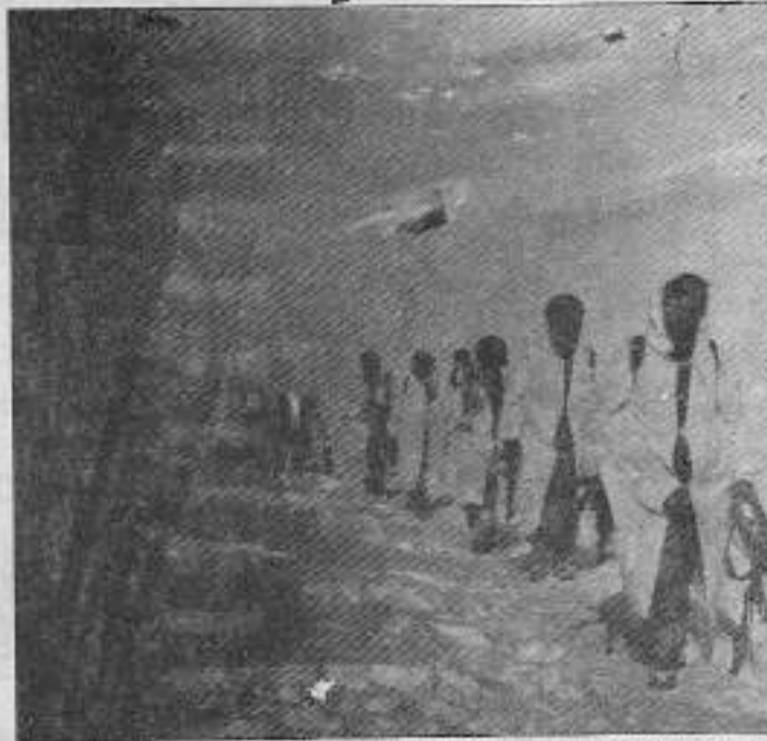
Bu kışta kıyamette Demokratik Halk İktidarını kurmak için daha bir azimle çatışıyor TIKKO gerillası

Haber Merkezi- 2 Şubat günü, Dersim'in Hozat ilçesine bağlı Uzundal (Xoşan) köyünde TIKKO gerillalarıyla devlet güçleri arasında çatışma çıktı. Çatışma sonucunda devlet güçlerinden 6 kişi ölüyor, gerillalar kayıp vermeden üstlerine çekildiler. Yerel kaynakların gazetemizi arayarak verdiği bilgilere göre olay şöyle gelişti: 2 Şubat sabahı, saat 7.30 civarlarında, TIKKO gerillaları Hozat'ın Xoşan köyündeki askeri birlikle çatışmaya girdiler. Bunun üzerine TIKKO birliğinde devlet güçleri arasında çıkan çatışma, aralıklı olarak akşam saat 16.00 civarlarına kadar sürdü. Ağız köşullarına ve kar kalınlığının yer yer 2 metreye yaklaşmasına rağmen çatışmayı başarı ile yürüten TIKKO gerillalarına karşı, devlet güçleri Hozat merkezinden geri tepmesiz top ve uzun menzilli toplar getirdi. Toplar TIKKO gerillalarını durdurmaya yetmeyince, karadan panzerler ve takviye birlikler eşliğinde saldırıya geçen devlet güçleri, havadan da helikopter desteğini ihmal etmediler. Ancak iyi mevzilenebilmiş bulunan TIKKO birliği, bütün bunları etkisiz kılarak, çatışmadan başarıyla çıktı.