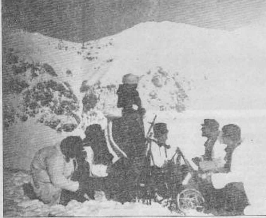
Röportaj yaptığımız bir TIKKO gerilla birliği.

— Çiller'in emperyalistler sofrasındaki alımlı turu da bu çözüm arayışında, destek bulma amacını güdüyordu ve kendi alanında bunu önemli ölçüde de başardı. Ana esas sorun, emperyalistlerin Çiller'in "tash" diline kandığı şeklinde olamazdı, çünkü kurflar so-