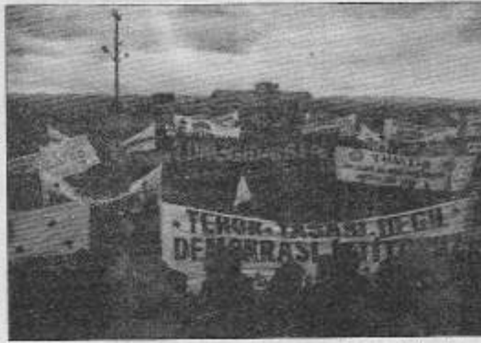
Ankara-Kasalar'da yapılan miting öncesi DISK ve Türk-İş ağaları "Miting iptal edildi." yalanını söylediler.

"Tek Yol Devrim" sloganlarının atıldığı mitinge beyaz önlükleri ile katılan Florence Nightingale direnişçilerinin attığı "Yaşamın Nightingale Direnişiniz!" sloganı, kitlelerin de "Nightingale İşçileri Yalnız Değildir!" sloganı ile cevap