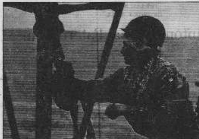
Bakü'de petrol sondajında çalışan bir işçi. Batılı emperyalistler, emekçileri "geleceğin zenginleri" demagojisiyle aldatmaya çalışıyorlar

pitalistler endişeli. Çünkü fiyatların yükselmesi ani ıflaşan getirebilir. Diğer bir sorun Rusya, Kazakistan petrolleri, ülke kara ile çevrilmiş olduğu için borularla aktarılıyor. Ama boruların hiçbirinin rotası coğrafi ve siyasi olarak problemsiz değil.