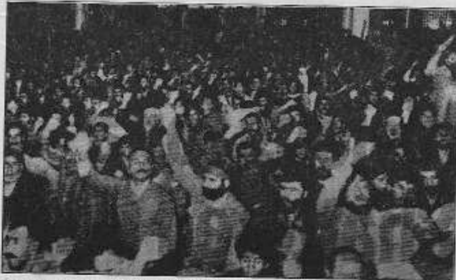
İran devriminin 15. yıldönümü kutlamalarından bir görüntü

Öte yandan yine olayla ilgili olarak ATIF, AGİF, Bolşevik Partizan (NRW), Kürdistan INFO, TKP-Kıvılcım, Dev-Genç ve İşçilerin Yolu imzalı "Bu Kaçınca Saldırı!" başlıklı bir basın açıklaması yapıldı. Saldırıların kanıdığı açıklanmadı, ATIF, "Yirmi yıla yakın bir geçmişi sahip olan, bünyesinde Türkiye ve T.Kürdistanlı emekçileri barındıran, bunların ekonomik-demokratik haklarını savunan ve bu uğurda mücadele eden devrimci-demokratik bir örgüt" olarak tanımlandı.