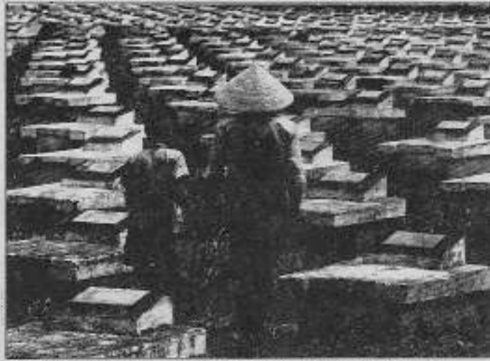
Vietnam savaşında binlerce komünist-yurtseveri katleden ABD şimdi de sermaye bombardımanı yapıyor.