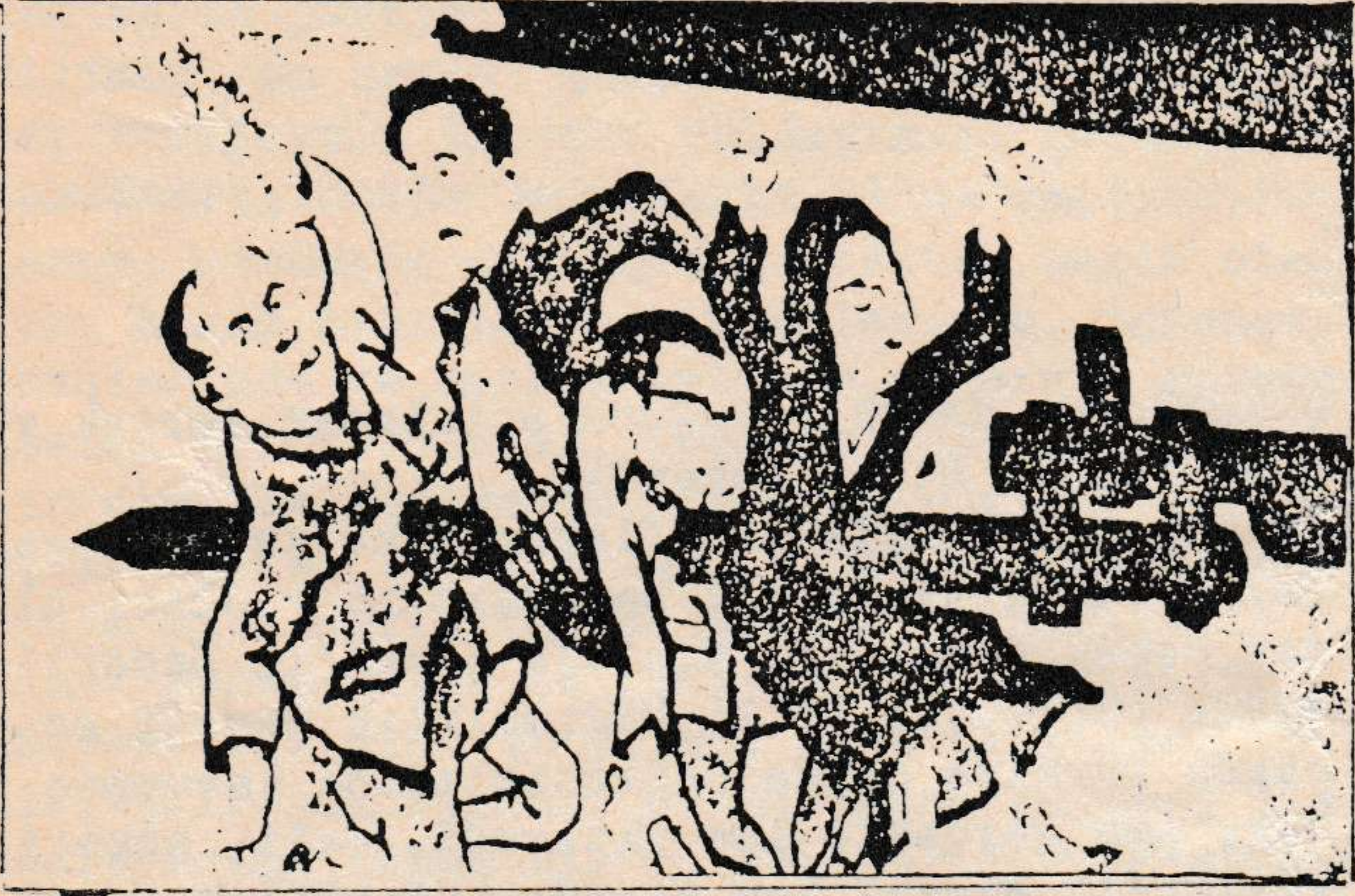
ÇİN'Lİ REVİZYONİSTLERİN "4'LÜ ÇETE"Yİ HEDEF ALAN POSTERLERİNDEN BİRİ.

Çin'de "4'lü çete"nin yargılandığı geçtiğimiz ayda, Çin'li revizyonistlerin iktidarı tümü ile ele geçirmelerinden bu yana Mao Zedung'a ve Kültür Devrimine saldırıları bir kez daha açık bir şekilde gözler önüne serildi.