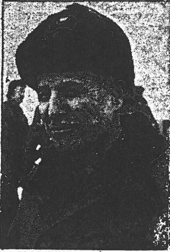
Darbe sonrası halka kan kusturmak için kurulan Milli Güvenlik Konseyinin başkanı faşist Orgeneral Kenan Evren