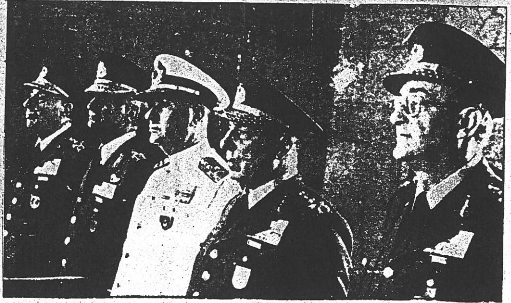
Askeri darbenin önde gelen faşist generalleri:(soldan sağa) Orgeneral Ersin, Orgeneral Şahinkaya, Oramiral Tümer, Orgeneral Celasun, Orgeneral Saltık

düşüncesini yaymaya çalışacaklar. Onların bu yaptığı bir sahtekarlıktır. Faşist ordu da, parlamento da aynı sınıflara; emperyalizme ve uşaklarına, onların faşist düzenine hizmet eden araçlardır. Bugün hakim sınıfların parlamentoyu dağıtması, parlamentonun şu anda halkı kandırma fonksiyonunu önemli ölçüde yitirdiğinden, parlamentoya halk içinde duyulan güvenin iyice sarsılmış olması gerçeğinden kaynaklanmaktadır. Darbeciler bu davranışla halkın bir kesiminin sempatisini kazanmayı düşünmektedir. İlerde hakim sınıflar parlamento aracını yine halkın karşısına çıkaracaklardır. Parlamento - un dağıtılması ile aynı zamanda "sınıflar üzeri olma" demogojisi güçlendirilmeye çalışılmaktadır. Ama hiç bir demogoji parlamentonun da, ordunun da aynı sınıflara hizmet eden araçlar olduğu gerçeğini karartamaz.