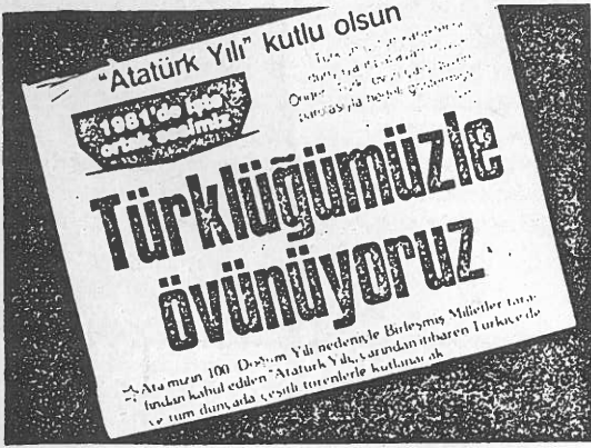
UŞAK BASININ TÜRK İRKÇİLİĞİ PROPAGANDASI...

5 Ocak 1981 den itibaren hakim sınıflar, "Atatürk Yılı" nı kutlamaya başlayacaklar. "Atatürk"ün doğumunun yüzüncü yılını hakim sınıflar büyük bir ideolojik saldırı aracı olarak kullanmak için uzun süredir hazırlıklar yapmakta idiler. Şimdi hazırlıklar bitti, hakim sınıflar uygulamaya başlıyorlar. Yurtiçi ve yurtdışında başlattıkları geniş bir kampanya ile hakim sınıflar "Atatürk"ün ne " büyük devlet adamı"; ne "büyük asker"; ne "büyük düşünür"; vs. olduğunu bir kere daha anlatacaklar.