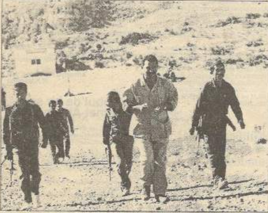
Yürüyüşünüz sizi halkı sindirmeye değil, faşizme karşı direnişe götürmelidir.