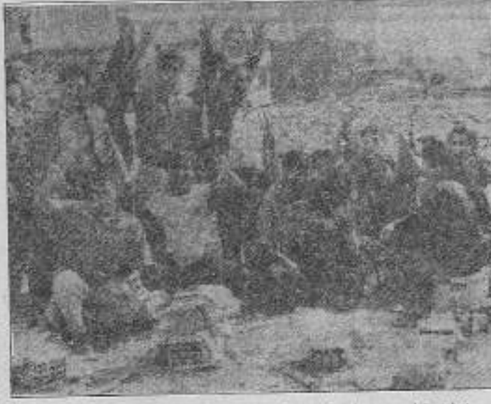
İşçiler, teslimiyetin mücadelesini yıkırtıya uğratacağını kavrayarak harekete geçiyorlar.

Yaptıkları toplantılarda arkadaşlarına sendikaların ne olduğunu anla-