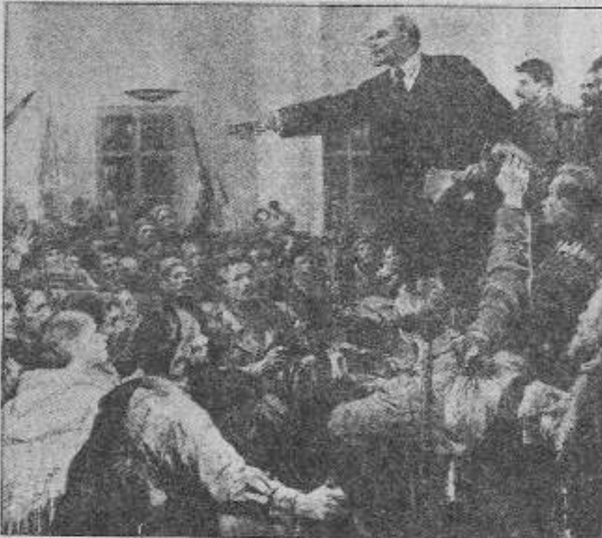
Lenin: Rusya penceresinden Enternasyonal proletaryanın iktidar yolunu açtı.

Afrika'da ve Balkanlarda yenilgilere sebep olduğu için Yüksek Faşist Kon-sey'ce 24 Temmuz 1943'te görevden alındı.