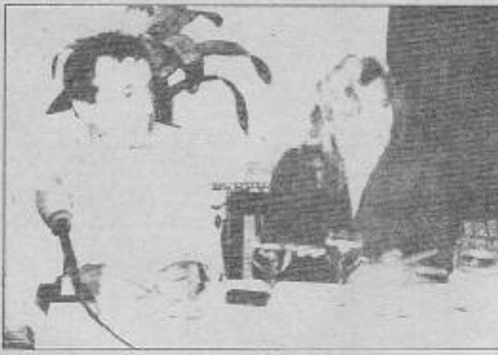
Costa Gavras: "Özgürlükleri için savaşımı veren kişilere her zaman sempatin olmuştur."