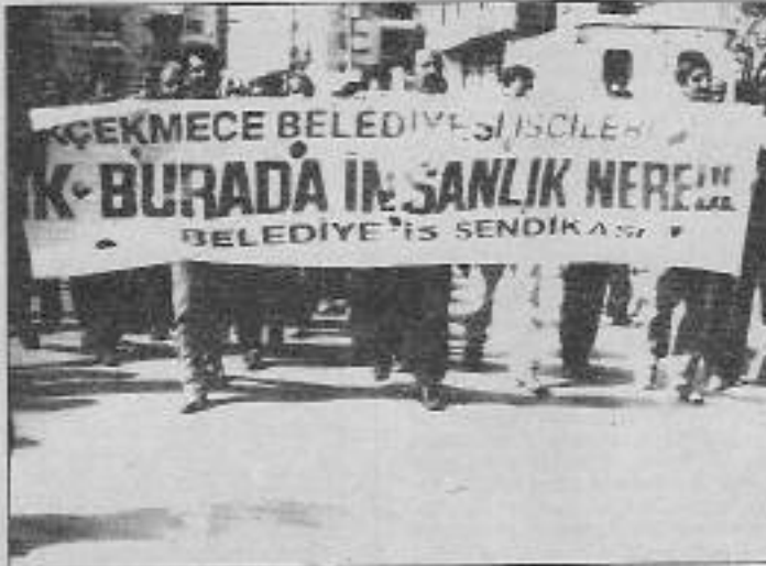
Yalana, dolara ve tüm sahtekarlıklara rağmen Küçükçekmece işçileri coşkulu yürüyüşüne devam ediyor.

Eylemin hazırlıkları yapılırken 30 Eylül tarihli Bugün gazetesinde şöyle bir haber çıktı: "Patron çöpçüler saltanatına son". Böyle bir