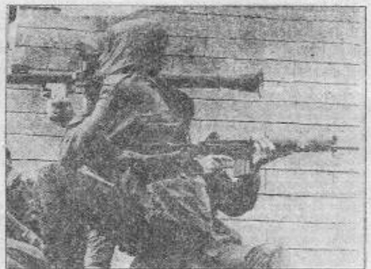
IRA'nın silahlanma pazarlık için konuşuyor.

Haber Merkezi- Kuzey İrlanda'nın bağımsızlığı için mücadele eden İrlanda Cumhuriyet Ordusu'nun (IRA) yasal kolu olarak tanınan Sinn Fein'in lideri Gerry Adams, "Cumhuriyetçiler olarak çözüme ulaşmak konusunda istekli ve hazırız. İngiliz hükümetinden istediğimiz, kendilerinin de bu şansı iyi değerlendirip olumlu bir girişimde bulunmalarıdır. Aksini yaparlarsa bu sonu olmayan çatışmaların sorumluluğuna taahhüs olurlar" dedi. Adams'ın, milliyetçi çizgideki Sosyal Demokrat İşçi Partisi (SDLP) lideri John Hume ile 5 aydır devam eden gizli görüşmeler yaptığı ve ikisinin beraberce bir öneriler paketi hazırladıkları ortaya çıktı. İngiliz ve İrlanda hükümetlerine sunulan sözkonusu paket IRA'nın ateşkes koşullarını içeriyordu.