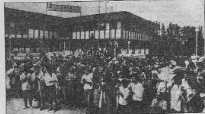
Birkaç ay önce direnen ve kazanan Sümerbank işçisi deneyimlerini unutmamalıdır.