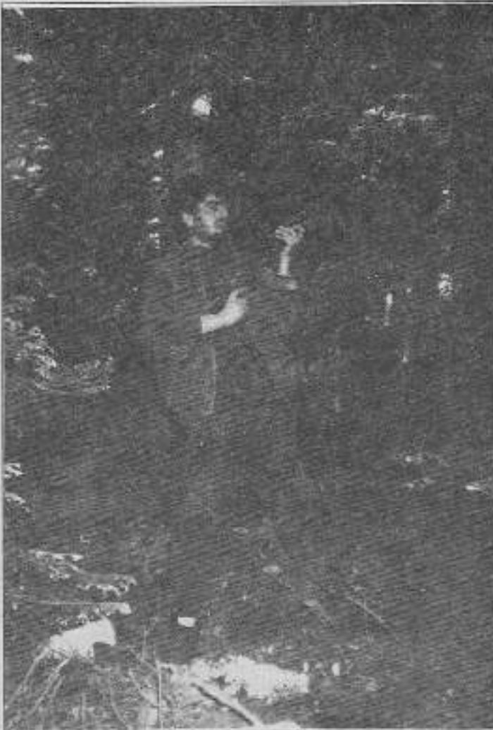
"... bir gerilla için eylem anındaki dikkatsizlik ve kafa karışıklığı ölümdür"

Bir ay sonra kaybolan klavuz yine aynı bölgede milis vasıtasıyla bulduğuna kavuşmuştur.