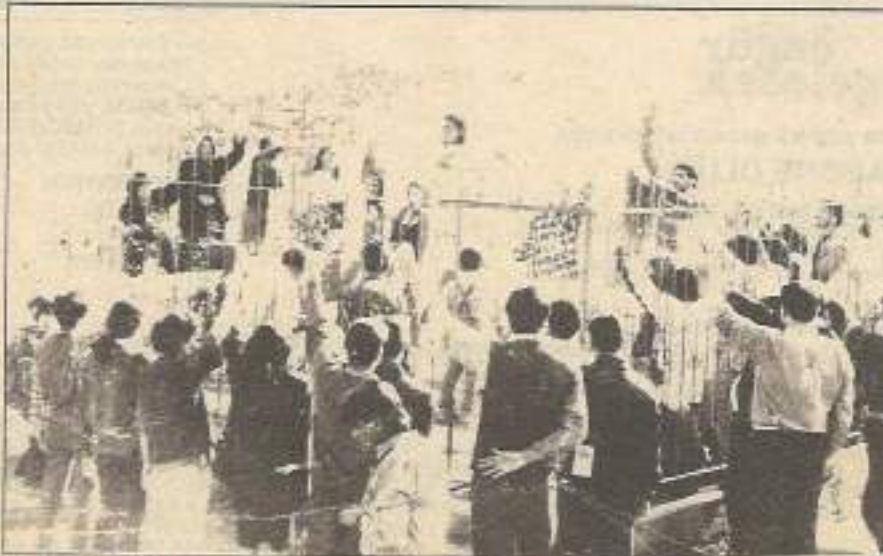
Beşinci yılında mezarı başında anılan Tuzla şehitlerinin hesabı sorulacaktır.