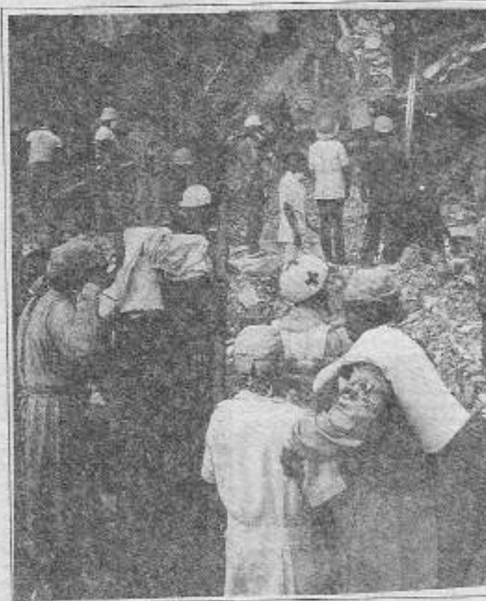
Halkların başındaki esas felaket deprem değil emperyalist sömürü sistemidir.

Clinton ise son zamanı denemektedir. Bugünlerde yoğun olarak binlerce ABD askerini daha Somali'ye göndererek Bush'tan sonra "2. Körfez Fatih"ni sıfatını almaya çalışıyor. Böylece daha rahat tulum yaparak dışarda ABD'nin diğer emperyalist rakiplerine karşı kozlar elde etmeyi ve içinde kendisinin oy potansiyelini sağlamlaştırmayı düşünüyor.