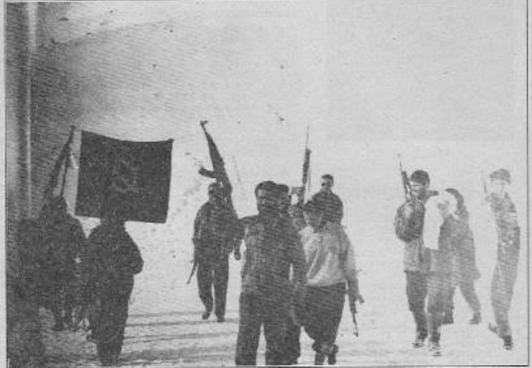
"Ölüncekte bir TIKKO'cu gibi ölünmeliydi. Korkaklık ve cesaretsizlik ölüme çare değildi."

Bu arada silah sesleri çaldı kulaklarıma. Emin olmak için yanbaşında yürüyen komutanı sordum, o da aynı sesi duyduğumu söyledi. Olabilecekler bir film serisi gibi sıralandı kafamda ve klavuzun düşman pususuna düştüğüne kanaat getirdim. Hepimizle de bakın olan buydu şimdi. Köye girmenin ne derecede doğru olup olmadığı konusunda fikir yürütüyordum. Ancak kesin karar veremiyordum. Birden komutanın kesin ve kararlı bir şekilde: "köye gireceğiz" dediğini duydum. Kararsızlığımı üstümden atamamıştım. Ancak komutanın köye ne şekilde, hangi taktikle gireceğimizi hakkındaki net ve kararlı açıklaması beni bocalamaktan kurtardı. Konuşlanmamız hakkındaki karara göre komutan yardımcılığı ve arıcılık görevimin yanısıra klavuzluğa da benim yapmam gerekiyordu. Bu duruma göre en önce ben gidecektim. Arkamdan komutan beni korumak için gelecekti ve diğer iki yoldaşı her hangi bir durum