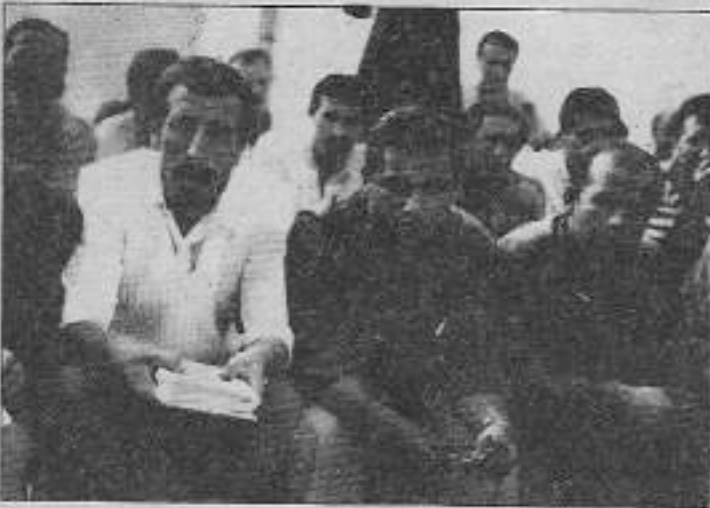
Porland direnişçileri işe geri alınmaya kadar mücadeleyi sürdüreceklerini söylüyorlar.

Sağlığı süratle bozulan işçilerin pek çoğu bu koşulları değiştirmek istemiyor. Karşı çıkarsam işten atılırım diye korkuyordu. Ancak iki işçinin atılmasıyla kabanar öfkeleri ile başlayan direniş onlara güçlerini gösterdi.