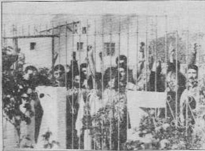
4 Karantlı'nın katili, er ya da geç hakkın adaletine hesap verecektir.