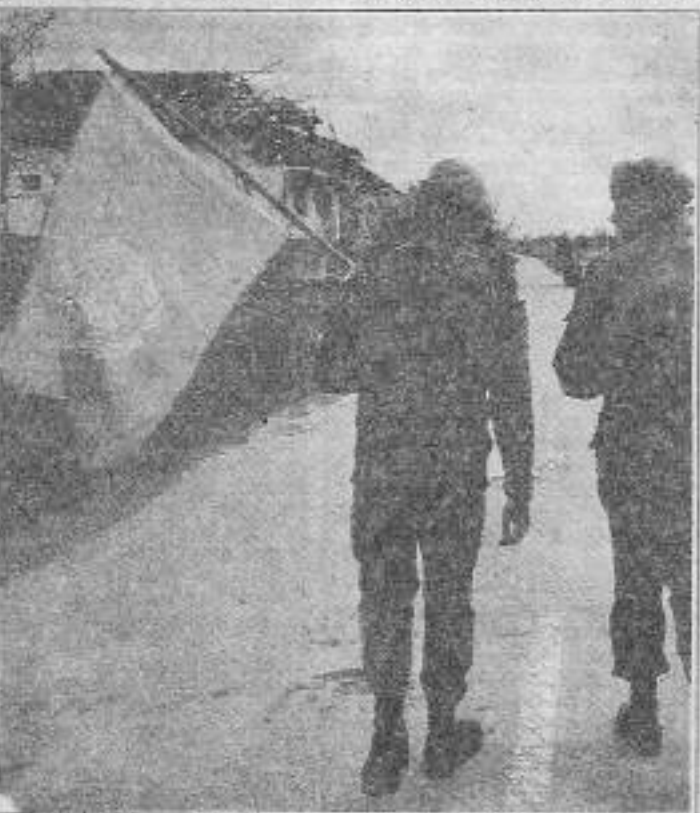
BM'nin "Barış Melekleri" fuhuşun, karaborsanın soygununun ve uşaklığın bayrağını taşıyor.

IRA, İngiltere hükümetine gönderdiği öneri paketinde İrlanda halkının kendi kaderini tayin hakkını istiyor. Halkın kendi kaderini tayin hakkı istenmez, alınır. Çünkü bu hak, çağımızın özelliği gereği bir proletar devrimin yarpına hakkı demektir. IRA ulusal temelinde yükselmekte, halk arasındaki Katolik-Protestan çelişkilerine yanlış yaklaşmakta ve emperyalist İngiltere hükümetiyle uzlaşmaya çalışmaktadır. Parlasyan bombalar ise silah pazarlığın göstergesidir.