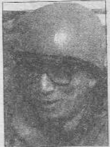
Buras Gali kınığına uygun kıyafetlere sahnedir.

bir değişiklik yok. Kendisi, 1 yıl önce Somali'de açlıktan 300.000 kişinin öldüğünü ve bugün tek bir kişiyi bile aç öldürdüğü sık sık ve büyük bir utanmazlıkla vurguluyor. Gali iki nedenden ötürü yalancıdır. Birincisi, Somali halkını açlıktan ölüme mahkum eden bizzat Gali'nin emperyalist efendileridir. İkincisi Somali halkının büyük çoğunluğu hâlâ açtır. Belki açlıktan ölenlerin azaldığı doğrudur ama halkın hedef gözetilmesiz rakoketlerle topla olarak imha edildiği de doğrudur. Gali, Aaidid yanlılarıyla görüşüp onu safdışı etmekten yana ve bu işi ülkede bulunan 4.500 ABD askerini Kongre çekmeden önce bitirmek istiyor.