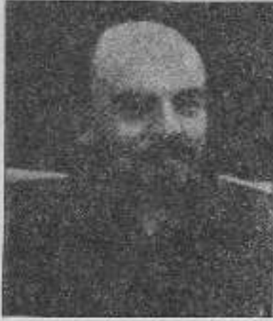
V. I. LENİN