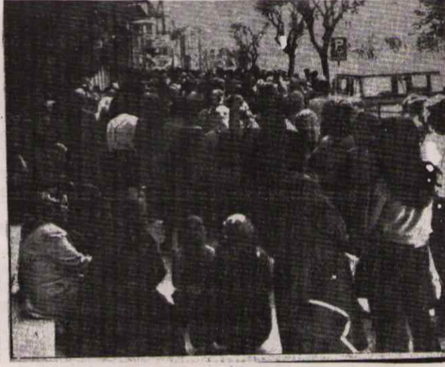
Kadınlar, çocuklar sabah erkenden kalkıp kömür kuyruğuna giriyor.

PATRON-AGA DEVLETİNİN SÖMÜRÜ VE ZULMÜNE KARŞI İŞÇİ SINIFIMIZIN MÜCADELESİ GELİŞMEKTEDİR.