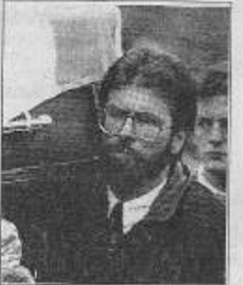
Ölen IRA militanının tabutunu taşıyan Sinn Féin lideri Gerry Adams.

Bu açıklamadan hemen sonra, IRA, saldırıyı "kotü hazırlanmış bir operasyon" olarak değerlendiyor. Bir bildiri yayımlayarak, "Masum insanların ölümünden büyük üzüntü duyuyor ve yakınlarının acılarını anlıyoruz. Bizim hedefimiz Protestan terör örgütü Kuzey İrlanda Özgürlük Savaşçıları üyeleriydi," diyor. Tabii, kamuoyunda