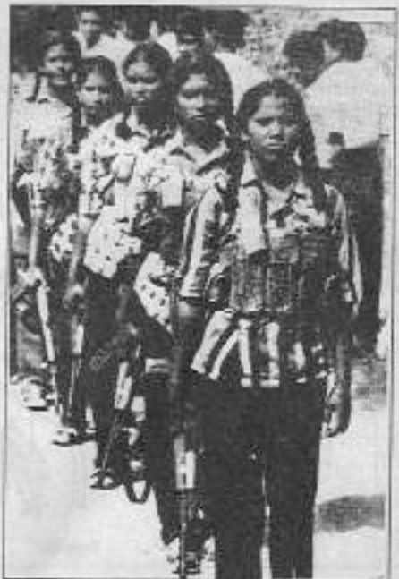
Genç kadınlardan oluşan bir Tamil İnhar timi.

koka üretimi gibi). Seylan, iki ana ulusun yaşadığı bir ülkedir: Egemen ulus Sinhaller (nüfusun dörtte üçü) ve ezilen ulus Tamil (nüfusun beşte biri). Tamil Kaplanları, ulusal bağımsızlık için savaşıyor ve ülkenin kuzeyinde oldukça etkin.