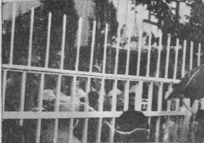
İşçilerin ortak mücadelesini demir parmaklıklar ayırmaya yetmiyor.

İşverenin şikayetçi olduğu 16 kişiyi işçiler kenetlenerek polise veremeyince, işveren polise giderek bir yanlış anlaşılma olduğunu ve şikayetçi olmadığını anlatıyor. Polisler