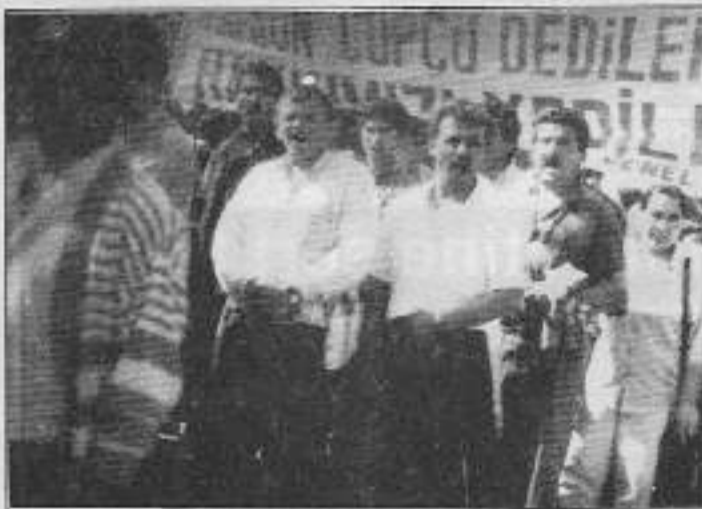
İşçiler haklarını kopata kopata alıyorlar.

İşçiler gerginliğin bir gün önceden başladığını anlatıyorlar. "Perşembe akşamı işveren taşeron müteahhit getirdi. Zabıta vasıtasıyla halka anons yapıldı. "Araçlarımızı çekin, çöp toplanacak. Belediye işçileri buna engelleyebilirler. Müdahale edin" denildi. Anons arabalarına temizlik işçileri ile işçi komiteleri müdahale ederek, anonsu engellediler. Bunun üzerine arabalarını geri çeken zabıtalara anonsa devam edemediler." İşçiler o gece taşeronun çöpleri toplayacağını anlamışlardı. Geç saatlere kadar bekledi işyerlerinde. Polis güzetiminde taşeron firma çöpleri toplamaya başlayınca işçiler müdahale ettiler. Polis 16 kişiyi gözaltına alırken, müteahhit geri çekildi. Bir iki araba çöp alabilmişlerdi bu sırada. İşçiler bir iki saat sonra bırakıldı. Ertesi gün, yani 5 Kasım günü belediye önüne işçiler toplanmaya başladı. Bu arada taşeron firmasının işçileri ve kamyonları da belediyenin önüne geldiler. İşçiler kamyon şoförleriyle konuşarak eylem kinciği yapmalarını ve gitmelerini istemelerine rağmen, taşeron işçileri ve şoförleri toplandı. Belediye işçileri taşeron işçilerle tartış