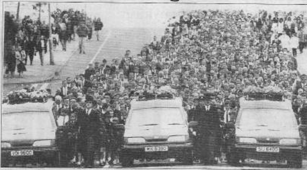
Özellikle çocukların öldürülmesi İngiliz egemen sınıflar tarafından iyi kullanıldı.

inibarı kalmamış ve halk arasında "işçi cellacı" olarak anılan İngiltere Başbakanı John Major, zaman kaybetmeden açıklamalar yapıyor. Commonwealth toplantısı için gittiği Güney Kıbrıs'tan çıktıklar diyor: "Hunhar bir eylem. Bu kanlı bunalıma siyasi çözüm bulmak zorunlu." Oysa IRA da "siyasi çözüm" arıyor ve İngiliz egemenleri ancak böylece saldırılarda bu kavramı kullanıyor.