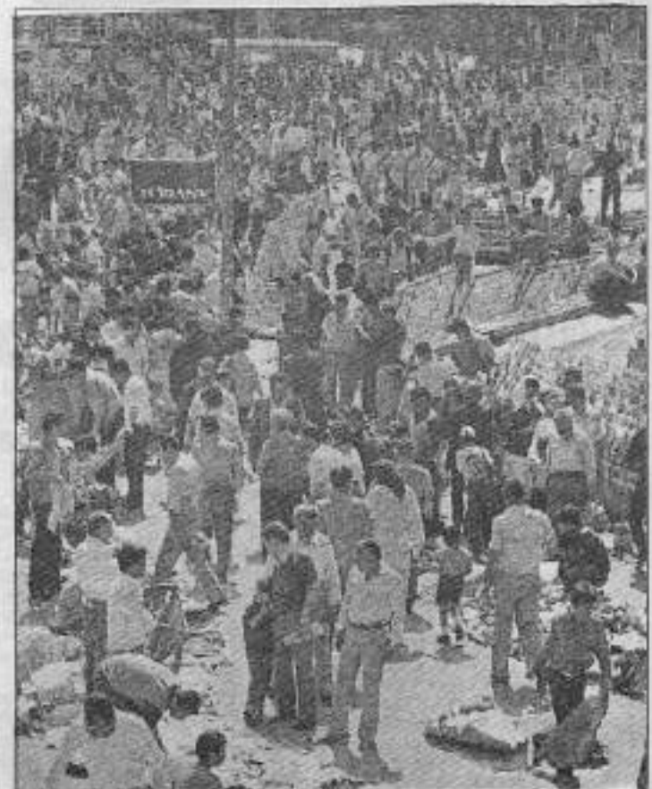
İnsan okyanusuna daldı, dağlara varmak için...

*Rabarba: Tiyatroda kulislere denir ya da sahne girişinden birçok sevin ayını anda anlayılmaz bir şekilde gürültü çıkarması