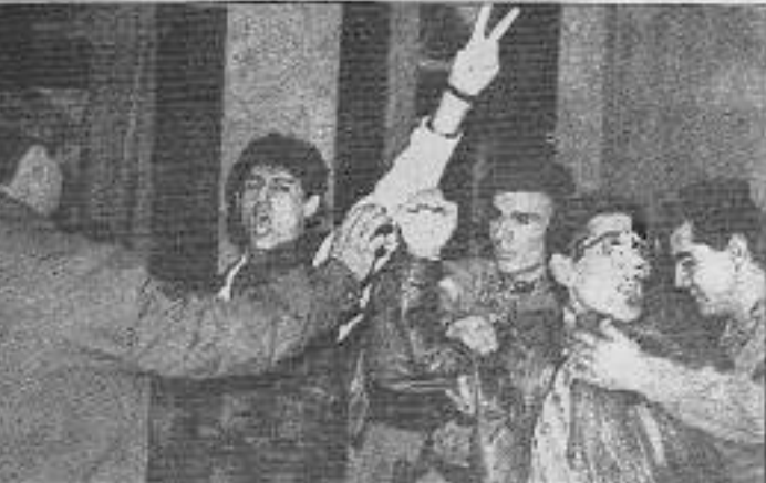
Faşizm, Özgürlük Mahkumlarını zapt etmiyor.

Hakimler idam kararını okurken kalemlerini kırdılar. Kıran kalemlerin parçalarını verden alan özgürlük mahkumları, bunları mahkeme heyetinin suratına fırlatarak "İdamlar ve cezalar hizi yildiramaz!", "Yaşasın TIKKO kahrolsun faşizm" sloganlarını attılar.