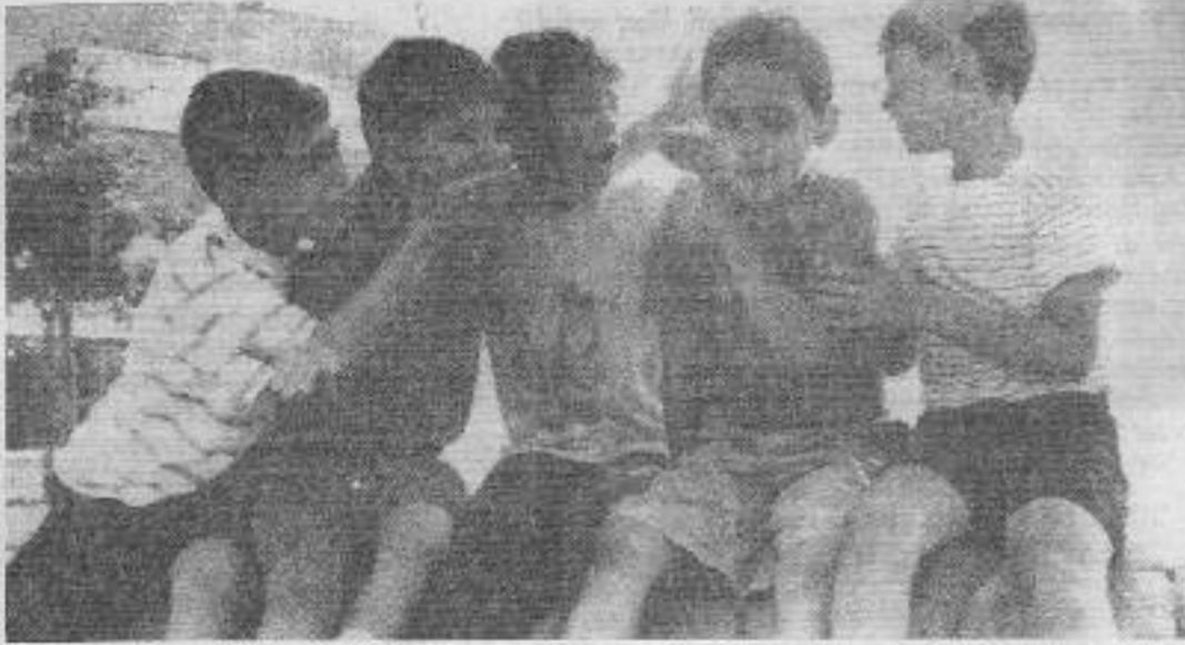
Faşizmin kendilerine bıraktığı mirası reddedecek ve güzel günlerin mimarı olacak bu çocuklar.

Annesi ve babası vedalaşırken, "oğul gitme" demekle "oğul git" deme ikirciliğiyle sarılmışlardı ona. Annesi öperken sanki "yüzümüzü kara çıkarma" der gibiydi.