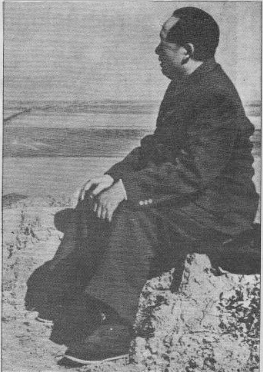
ML'ye yaptığı katkılarıyla bugün enternasyonal proletaryanın eînde bir meşredir Mao.