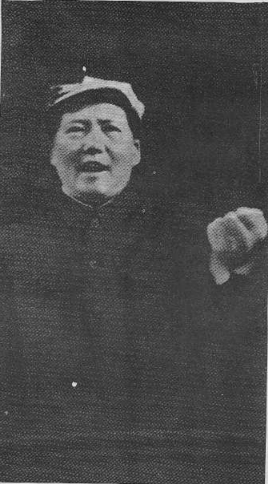
Parti içinde durmadan farklı türden fikirler olacak ve mücadele devam edecektir.

Diğer bir nedeni ise özgüldür. Ülke çapında komünist partisinin attığı her zafer adımı, parti içindeki "sol" eğilim veya sapmaları güçlendirip çizgi haline dönüştüreceği gibi, tersi durumda, yani komünist partisinin aldığı