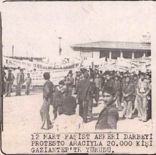
12 MART FAŞİST ASKERİ DARBEYİ PROTESTO AMACIYLA 20.000 KİŞİ GAZİANTEP'TE YÜRÜDÜ.

12 Mart öncesi dönemde hakim sınıfların iktidarda olan Amerikancı kanadı (AP) örtülü faşist bir diktatörlük uygulamaktaydı. Fakat halkımızın gelişen mücadelesini önleyemiyen hakim sınıflar adım adım açık bir faşist diktatörlük uyguluyarak halkın mücadelesini önlemek, ekonomik ve siyasi istikrarı sağlamak istiyorlardı. İşte 12 Mart askeri faşist darbesi ve sıkıyönetim bu durumun bir sonucudur. Faşistler 12 martla birlikte maskelerini yırtıp attılar. Malkımıza azgınca saldırdılar. Tam 2,5 sene süren koyu bir terör estirdiler. Halkımızın hayatını cehenneme çevirdiler. Hakim sınıfların caza kurumlarında bütün cumhuriyet tarihi boyunca örtülü veya açık faşizmin "kanun dinlemiyen" kanunlarını halkımızı cezalandırmak için kullandıklarıdır. Yani örtülü faşizmin "bağımsız mahkemeleri" açık faşizmin "sıkıyönetim mahkemelerinden" ve sıkıyönetim mahkemelerinin bir devamı olan DGM lerinden özünde hiçte farklı değildir. Bütün bu mahkemeler hakim sınıfların halkımızın bağımsızlık ve demokrasi mücadelesini bastırmak için kullandıkları devlet mekanizmasının bir parçasıdır. Bu mahkemeler hakim sınıfların halka karşı kullandıkları ceza kurumlarıdır.