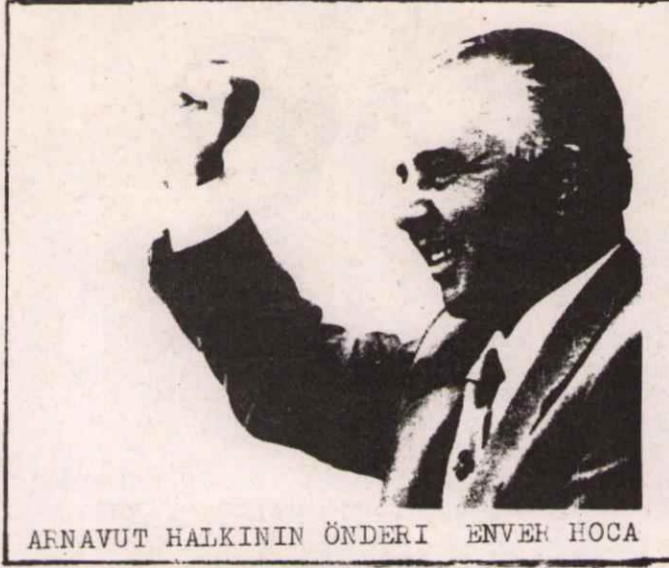
ARNAVUT HALKININ ÖNDERİ ENVER HOCA

Arnavutluk Merkez Komitesi nisan ayı içinde yayınladığı bir genelgede devletin yüksek kademelerinde görevli memurların ücretlerinde bir indirim yapıldığını, ücret sisteminin emekçi halk yararına değiştirildiğini ve şehirle köy arasındaki farkın giderilmesi için daha aktif bir çalışma içine girildiğini belirtti. Partinin önderliği altında işçiler ve köylülerden oluşan Komiteler ise