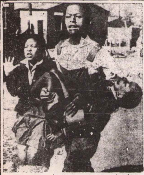
IRKÇI FAŞİSTLER ÇOCUKLARI BİLE KATLEDİYORLAR