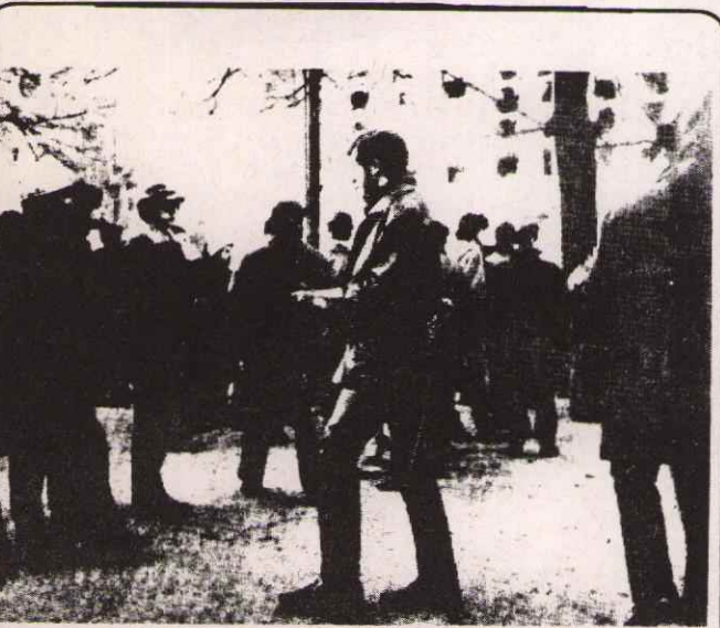
NERDE ZÜLUM VE SÖMÜRÜ VARSA ORDA MUTLAKA MÜCADELE VARDIR. BU MÜCADELEDE ZAFER EZİLENLERİN OLACAKTIR.

Polonya işçi sınıfının mücadelesi her geçen gün yükselmekte ve komünist partisinin önderliğinde "Burjuva diktatörlüğünü yıkıp, Proleterya diktatörlüğünü kurmak için diğer adamlarla ilerlemektedir.