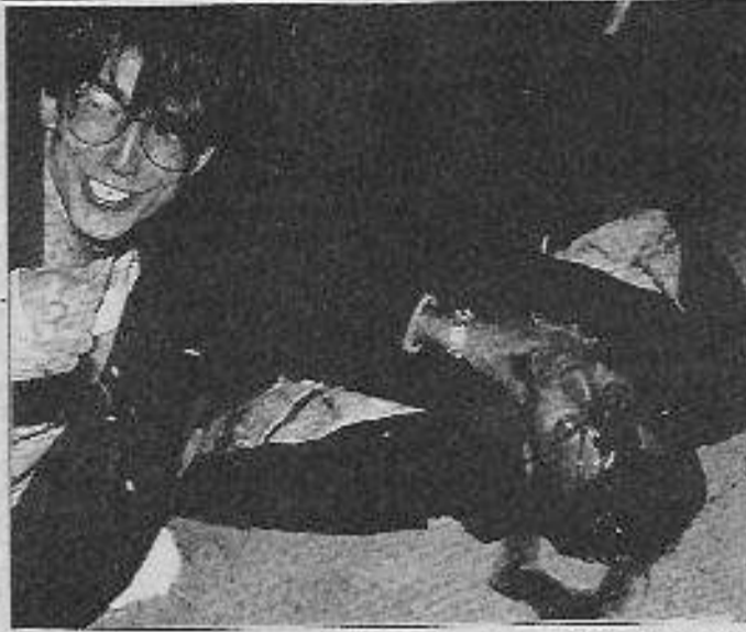
Gazi Katliamında ölümlerle kucaklaşan insanların psikolojik durumu