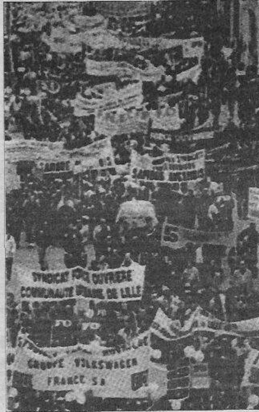
Fransa, işçi ve öğrenci eylemleriyle sarsıldı.

E mperyalist efendilerine hizmet eden burjuva toplumbilimciler ve aydınlar varsın dünya halklarına YDD'nin propagandasını yapadursunlar. Varsın sınıf savaşmalarının bittiğini söylesinler. Ve hatta varsın “vahşi kapitalizm evcilleşti” diyerek, “evcilleşen” bu kapitalizme post-kapitalizm, post-modernizm diye adlar bulsunlar... Avrupa'yı sarsan olaylar, Rusya'daki seçimler, ABD'deki bütçe krizi, dünya halklarına çok şeyler anlatıyor. Proletaryanın gücünü ve gücündeki erdemi anlatıyor. Yerküremizin dört bir yanında süren ulusal ve sosyal kurtuluş mücadelelerinin emperyalizmi nasıl krize boğduğunu anlatıyor. Kapitalizmin vahşiliğini, post-kapitalizm hırkasında gizleyemediğini ve onun insan kaniyla beslenen vahşi bir yaratık olduğunu anlatıyor. İşte bu yüzden dünyanın her tarafında halklar ayaklanıyor.