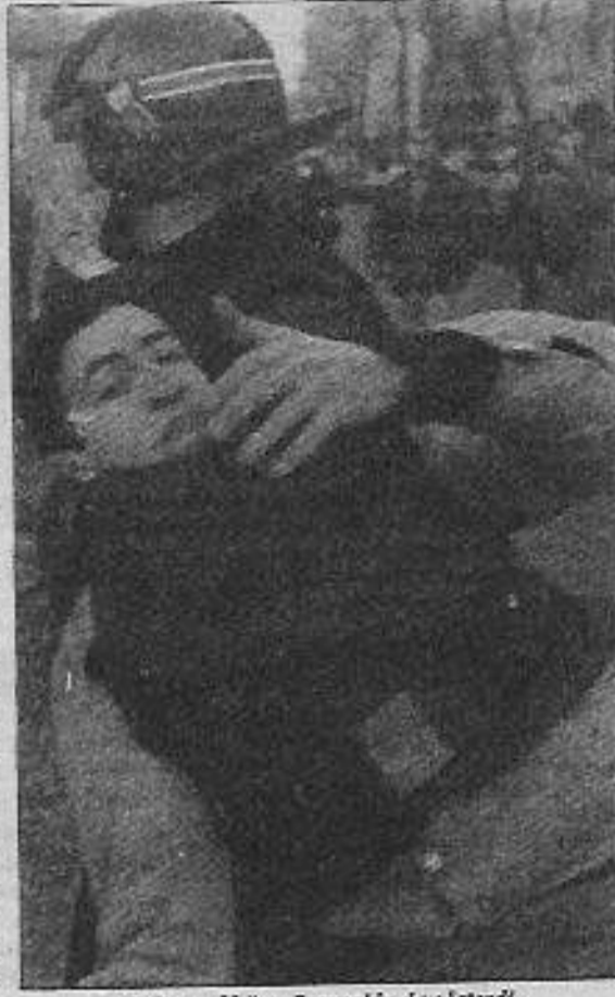
Polis şaşkınlığını Fransa'da da gösterdi.

"Avrupa'da yeni bir heyula kol geziyor," bu belki şimdi değil, ama yarın mutlaka... Aynı zamanda sömürge, yarı sömürge halklarının sosyal ve ulusal kurtuluş mücadeleleri sadece kendilerinin kurtuluşunu değil, emperyalist-kapitalist ülke halklarının ayaklanma zeminini de beraberinde yaratıyor.