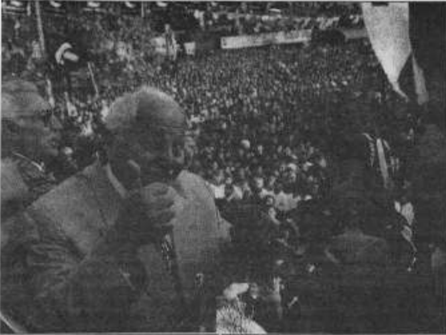
Soyunlarla halkı aldatmaya çalışan düzen partileri seçimlerden umduklarını bulamadılar

Komünistler ve devrimciler saevut tabloyu değerlendirirken bu soruna da kafa yormak zorunladılar. Çünkü seçimleri şu veya bu nedenle boykot eden yüzde 30'luk kitleyi devrim cephesi içinde örgütlemek için, komünistler ve devrimciler kendi yollarını net bir biçimde belirlemek sorunuyla karşı karşıya kalmışlardır. Yani faşist devletin önünde duran sosyal sorunların çözümlerinde, kendi MLM politikalarını ve çözüm önerilerini kitlelere mal etmek sorumluluğunu taşımabildiler. Bu ancak, silahlı gerici güçlere karşı, silahlı devrim mücadelesini bir ve çehir diyalektikliği içinde yaşamın her alanında hayata geçirmekle mümkün olacaktır ■