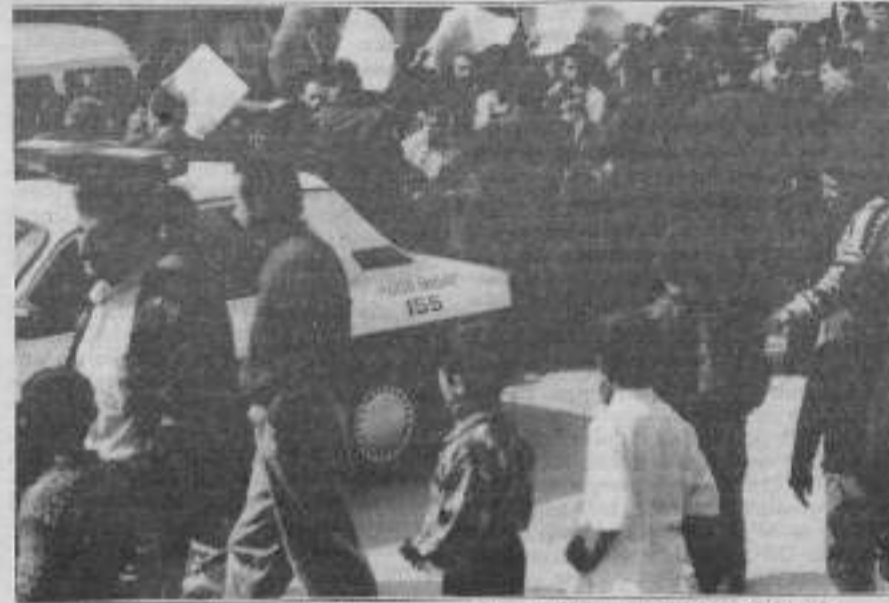
Aylardır, onurları, emekleri için direnen ambar işçileri mücadeleyi öğreniyorlar.