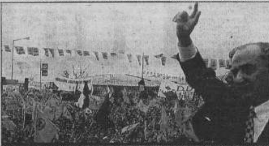
Kürt sorununun siyasi yollarla çözülmesi gerektiğini söyleyen HADEP, "Türkiye barajına" tabanlı.

ına rağmen meclise giremedi. Kürt illerinde yer yer yüzde 70'lere varan oyuyla meclis dışında bırakılan HADEP, önümüzdeki kriz sürecinde yeni sorunlar yaratacağının sinyallerini veriyor. Alınan oy yüzdeleri ile meclise girenlerin ve girmeyenlerin, seçimlerden sonra gündeme getirilecek "seçimler adaletsiz ve ulusal baraj sistemi antidemokratik"tir söylemleri, bu durumu ortadan kaldırmıyor. Bunun yanında seçmenin yüzde 30'u sandık başına gitmedi. Bu oran hiçte küçümsemeyecek bir orandır. Bu sayı boykotçuları