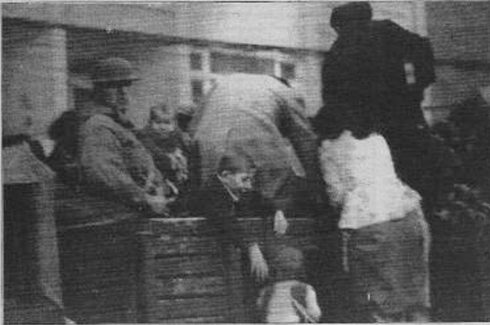
Maras katliamından sonra göç etmek zorunda bırakılan bir grup insan

Haber Merkezi: İstanbul Teknik Üniversitesi öğrencileri, Maslak Kampüsü'nde düzenledikleri bir forumla, Maras katliamını kınadılar.