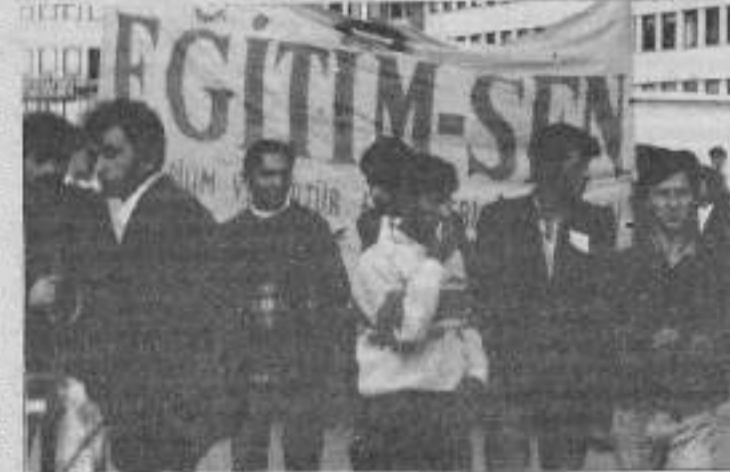
Soruşturma, görevden alma ve sürgün politikalarından sonra Eğitim-Sen'de kapatılmak isteniyor.