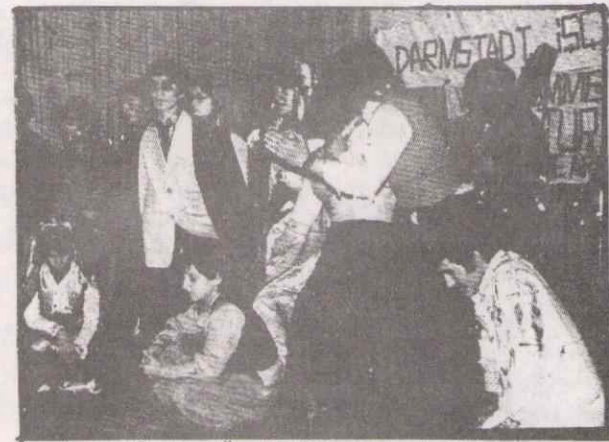
"İrgatların Öfkesi" adlı bir oyundan bir görüntüm

Geceye katılan "Gaziantep" "Elazığ" folklor ekibi gerek kıyafetleri gerekse oyunlarıyla büyük ilgi görmüştür.