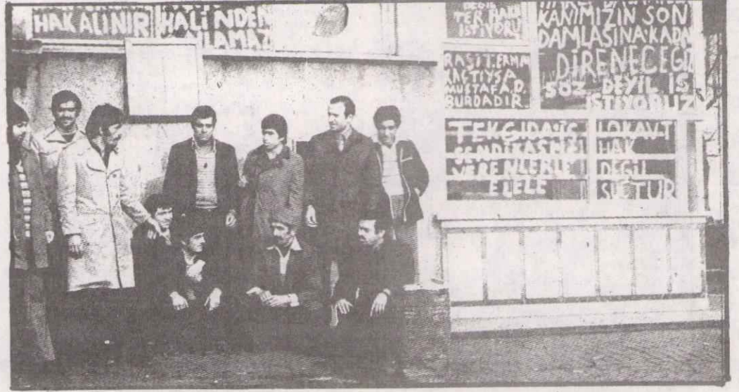
LEVENT EKMEK FABRİKASI GREVİNE KATILANLAR!

Levent Ekmek fabrikasında işverenin motörleri söküp işyerini terk etmeleri üzerine 23 işçi uzun zamandan beri sürdürdükleri grevden sonra babadan kalma usulle ekmek pişirerek fabrikayı çalıştırmaya başlamışlardır. Mücadeleden yılmayan 23 işçi "günde 15 saat çalıştırıldıklarını ve hiçbir sosyal haklarının ödenmediği" Levent Ekmek fabrikasında şimdi "İnsanlık dışı çalışmaya paydos diyerek canla başla çalıştıklarını belirtmişlerdir.