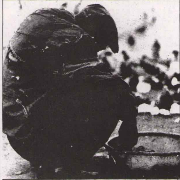
İŞ ARAYAN AÇLAR, YABAN ELE GÜÇLER ALINACAK ÜCLER BİZİM!

"Türk kadını fahişe olmaz" genellemesinde gerçeklere uymamaktadır. Türk kadını fahişe olmaz diye gürültü koparan bütün yaygaracılar bunu kendi somut pratikleriyle bilirler. Mesele milliyet meselesi değildir. Hiçbir milliyetten, hiçbir insan anasının karnından fahişe doğmaz. Hiçbir insan vücüdünü isteyerek satmaz. İnsanları vücüdünü satmak zorunda bırakan, insanları mal olarak gören içinde yaşadığımız düzendir. Bu düzen insanlar arasın-