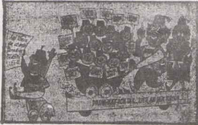
FAŞİNG'TE KULLANILAN YABANCI İŞÇİ DOŞMANI PROPAGANDA!

Alman patronları eğer bizi ülke- mize göndermek istiyorsa hakkımız olan işsizlik parasının, sigorta prim- lerinin tümünü bize ödemelidir. Bu bizim hakkımızdır. Tek doğru talep bu- dur