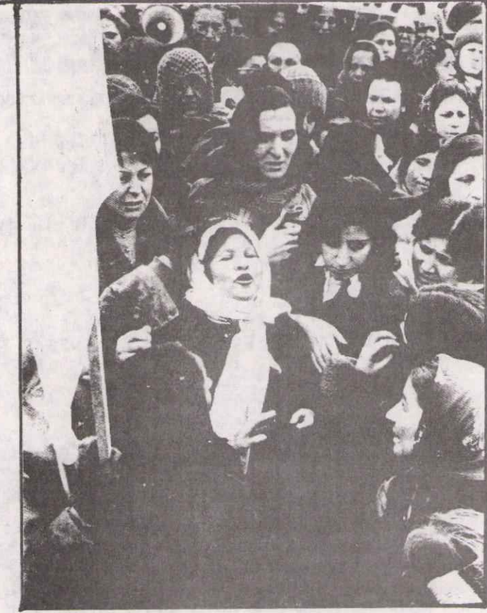
EVLAT ACISINA SON MITINGI!

Çocuklarımıza dayak atılıyor. Elektrik işkencesi yapılıyor olağanüstü mahkemelerde, olağanüstü hukukla yargılıyor ve öldürüyorlar. Faşizm musibeti başımızdadır.