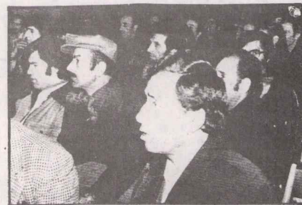
Geceye katılanlardan bir grup