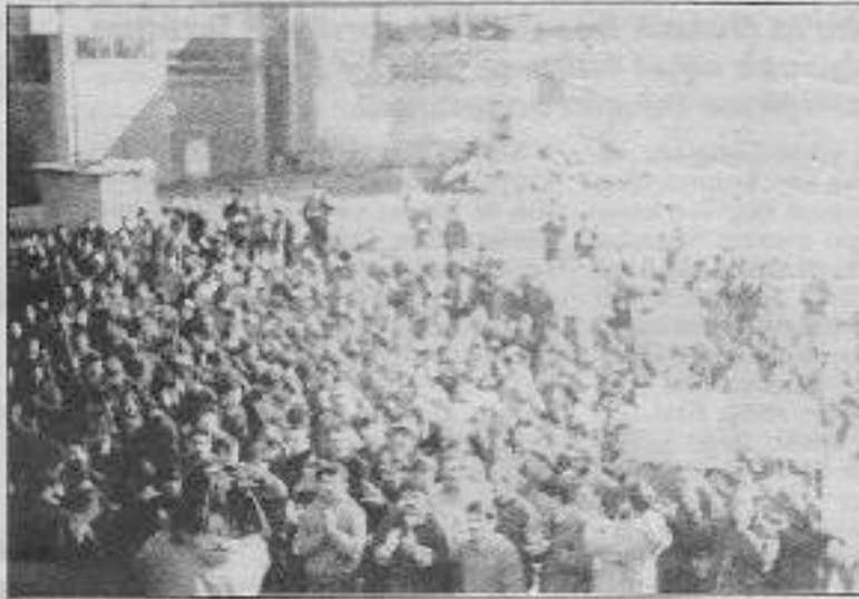
Deri işçileri kamu emekçilerine 2 saatlik iş bırakma eylemleriyle destek verdiler.

Partizan Sesi/Kartal: Kamu emekçilerinin Türkiye genelinde gerçekleştirdikleri bir günlük iş bırakma eylemi ne, Tuzla deri işçileri de iki saatlik iş bırakma eyleminde bulunarak, destek verdiler. 20 Aralık 1994 Salı günü, kamu emekçilerinin Türkiye genelinde gerçekleştirecekleri bir günlük iş bırakma eylemini desteklemek ve işçi kıyımını protesto etmek için, Cihangir Deri Fabrikası önünde toplanan deri işçileri 2 saatlik iş bırakma eyleminde bulundular. Deri-İş Sendikası Tuzla Şubesi tarafından gerçekleştirilen eyleme, 1000'ün üzerinde deri işçisi katıldı. Saat 12.00'de yapılan