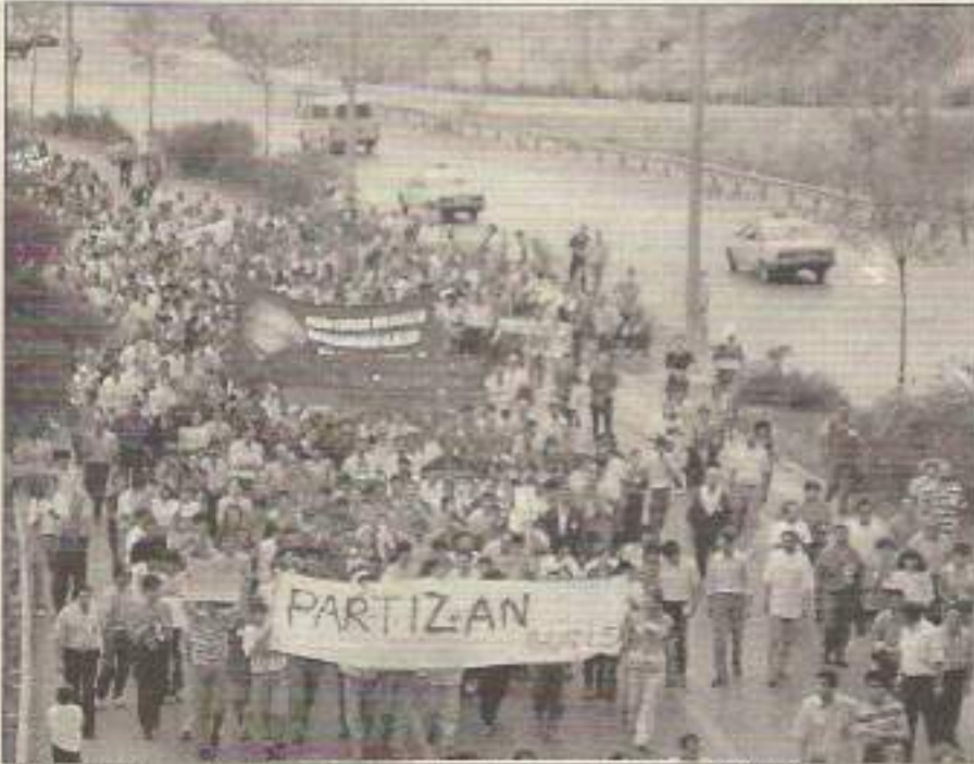
Yüzbinlerin ayak sesleri egemenleri korku ve paniğe sürüklüyor.