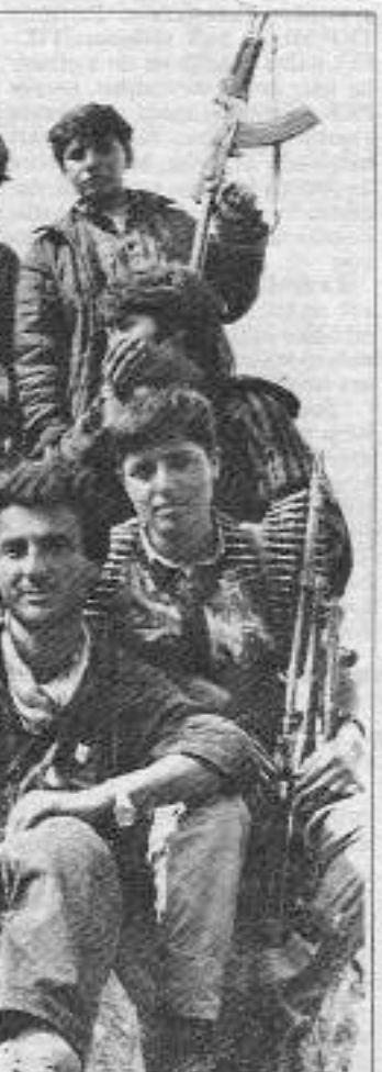
Konferansın güvenliği için kanat geran TIKKO birliğinden bir grup gerilla

rağın başına gölgelik olarak kullanan kadın gerilla, bir süre sonra kucak dolusu İşkin la yoldaşlarının konaklama yerine vandiklarında gerilay sevinişi nöbetine tutulmuş bulursunuz... Sonra bir güzel sohbet başlar; ateşli siyasal tartışmalara ön hazırlık gibidir.