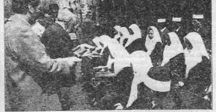
Herşeye kadarcı mantıkla bakan, din afyonuyla uyuşturulan "peki efendim"ci kişilikler yetiştiriliyor.

Bugün Milli Gençlik Vakfı'nda gençlere "öteki dünya" korkusu verilerek boyun yıkantıyor. Mevcut düzenin yolsuzluğu ve dejenerasyonunda kendilerinin payı yokmuş gibi çelişkiler işlenerek "adil düzen" adı altında şundukları şeriat