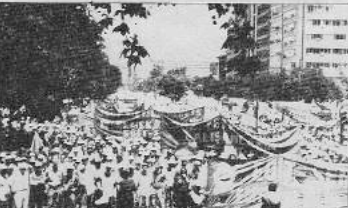
3 Temmuz'da Kamu çalışanları Ankara kapılarında yurdular.

1 Temmuz'da Başbakanlık görüşmek için yola çıkan, 400 bin