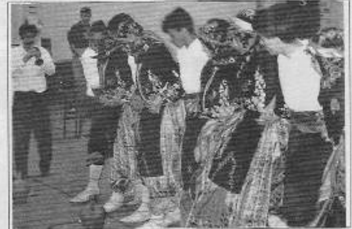
Çocuk folkloru Kurultaya renk kattı