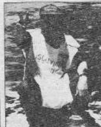
"Bundan böyle tüm dikkatimizi Ankara'ya yönelttik"