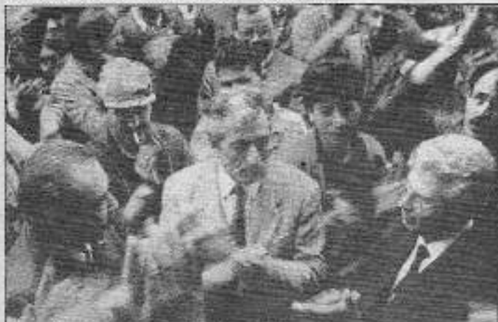
Bursa Soğanlıköy ziyaretlerle moral kazanıyor

Tuzla'da sözleşme imzalandıktan bir gün sonra bir iş kazası yaşandı. İşçiler bu olaya tepki gösterdiler İşverenler Sendikası Demireği'nde çalışan iki işçi, deri atıklarının atıldığı kanalı temizleme işlemini yaptıkları sırada kanala düşerek boğuldular. Bu olayı işverenler sendikası bir gün sonra öğrendi. Kendi işçilerinin ölümünün haberleri bile olmayan duyarsız patronlara karşı yapılan gösteride, "İşçilerin katili patron-ağa devleti" sloganları atıldı.