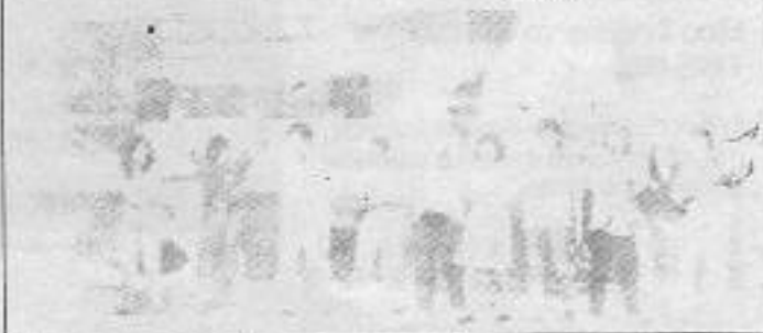
Kurultayın coşkusu halaylarla sürdü

SOMURULAN KADIN SOMURULAN ERKEK KOLELİĞE BAS KALDIR EKB