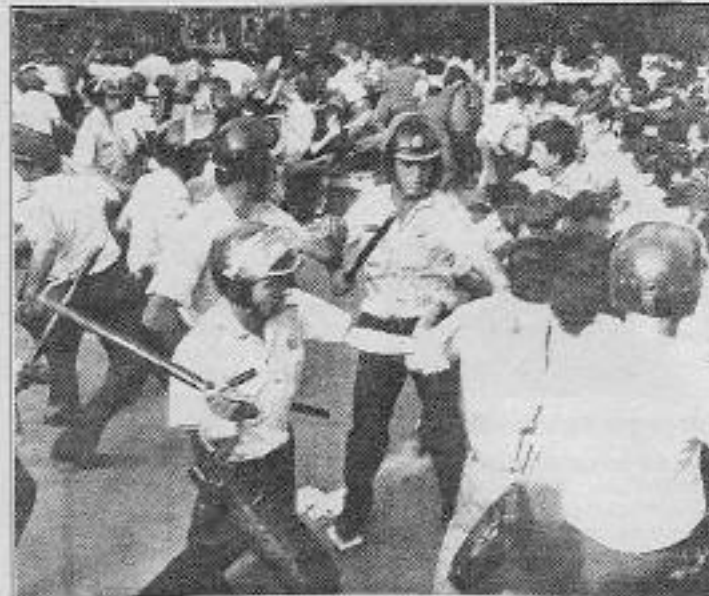
Sultanahmet'te polis kamu çalışanlarına joplarla acımasızca saldırdı.

10 Temmuz günü Sivas katliamını protesto etmek için yine Gazi mahallesinde 200'e yakın bir grup "Sivas ve Kürdistan katliamına karşı Türkiye Ayağa Kalk!" pankartı açarak yürüdü. "Sivas'ın hesabı sorulacak", "Yaşamın halkların Kardeşliği", "Dün Maras'ta Bugün Sivas'ta, Çözüm: Faşizme Karşı Savaşta" sloganları atarak yürüyen gruba polis 150 metre yürüdüktan sonra müdahale ederek yürüyüşe izin vermedi. Dağılan gruba polis müdahale etmediği bildirildi.