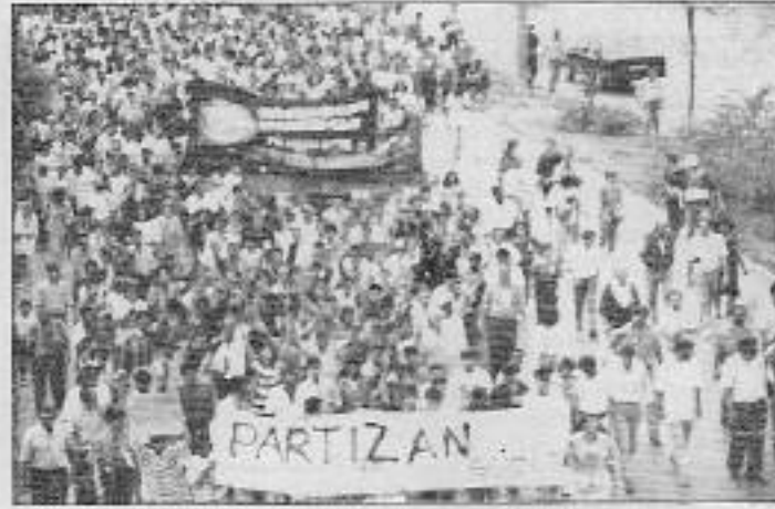
Partizan Güçler Sivas'ın kabil patron-ağa devlet" sloganını haykırıyorlardı

O gün Okmeydanı'nda bütün kenpekler imiş. Yürüyüş güzerga-