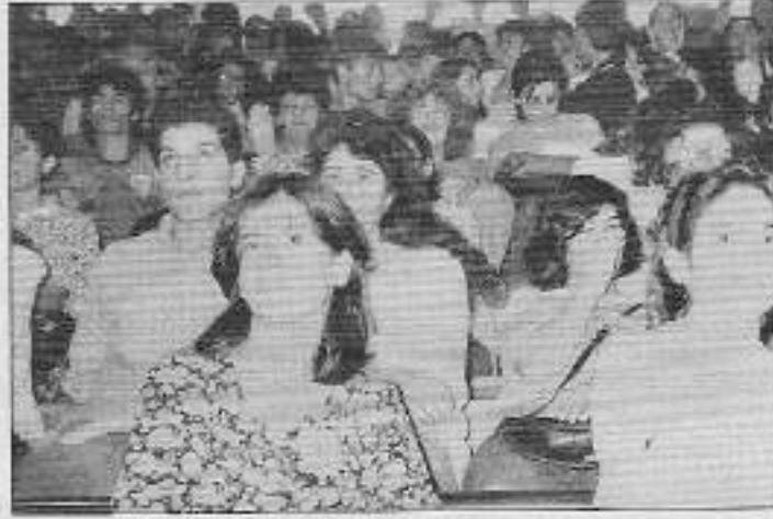
Kurultaya olan katılım ve ilgi, onun önemi ve aciliyetinin göstergesiydi.

Bu çalışmanın ortak bir örgütlenmeye taşınması noktasında çeşitli bölgelerin ve kesimlerin verdikleri kurultaya katılanlar ve kurultay girişimcilerince kabul gördü. Bu önerilerden bazıları yanlış bir anlayışla bağımsız kadın örgütlenmesinden söz ederken bir kısmı birleşik demokratik kadın örgütlenmesinin yaratılmasını talep etmekteydi. Kurultay 2 gün boyunca yaklaşık 2000 kişinin katılımıyla coşkuyla sürdürüldü.