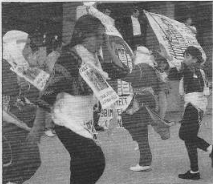
Alternatif Konferansta Çocuk folklorü coşkuyu daha da artırdı

Mahkeme salonunda, özel olarak hazırlanmış demir kafesler içinde yargılandılar. Her birine 4'er yıl hapis ve 4'er yıl gözetim altında tutulma cezası verildi. Devrimci tutsaklar mahkeme kararına karşılık olarak "verilen cezaların hiçbir geçerliliğini olmadığını, esas cezayı halkın vereceğini" söylediler. Tutsaklar mahkeme kararını, "Yaşasın Partimiz TKP/ML" sloganını haykırarak yanıtladılar.