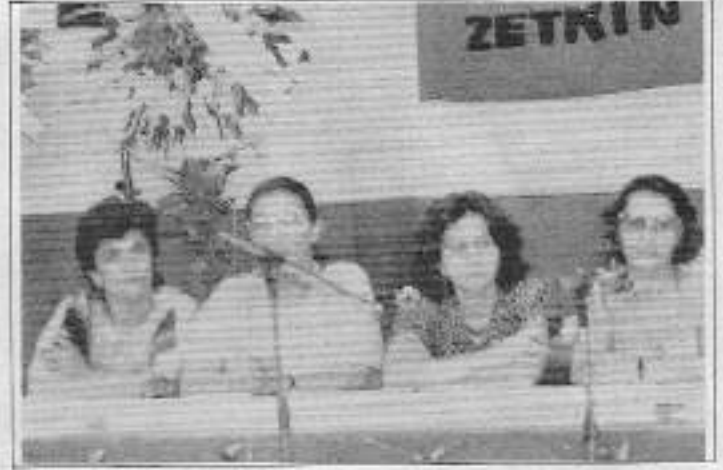
Kurultayı yöneten divan üyeleri

EKK girişim komitesinin hazırladığı tebliğ de okunamadı.