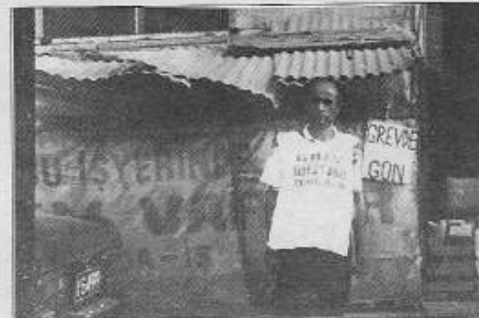
Görgülü Pastanesi işçileri inatla grev yorindeler

Görgülü'nün işverene dava açan işçileri, "işyerine gelmesi gereken bilakışı gelmedi, ses seda yok. Mahkememiz birliktir raporu olmadığından ereleniyor. Bu da işverenin bize ayrı bir oyunu. Ne de olsa mahkemeler de hep onlardan yana" diyorlar.