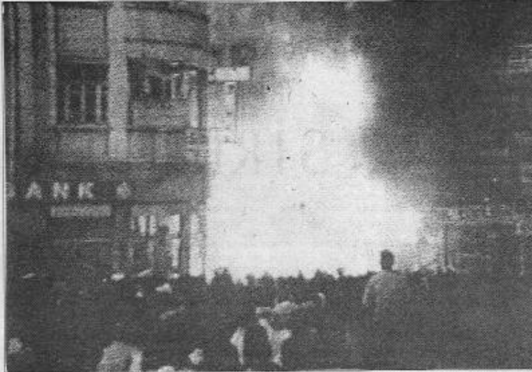
Polis, jandarma ve faşist güruh 37 insanın ölümünü soruşturacak yangını seyrediyor.

1 Temmuz'da gençlik ilk günü "müslümanlar" inzalı bir bildiri yayımladı. Bildiride Aziz Nesin'in Kur'an'ın dokunulmazlığına dil uzattığı belirtiliyor ve "Salman Rüşdi müslümanların çok az olduğu kafir bir ülke de sokaka çıkmaya cesaret ede-