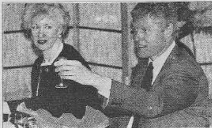
Büyümenin çerefine daha fazla katliam.

Oysa bazı kararlar şimdiden emperyalistlerin oy birliğiyle çıkmıştır. İşte bir tanesi: "Yaşlı nüfusun arttığı sanayileşmiş ülkelerde; sağlık ve sosyal yardım, emeklilik, yaşlılık yardımları gibi harcamaların kısıtlanması..." Bu karar Tokyo zirvesinin "Sonuç bildirisinde" geçmektedir. Ve devamı "kamu ve sağlık harcamaları ile diğer sosyal yardımların tutarlarının düşürülmesi; buna karşılık sözkonusu harcamaların ulaşacağı kitleler açısından etkinliklerinin artırılması..."