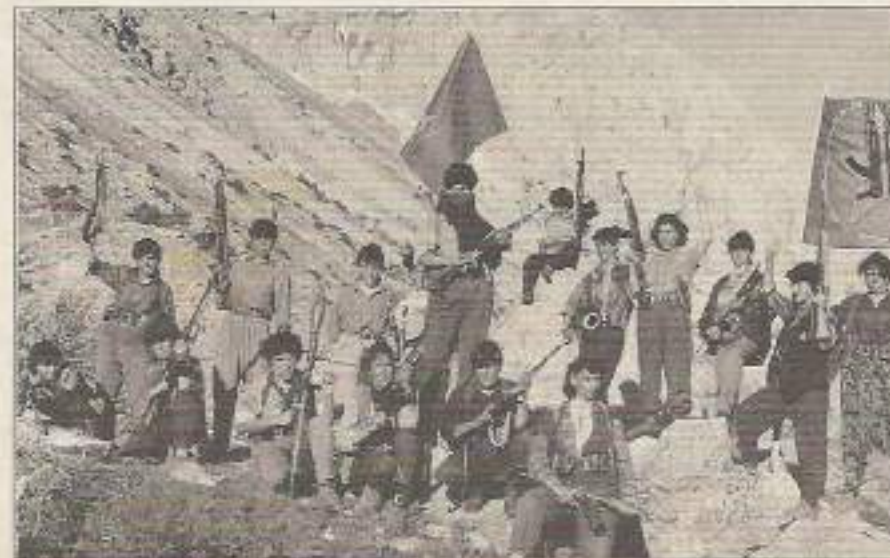
Bereketli Munzur'un dağ kartalları, yeni atılımlarda

ayrılığın kalıntıları ve ayrılık ruhunun mezarı başına parti bayrağını, gerilla savaşının ivmesinin setine de halk ordusu TIKKO'nun sancağını dikti. 10. sayfa