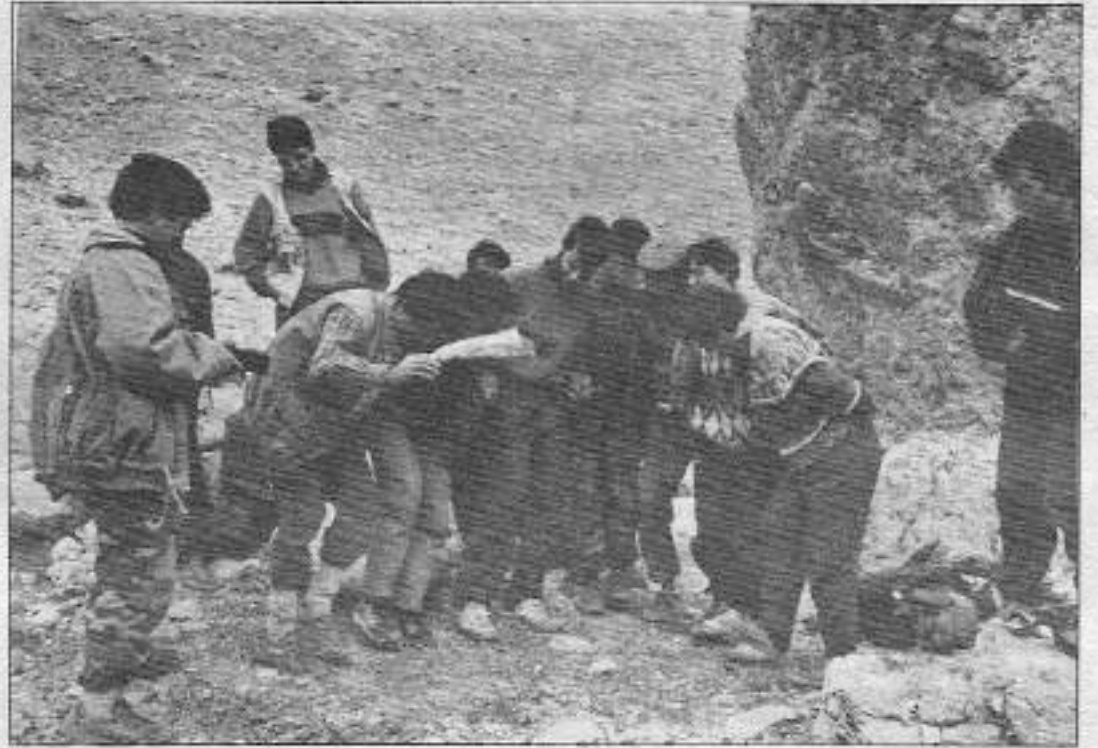
Gerillalar Parti konferansının başıyla sonuçlanmasının sevinişi dönüştürmeye çalışıyorlar

Kışkacı her zaman dört mevsimin yaşadığı bir mekandır. Munzur'lar. Mayıs'ta, etekleri dibinde karın eridiği ve toprağın yumuşama belirdiği yerde ilk gördüğünüz ve solmaya başlayan kardanlere hüznolenmek engelleyemeyeceğiniz bir duygu olarak rahatsızlığınızı ağırlaştırır. Neki burununuz ucuyla toprağı kaşıyarak güneşe çıkmaya hazırlanan gulik sizi yeni adına yatıştırma amacındadır. Gulik de gerillanın kazandı ilk pişen bahar sebzesidir. Bu sebze de yine Munzur dağlarının özgürlük savaşçısı konuklarına özel bir sungusudur. Gulik kartlaşmaya yüz tutarken, bu kez kendine has tadıyla başındaki tozunu yukarı kaldırarak kengerle tanışsınız. Daha çok meyve sekinde yenmesine rağmen gerillanın arzusuna bağlı olarak bazen yemeklerin yanında sebze olarak kullanılır. Sonra İşkin zamanı başlar. Kadim penillalar İşkin toplama ya sevdi. Güneş varsa, bir yap-