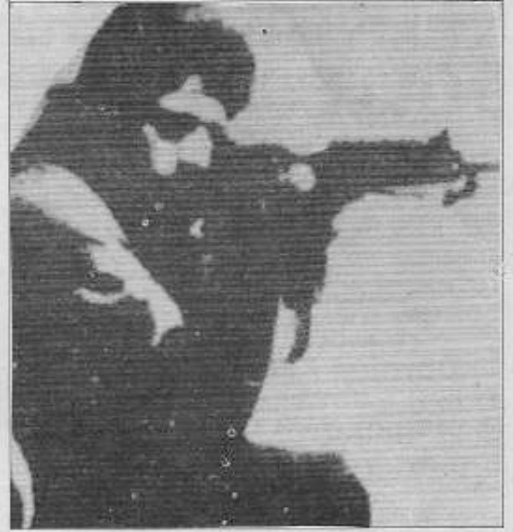
O, namlusunun ucundaki iktidarı görüyordu