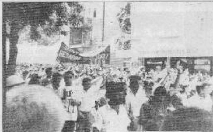
Yürüyüşe katılan yüzbinlerin gözünde gerçek suçlu devlettir

Ailelerin ardında Keçiören Halkevi, Belediye-İş 1 Nolu Şube, Pir Sultan Abdal Derneği, Kâğıthane işçileri, DDSB'li işçiler, Yeni Demokrat Gençlik, CHP... dizilmiş-