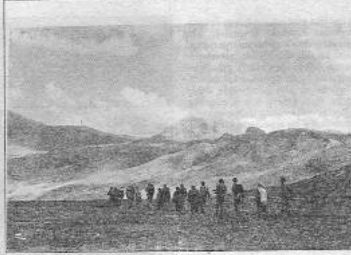
TKP/ML-TIKKO Gerillaları: Üslerine dönüyor

Bu arada hükümet konağının önüne siyah çelenk konulup kitle toplu olarak Ovacık çarşısına girip sloganlar atarak dağıldı. Saat 11.30 suları kepenklerin açılmasıyla YDG'İler Ovacık çarşısına çeşitli dövizler astı. Dövizler iki gün süreyle indirildi. Belediye bopörlerinden Pir Sultan Abdal deyişleri ve katliamı lanetleyen müzik yayınladı. Esnafın bir kısmı da aynı şekilde gün boyu müzik çaldı. Olaylara polis müdahale