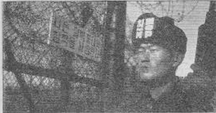
Kuzey-Güney sınırı. Durum oldukça gergin ve Güney Kore'li asker tekle nöbet tutuyor.

Gerici medya da tetiklenerek devreye sokuldu. Newsweek'e göre, Kuzey Kore'yi 45 yıldır yöneten Devlet Başkanı Kim İl Sung'un diktatörcü yönetiminden izleri, başkent Pyonyang'ın sokaklarında