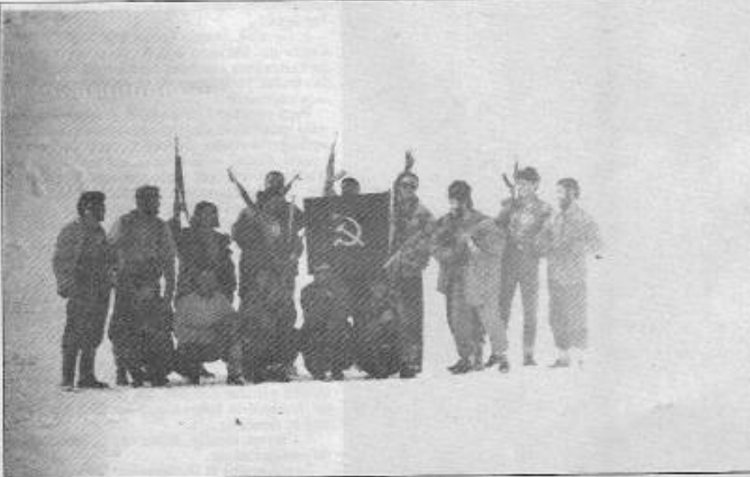
TİKKO birliği öğleden sonra kar yağışıyla birlikte üç grup halinde eyleme yöneldi.