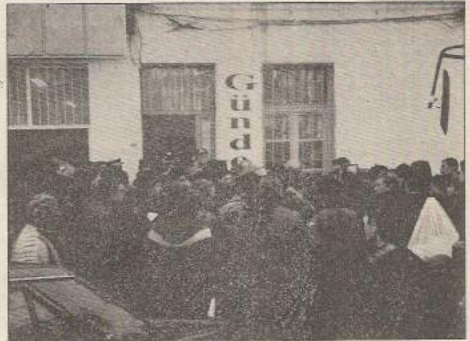
TC'nin faşist terörü, ancak mücadeleyi çelikleştirir!..