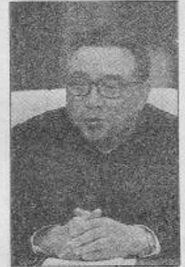
Kuzey Kore'nin revizyonist başkanı Kim İl Sung

Bu teoriye dikkat edilirse, Avrupa ülkelerinde ve sömürge/yan sömürgelelerde iktidarda bulunan sınıflar hakkında (Emperyalist sınıflar mıdır? Komprador sınıflar mıdır? Proletarya mıdır? Halktan sınıflar mıdır?) belirlemeler yoktur. Dolayısıyla, diyalog bir sömürge ülkede iktidarda bulunan sınıflar komprador olsa bile desteklenmelidir.