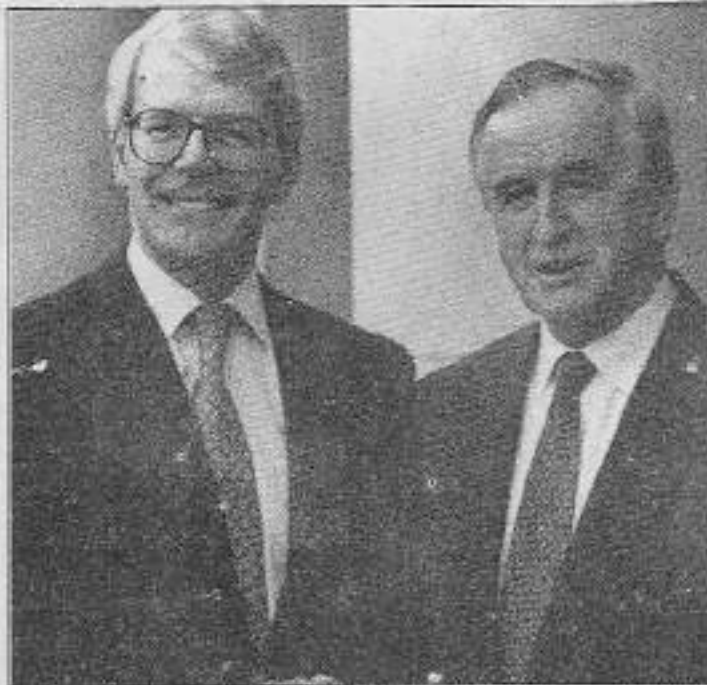
İngiltere Başbakanı Major (solda) ve İrlanda Başbakanı Reynolds (sağda) durmadan memnundur.

Oyle görünüyor ki, IRA uzlaşmacıdır. Çünkü özellikle bu yıl, geri dönüşümlü imkansız ödümler vermiştir ve düşmanıyla uzlaşma planlarına sahiptir. Ezilen İrlanda halklarının tek bir kurtuluş yolu vardır: Marksist Leninist Maoist bir partiyi ve orduyu halk savaşında inşa etmek ve işbirlikçi, İngiliz emperyalistlerinin usakçı İrlanda komprador burjuva devletini yıkmak.