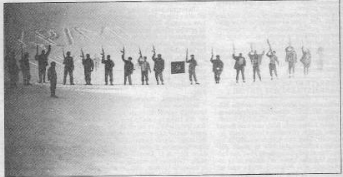
TİKKO güçleri beyaz orduya darbeler vurarak kurtarılmış alanlar yaratma yolunda halka umut veriyorlar.

Bölgede son dönem devrimci güçlere ve halka karşı düşmanca saldırı hareketleri geliştiren, gücünün esasını zora dayalı otorite geliştirme temelinde sivil halka karşı kullanan, devlet güçlerine ve özellikle askeri hedeflere yönelimi gayet sınırlı kalan, daha çok kendisinin zararlı çıktığı bir Yeşilyazı eylemi dışında birkaç karakolu rahatsız etmekten öteye gidemeyen