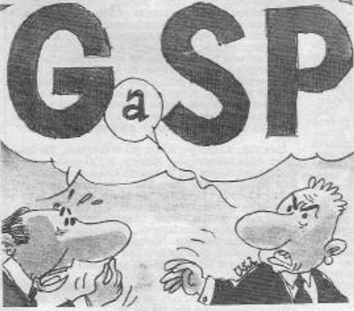
TC'nin, emekçileri sömürmede kullandığı yeni yöntem: GASP

Çünkü tarihte son sözü direnenler söylemiştir.