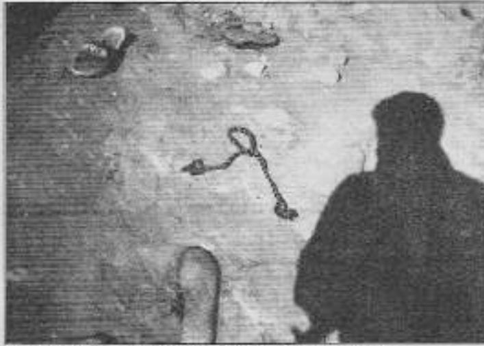
Partizan gölgesinde utancından düğümlenen bağcık.

Yine bir öğle vakti çay içiyorduk, çığlıkların duvarlara gömüldüğü mekanda. Elimize ancak beş sayısından birisinin ulaşabildiği dergi gelmişti. Her zamanki gibi, dağ kokulunu rüzgarlara yükleyip gönderdikleri haberleri öğrenme heyecanı ile karıştırmaya başladık, sayfalarını. Haberlerin iyi olmadıkları daha ilk sayfadan belliydi. Gerçi uzun zamandır, istenmeyen şeylerin olduğunu biliyorduk ama, bu kadarını beklemiyorduk. Her zamanki gibi, soluksuz düşünceler olduğu için değil -bu bizi üzüyor- olsa bile- her düşünce çoğalıyor olamaz bizi sonsuz bir sıcaklıkla sa-