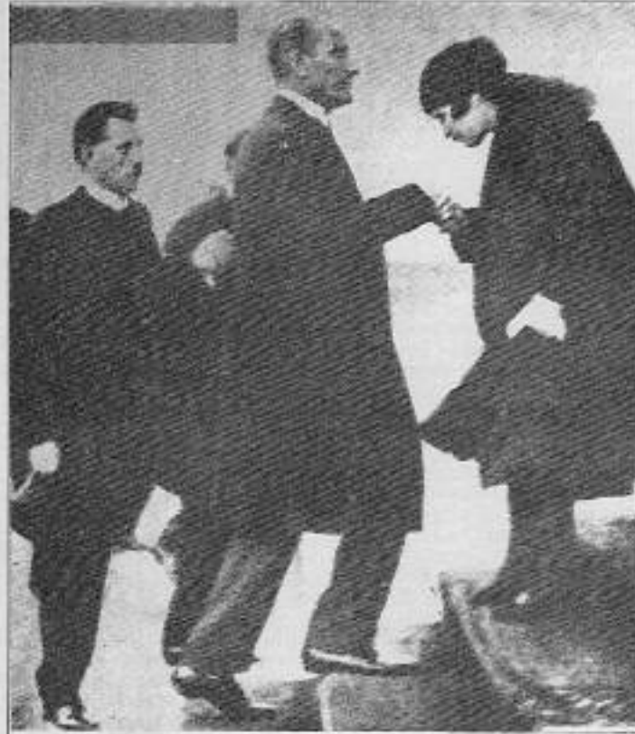
Atatürk'ün görülmemiş fotoğraflarından biri. Türk kadını, kendisini hak ettiği özgürlüklere kavuşturulan Ulu Önderine saygısını sunuyor.

Sosyo-ekonomik yapı ve emperyalizme bağımlılık gereği ülkemizde yaşanan bir çok olgu da korkunç bir ikiyüzlüğe sergilenmektedir. Örneğin, bir yandan kadınlara seçme-seçilme hakkını Avrupa ülkelerinden bile erken verdiğimiz noktasında övünülürken yine aynı yasalarda bu hakkı ve diğer tüm hakları hiçe sayan bir dizi başka yasa mevcut olabilir. Medeni