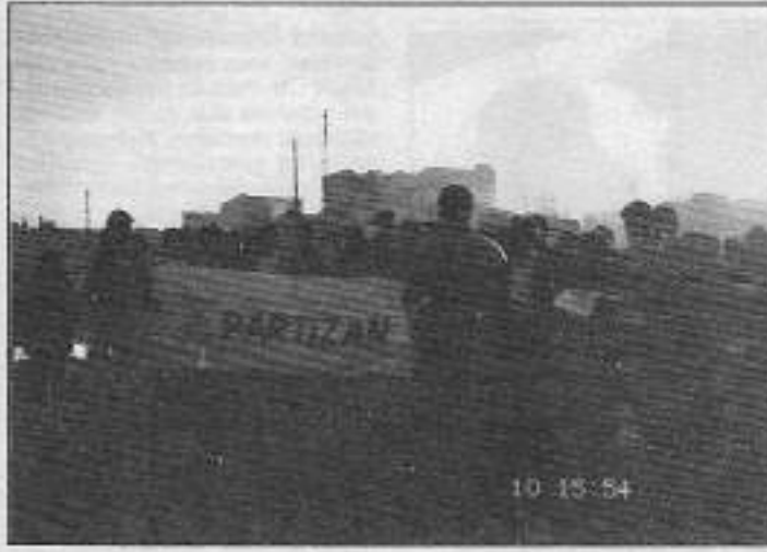
Partizan okurları, işçiler tarafından alkışlarla karşılandı.

İkielli-Halkalı'da bulunan fabrikada, kısa bir süre önce sendikal çalışmaya yürütüyorlar. Birçok işçi