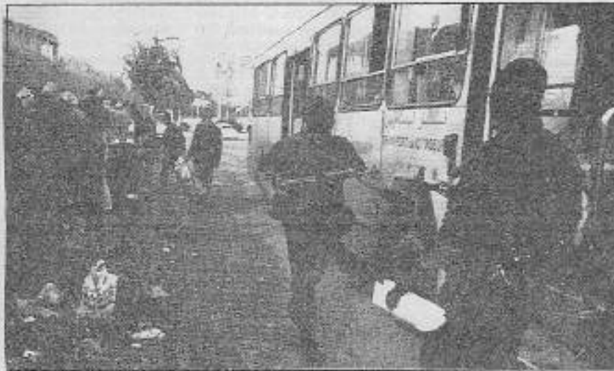
Fağit Cezayir ordusunun maskeli askerleri, sık sık otobüsleri durdurarak "terör" arıyor.

Bu iç savaşta, son iki yıl içerisinde 2.500 Cezayirli'nin öldüğü tahmin ediliyor. Tabii bu arada Fransız ve İtalyan egemen sınıflarının çöklükleriyle birlikte geçen hükümet, "kudret kanı dökülmemesi" yolunda vazlar eşliğinde el altından mistillemeye girişti. Kasım ayı ortalarında, ülkenin Kouba bölgesinde 3 gençin sokağa atılması cesedi bulunmuştu. Hepsisi de yakın atışta öldürülen gençlerin infaz edildiği çok acıydı. Öldürülen gençlerden birinin, tutuklu bulunan İslamci Selamet Cephesi lideri Ali Belhadj'ın yakın arkadaş olması ise tesadüfi değildi. Daha önce de 9 Kasım'da, İslamci bir matematik profesörü öldürülmüş ve "Cezayir'i kanı dökmevi destekleyenler, bunun bedelini ödeyeceklerdir. Göze göz, diş diş," yazılı bildiri dağıtılmıştı. Her iki eylemi de "Özgür Cezayirli-