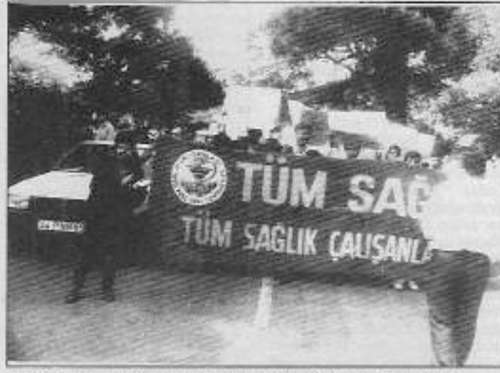
Sağlık çalışanları haykırıyordu: "Kendi 15-16 Haziranlarımızı yaratacağız"

Tüm Sağlık-Sen Genel Merkez imzasyıla yapılan açıklamada, devletin grev ve toplu sözleşme hakkını tanımamakta ısrar ettiği, %15'lik zammın dayatıldığı, kamu