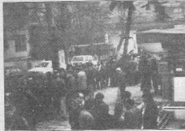
İşçiler vazo kuyruğu eyleminde

Kartal Belediyesi işçileri, eylemlerinin yetersizliğine ve gelişen güncel olaylara duyarlılıklarına dair şunları söylediler: "Bu kadar olumsuzlukların, bu kadar duyarlı kalmamızın sebebi, olayları bireysel ekonomik bağımsızlık çerçevesinde görememizdir. Geçmiş dönem