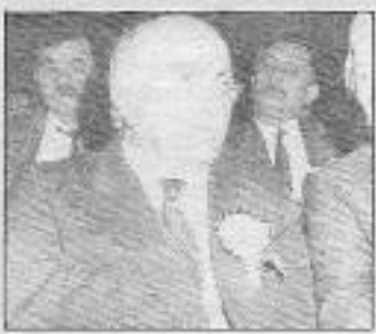
Nebioğlu'nun kalmi sloganlara dayanamadı

İkinci müdahaleyi Eğitim-Sen ve Tüm Bel-Sen pankartlarına yapmaya çalıştılar. Ancak kamu emekçilerinin sert ve devrimci iradeleri karşısında utanıp, geri çekilmek zorunda kaldılar. Gözaltına alınan Halkevi Platformundaki insanların geri bırakılması için, ilk protesto eylemi DKO ve devrimci güçlerden geldi. Mitingin saat 13.00'te başlamasını isteyen DİSK diğer kitlelerin "Arkadaşlarımızı bırakmadan yerimizden kimildamaya-