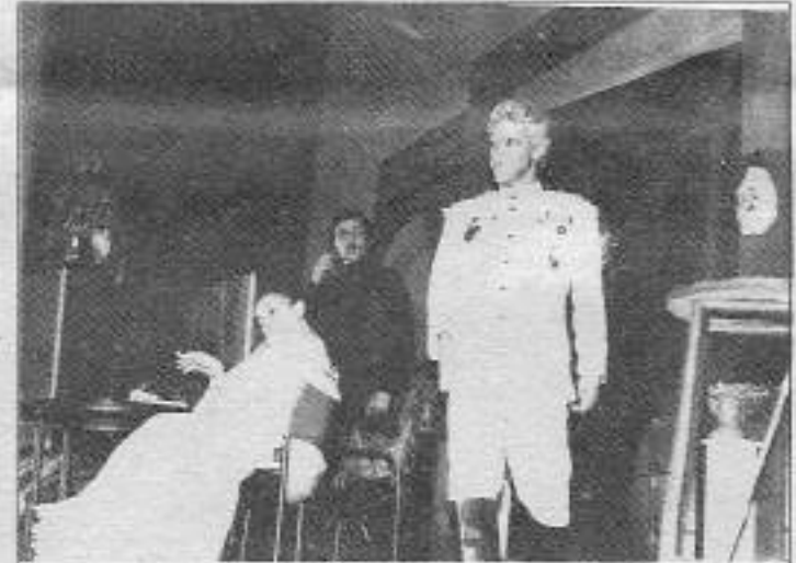
ABT "Üç kuruşluk diktatörlük" oyununu 20 Mayıs'ta Eskişehir'de sahneledi.

Önemli Not: "İnisiyatif" 19-20 Haziran'da Batman'da yapılacak "Şenliğe" katılacak. İlgilenenler (9-1) 244 44 23 no'lu telefondan bilgi alabilirler. "İnisiyatif" periyodik olarak Çarşamba günleri saat: 19.00'da