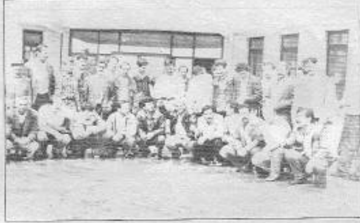
İşçiler ve aileler: "Taşeron Beykoz'dan bir kurdan kaldırmaya kalksa kıyamet kopacak" diyorlar...

24 Mayıs'taki çatışmada Beykoz'lu kadınların bir çoğu polis jopuyla ife ilk kez tanışmıştı. Ferda-