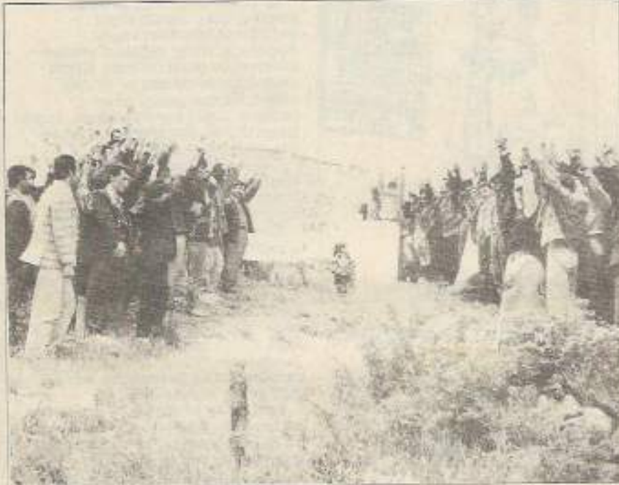
İbrahim Kaypakkaya mezarı başında kızıl bir coşkuyla anıldı.

■ 18 Mayıs 1973, çeşitli milliyetlerden Türkiye halklarının Kaypakkaya'nın ideolojisini öğrendikleri gün olmuştur. Bugün O'nun takipçileri kavganın göbeğinde giderek çelikleşiyorlar.