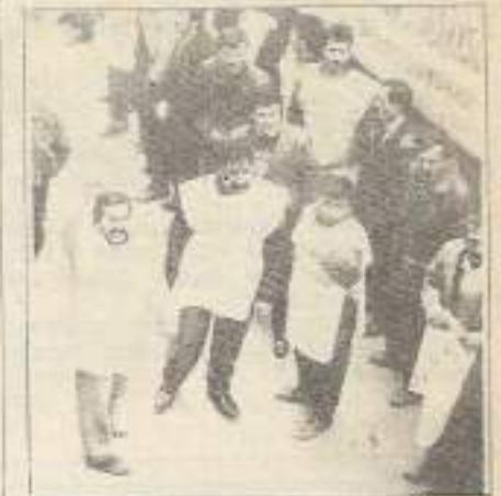
"İşçi sınıfına bir zafer armağan etmek istiyoruz."

■ Devrimcilerin sorumluluk alanına girmeyen Bozo haininin; içine düştüğü aczi, devrimcilere malederek burjuvazinin değirmenine su taşımak ve devrimci değerleri bir yana bırakarak onları burjuvazinin ağzıyla yargılamaya çalışmak bu bulvarda safa girmeye götürür. 10. sayfada