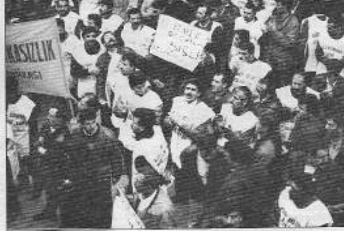
Kağıthane belediye işçileri kararlı mücadelelerini, hızlarını kesmeden yükseltiyorlar.

Kağıthane işçilerinin talepleri işçi sınıfının bu günlerde yoğunlaşan genel taleplerini de karşılamakta: eylem perspektif ve anlayışları İstanbul genelinde yoğunlaşan işçi