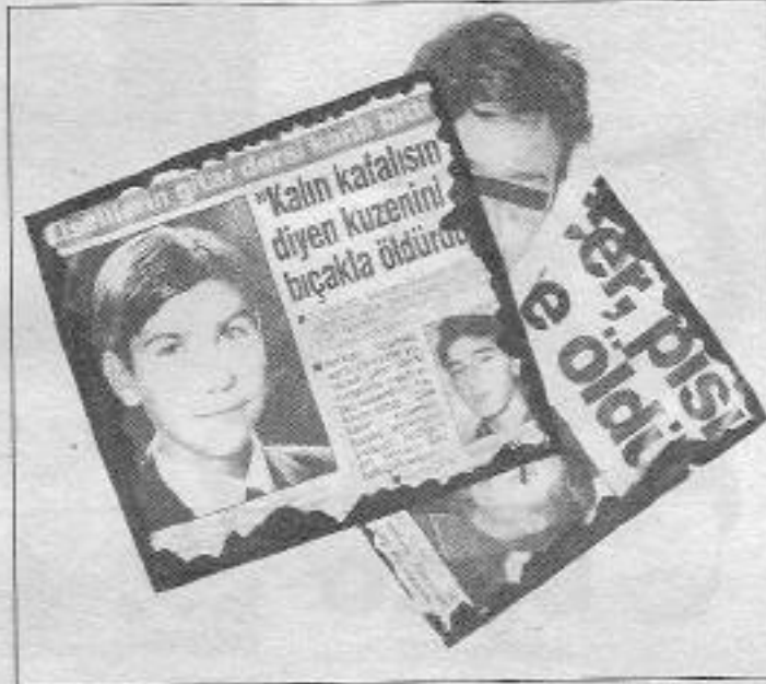
Liseliler gençlikle ilgili cinayet haberleri burjuva basının sütunlarını bir sönürü nesnesi olarak süslüyor.

"Giyotin Muammer" adıyla anılan okul müdürü olay unutulduktan sonra Bakırköy İnce Müdürlüğü'ne alınarak öldürülmüştü. Şimdi, olay unutturulmaya çalışılıyor. An-