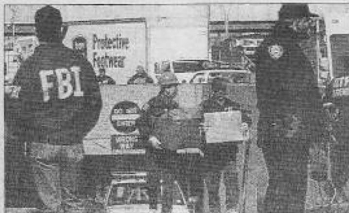
FBI "suçlu" ararken