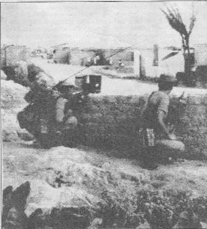
Lima gecekondularında siperlenen Peru gerici ordusu

Gecekondulu sakinleri, Delegasyonu oradan ayrılınca tüm dünya halklarına şu mesajı ilettiler: "Gittiğiniz her yerde, burada gördüklerimizi ve duyduklarımızı anlatın. Tüm dünya halklarına kızıl selamlar!.."