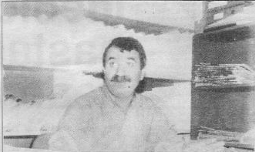
"İğnçtir o zamanlar 'Sovyetler kurtarsın Kürdileri' diyen kişiler, bugün 'Amerika kurtarsın' diyorlar."

— Yok yok. Şapkası yoktu. Kaypakkaya'yla. Gazetemizde iki defa karşılaştım. Biri-