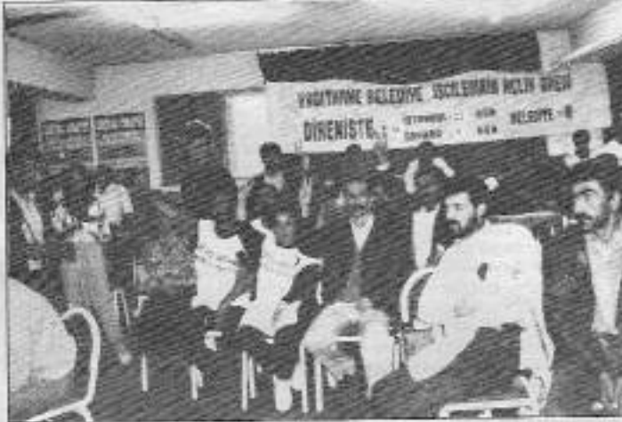
Yeni Demokrat Güçler birliği mezarı başında andıktan sonra Ankara'da Kağıthane işçilerini ziyaret ediyorlar.

ildiği işçi kıyımı ve partizanca tutumunu olde. Bu görüşmenin ardından Bulvar Duğun Salonu'na döndüklerinde bir değerlendirme toplantısı yapıldı. Gelecekteki süreçle ilişkin öneriler alındı. İşçilerin kendi aralarındaki bu değerlendirme toplantısı kararlılıklarına gölge düşmemesine rağmen eylemlerini değerlendirmeye de nasıl farklı sonuçlara ulaşabileceklerinin bir örneğini oluşturuyor. Nitekim, bu tarihten sonraki süreçte de bu toplantı da öne çıkan fikirler hep tartışıldı, etkili oldu. Sözcü Selman Yeşilgöz'den toplantının bir değerlendirilmesi istediğimizde bize şunları anlattı: "Yapılan bu toplantıda ilginç şeyler oldu. İlginç öneriler geliyor. Bazılar işgal önerileri getiriyor. Kiminin işe pasif eylem biçimleri önerdiğini görüyoruz. Örneğin iltica talebinde bulunmak gibi ilginç bulunabilecek öneriler de geldi. Bir arkadaşımız da Antakya'ya ziyaret önerisi getirdi. Buna şiddetle karşı çıktık." sözcüğünün bu son öneriyi reddederken söylediği şeyler ise, eylemin bugüne kadar bürokrasi