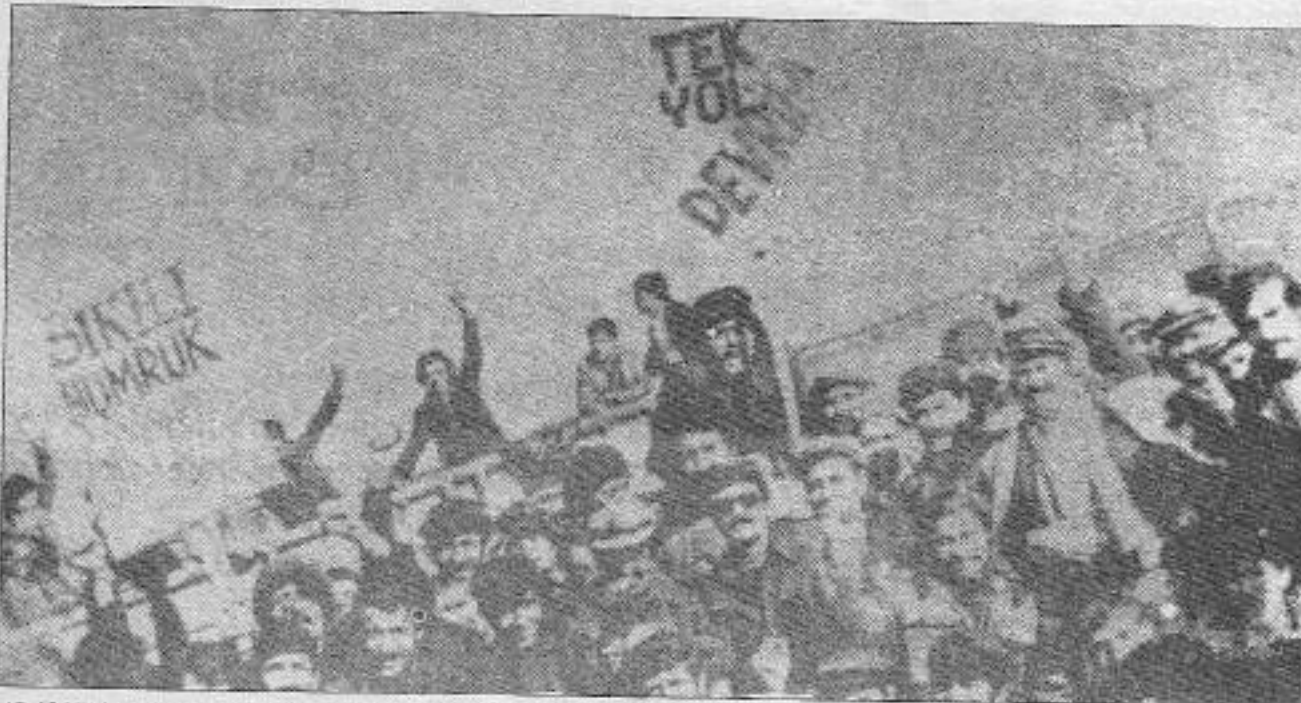
15-16 Haziran'da sıklan yumruk, düzene kahredici son darbe olarak inecektir.