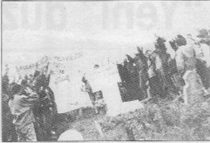
13 yıl aradan sonra İbrahim Kaypakkaya Karakaya köyündeki mezarı başında yoldaşlarının coşkulu katılımıyla anıldı.