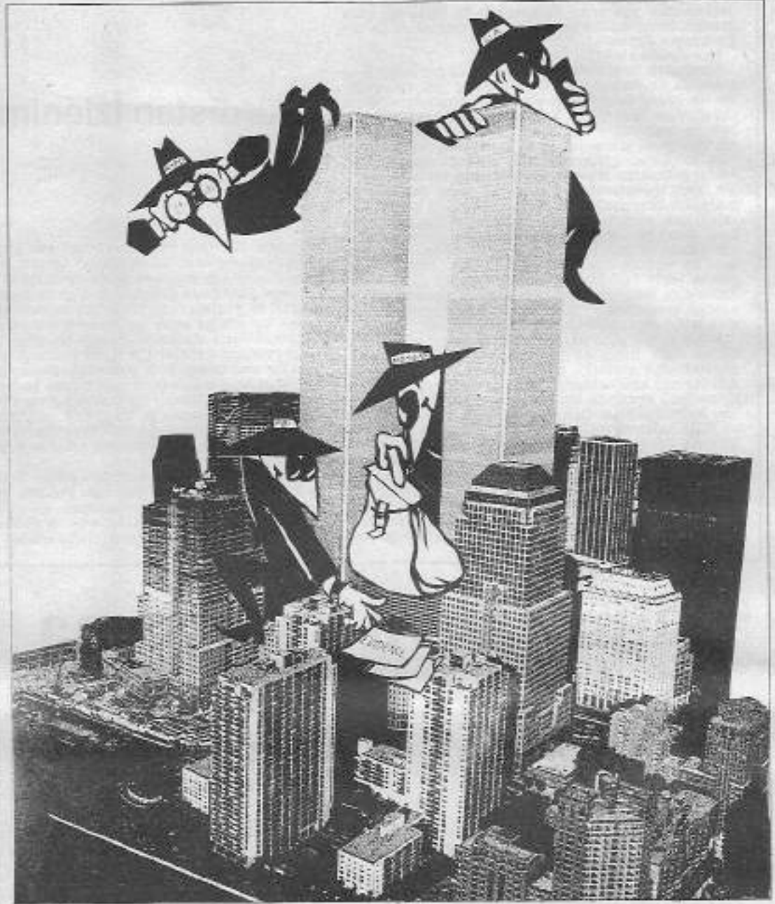
Dünya Ticaret Merkezi hedef yanıtmak amacıyla gizli servislerin yardımıyla bombalandı.

İsrail'i gerici Meir Kahane, Batı için Galile ve Gazze'den, yani Fi-