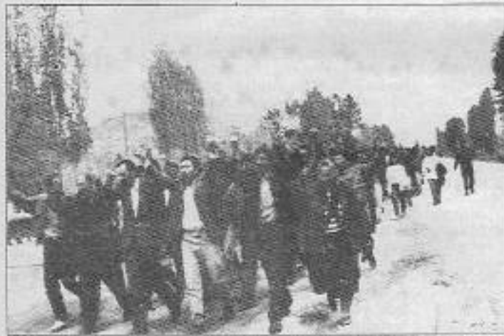
Yeni Demokrat Güçler tüm askeri önlemlere rağmen mezarlığa girtiler ve kavga sloganlarını haykırdılar.

Ayrıca kampüste üzerinde İbrahim Kaypakkaya'nın Çizdiği Kızıl Güzergahta İleri!" yazılı YDG ve Partizan imzalı afişlemelerin yapıldığı görüldü.