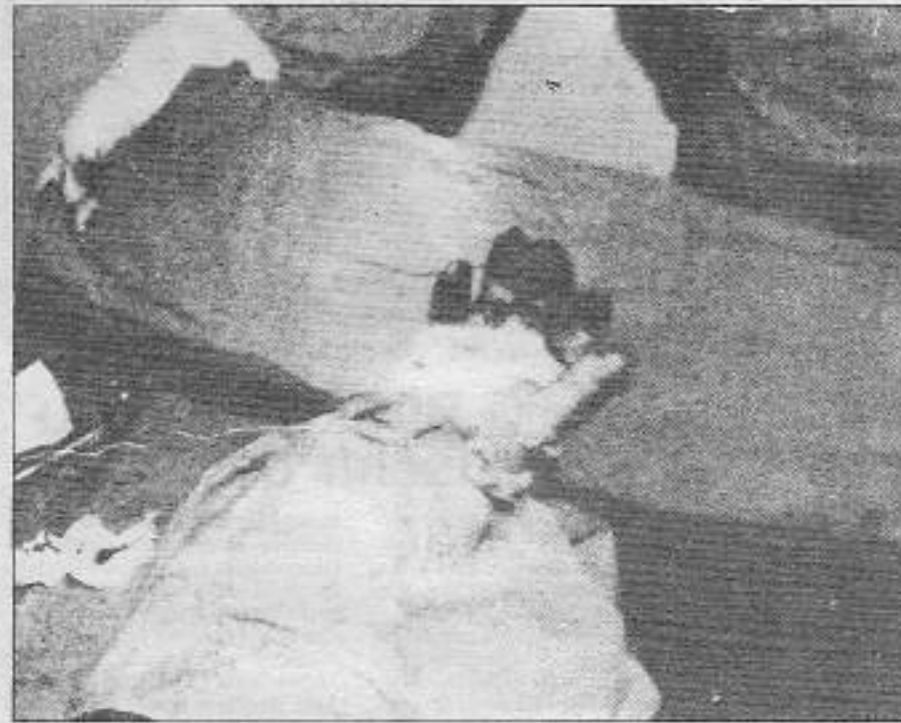
Bugün kopan kollarımız, yarının kurucusu olacaktır

Çalışma koşullarının iyileştirilmesi, işçi sınıfının yaşam hakkının garanti altına alınması hedefi, ülke genelinde verilen bağımsızlık ve halk demokrasisi mücadelesinin bir parçasıdır. Çarpık, düzensiz olan bu üretim ilişkileri ancak demokratik devrim süreciyle çözülecek böylece üretici güçler önündeki engellerin kaldırılmasıyla birlikte üretim ilişkileri de zincirlerinden boşalacaktır.