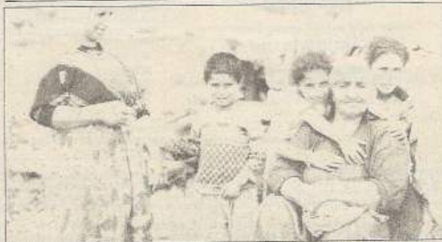
Polisleriyle geldiler, gecekonduları yerle bir ettiler 19. sayfada

■ Gecekondu halkı: "Gittiğiniz her yerde burada gördüklerinizi ve duyduklarınızı anlatın. Tüm dünya halklarına kızıl selamlar." 23. sayfada