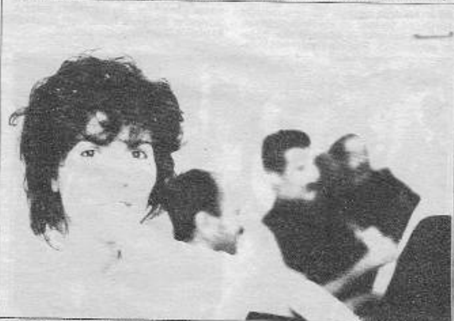
Gülüştünü tam yaranın üstüne bastır Durduğun yer yüreğidir kavganın

Sağlık Bakanlığı'nca hazırlanan yasa tasarısına göre, Verem Savaş dispanserleri kaldırılacak, hastalar sağlık ocaklarına aktarılacak. Diyarbakır Verem Savaş Derneği yetkilileri, hastaların gittikçe arttığı bu ortamda V. S. Dispanserlerinin kaldırılmasının sakıncalı olduğunu belirtiyor..