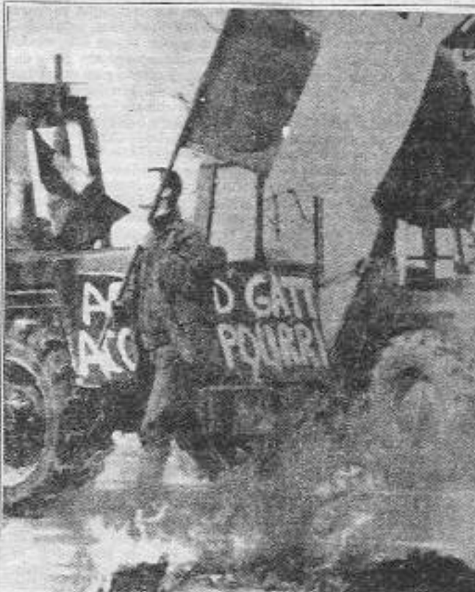
Fransız çiftçiler marketleri basarak anayolları patateslerle kapatarak, yolları ateşe vererek oldukça radikal eylemler gerçekleştiriyorlar

İşbaşına geldiğinden beri ABD'ye ödünler vermeye başlayan Fransız hükümeti, bu ödünleri gün geçtikçe arttırmaktadır. Oysa hükümet yetkilileri bunun tam tersine ABD'nin Fransa'ya ödünler verdiğini iddia ediyorlar. Emperyalistler arası dalaş, özellikle Fransız çiftçisini daha fazla eylem yapmaya götürecektir.