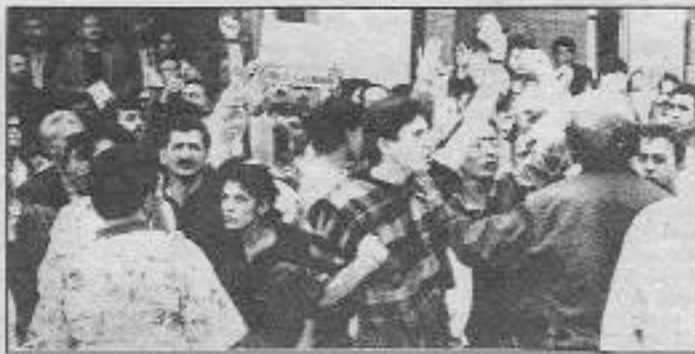
Kemalist Laikler Uğur Mumcu'nun ölümünden sonraki dayanışmalarını "Aydınlık" için pek gösteremediler.

"Aydınlık" gazetesinin Reformist ve Kemalist düzlemde sürüp giden dinsel bağnazlıkla hesaplaşma heveslerine devrimci çevreler sınıfsal gündemin içinde ve ihtiyatlı bakıyorlar.