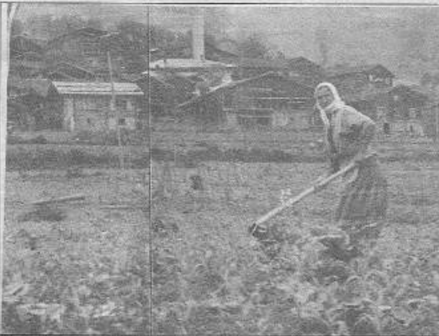
Tarlada çalışan emekçi üreten ama aç kalandır.