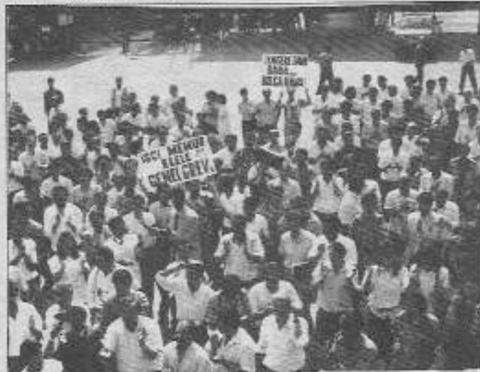
İşçi kıyımları, tasarruflaştırma, özelleştirme, sendikasılaşımaya karşı kitlesel bir tavır koymak için en uygun zaman.

İşçi kıyımları tasarruflaştırma özelleştirme sendikasılaşımaya karşı kitlesel bir tavır koymak, ve suskunluk perdesini yırtmak için en uygun zaman. Burjuvazinin emirleri doğrultusunda politikalar benimsen devlet karşı bu fırsatı işçi sınıfı kaçırmayacak.