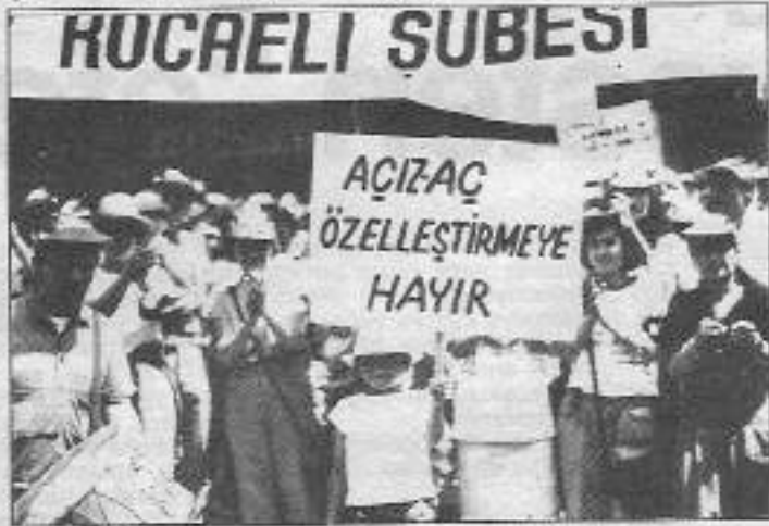
Kamu sektöründe özelleştirme uygulamalarına karşı işçi sınıfı sesleri yükseliyor.

Konya Şeker Fabrikası işverenleri işyerinde emekçiler arasında var olan birliği bozarak, güçlerini bölmek için benzer yollarla tayin talep eden memurların tayinini çıkartınca 91 işçi tekrar tayin dilekçesi verdi. Bu kez dilekçelerine "fabrikanın satıldığı dönemde tayin protokolü olmaması ve protokol imzalanmamasından dolayı da işçilerin şu anki yönetimle hiçbir ilişkisinin kalmadığı" gerekçesiyle red yanıtı verildi. İşveren işçi ve memurlar arasında yarattığı bu ayrımı körlüklemek için de elinden geleni yaptı ve bütün memurları toplayıp "iste-