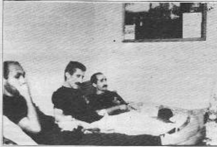
"İnsanlar şunu anlamalıdır. Bu aynı zamanda bir irade olaydır. Biz onları irademizle de yeneceğiz."

İşçilerin kamuoyu yaratmaları ciddi bir çalışma sonucu gerçekleş-