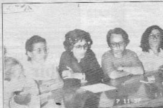
"Halkımız bu kirli savaşın durdurulması için harekete geçmeli"

Kadın Platformu üyeleri, onlarca PKK gerillasının bu saldırılarda yaşamını yitirdiğini, son günlerde gerillanın saldırısını bahane eden devletin Kürdistan'a azımsanmayacak oranda yığınak yaptığını belirterek: "her tarafı açık savaş alanına döndüren Kürdistan'da teknolojinin en gelişkin silahlarının bütün zamansızlığıyla karkusup yıkıcı bir güce dönüştüğünü, köylerin bombalanıp, evlerin yakılıp-yıkıldığını; insanların katledildiğini" ve bu kirli savaşın en çok kadınların etkilendiğine işaret ederek "Türkiye proletaryası, ve geçitli milliyetlerden emekçi halkımız bu kirli savaşın durdurulması için harekete geçmeli, Kürt halkının haklı davasında onun yanında olduğunu somut eylemleriyle ortaya koymalıdır" dediler.