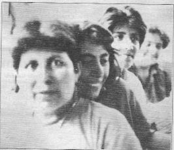
Deri işçi kadınlar sendikada toplantıda... 800 bin lira aylığa razı oldukları için patronları güldürüyorlardı... Şimdi sıra onlarda...