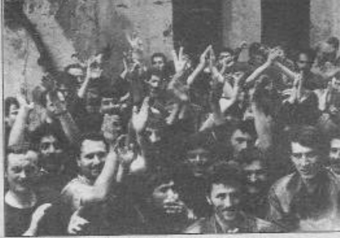
Soğanlıköy'de bir işçi atılınca diğerleri derhal eyleme geçiyor.

diler. Patron, direnişin sürmesi üzerine işçilerle anlaşma yapmayı kabul etti. Anlaşmaya göre "Atılan bir işçi işe alınmayacak, diğer 7 işçi ise geri alınacak, olay unutulacak. Bu eylemden dolayı hiç kimse suçlanmayacak, baskı yapılmayacak."