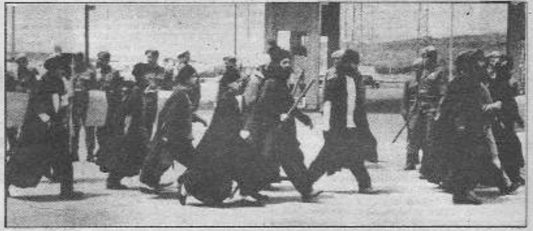
Dinsel gericiler "Şeytan Ayetleri"nin yayınlanmasına kitabı hiç okumalarına rağmen çok kızdılar.

Şeytan Ayetleri daha yayınlanmadan "Aydınlık Gazetesine dini ve resmi çevrelerin engellemeleri başlamıştır bile. İstanbul Valiliği yazı dizisinin tanıtım afişlerinin asılmasına kitabın Bakanlık kurulları yasaklandığını öne sürerek izin vermezken, Birleşik-Basın-Dağıtım 25 Mayıs'da bayilere yönelik ölüm tehditlerini öne sürerek Diyarbakır, Van, Muş, Batman, Mardin, Urfa, Bingöl ve Siirt illerinde "Aydınlık" dağıtmaya çağını açıktıyordu. Şeytan Ayetleri'nden bölümler yayınlamaya başladıktan sonra baskıları dozunda artıyordu. Kitaptan bölümlerin yer aldığı bütün "Aydınlık" sayıları İstanbul'da Mahkeme kararıyla toplanıyordu. 29 ve 30 Mayıs'da İzmir "Aydınlık" bürosuna 2 saldırı oluyordu. İki "Aydınlık" İzmir Bürosunun açılışında gerçekleşiyor, ikincisinde ise büronun camları 40 kişilik bir grubun saldırısı sonucu kırılıyordu. 30 Mayıs'da Kürdistan dışında da gazetesinin dağıtımını engelleniyor, Kayseri Malatya, Kırşehir, Erzurum, Tokat, Bursa, İstanbul'un kimi semtleri, Erzurum ve Niğde'de okurlarına ulaşamıyordu. İP Çevresinin yan kuruluşu olan Kaynak Yayınevi'nin Çağaloğlu'ndaki binası bir grup dinci-fanatik tarafından 28 Mayıs'ta basılıyor ve demir çubuklu sopalı saldırıya uğruyor. Yayınevi çalışanları İSMET ÖGÜTÜÇÜ'yu ağır yaralayıp, Turan Dursun'un kitabı ve diğer malzemelerini tahrip edip