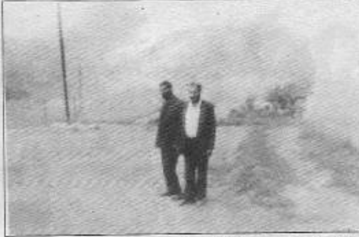
Amca çocuklarını birleştirten ortak kaderi hepimiz biliyoruz; yakınlar çöp altında.

Olayın yeni olduğu günlerdeki çalışmalar sonrasında kepeçler harıl harıl çalışırken, daha sonra orta-