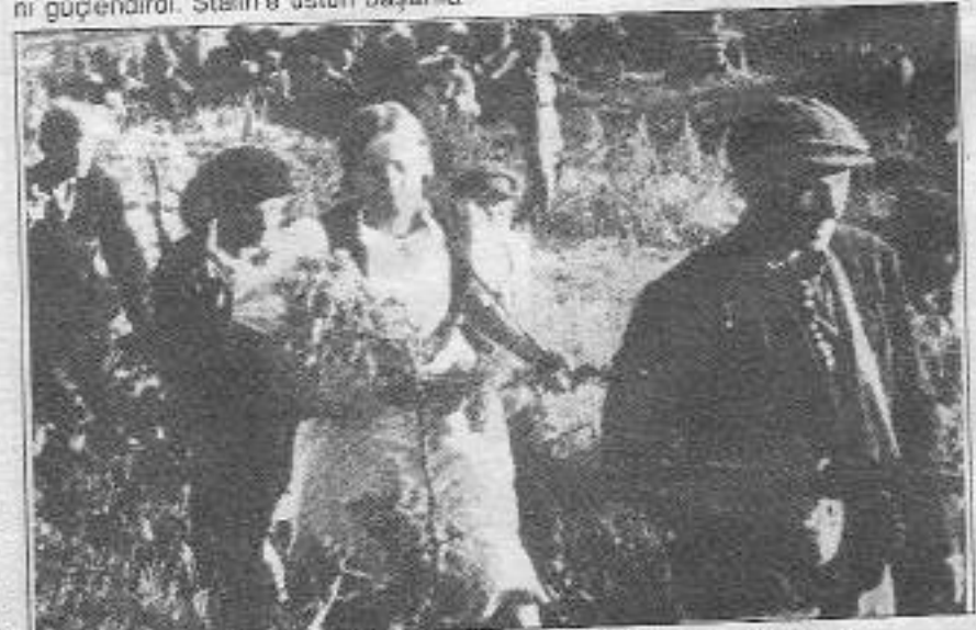
İşgalci faşist Nazilere karşı, tüm Sovyetler halkı Partizan savaşındaydı

Bu savaşlar boyunca Sovyetler Birliğiyle müttefik olan İngiliz ve ABD emperyalizmi, kendi kaderlerinin de Sovyetler Birliği'nin kaderiyle aynı olduğunu bilmelerine rağmen; önceleri destek veremeyerek Sovyetler Birliği'nin kendisini bir daha toparlamayacak derecede tahrip olmasını istiyorlardı. Böylece can düşmanları olan sosyalizmi yıkmaları da kolaylaşacaktı. Ancak faşist Alman ordularının Moskova önlerine kadar ilerlemeleri, onları panik içine soktu. Zira Sovyetlerden sonra sıra kendilerine gelecekti. Ancak bunu anladıktan sonra der ki, savaşa yüklenmeye başladılar. Öte yandan inisiyatifi Sovyetler Birliği'nin eline geçmeye başlamasıyla da yeni panikler yaşadılar. Bu tutumları onların, Sovyetler Birliğiyle kurdukları ittifaktaki iki yüzlülüklerinin göstergesiydi.