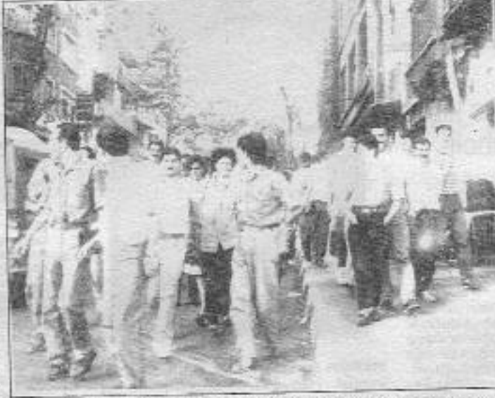
Devrimci Çözüm dergisi çalışanları, sosyalist basın temsilcilerinin gözleminde binadan güvenli bir şekilde uzaklaştırıldılar.

10 Haziran günü DK hizbi olarak adlandırılan gruptan bir kısmı insan Devrimci Çözüm dergisine geldiler ve kapı girişinde yakaladıkları bir dergi okuruna kapıyı açtıkları için baskı yapan grup, dergi okuru bu isteklerini kabul etmeyince ağzına silah dayadılar. Daha sonra tehlikeyi farkedip, kapının arkasında barikat kurarak dergi çalışanlarına, kapıyı açmaları için seslendiler. Tank anıtlarına göre, saldırgan grup kapıya ateş etmek istedi ama silah tutukluk yaptı. Bu kez de ellerindeki sopalarla kapıyı kırmaya uğraştılar. Dergi çalışanları sosyalist basından yardım isteyince, kapıyı bir