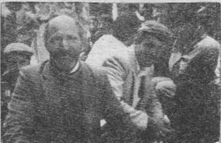
Dersim halkı bombalamalar yüzünden ormanlara giremez oldu.

baskılar, bombalamalar ve halkı göçe zorlama politikasını ün geçtikçe daha pervasız bir şekilde uygulamaya devam ediyor.