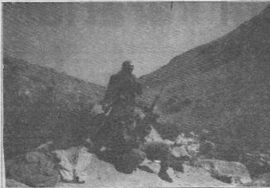
5 Haziran 1992 yılında çalışmada şehit düşen Hıdır Doğan (oturan) komutanıyla birlikte TIKKO gerillalarının geçici bir kampında nöbet tutarken görülüyor.

PKK'nın bu tür eylemleri ve anlayışlarına, nereden bakılırsa bakılsa Kürt halkının kurtuluşuna hizmet et-