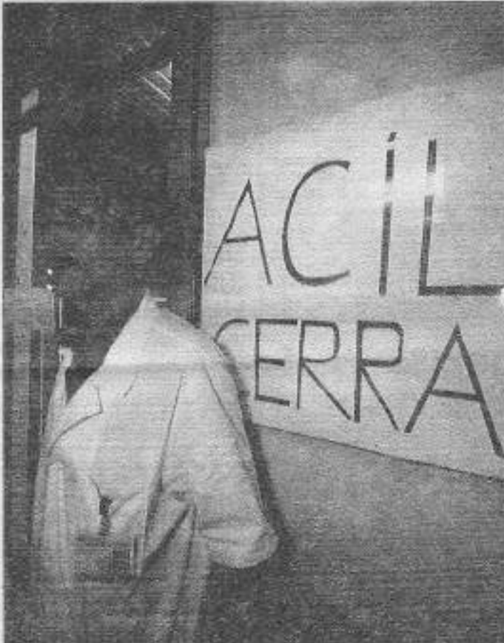
Düzenin bütün kurumları gibi hastanelerde vurguncu, yoz, ticari işletmeler oldular