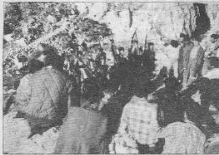
Dersim Bölgesi TİKKO gerilla birliği bir toplantı anında

"Düşmanın bütün bu tedbirlerdeki amaç kendilerini ve karakollarını korumaktır. Ancak düşmanın bu çabaları nafiledir. Gerillalar akıl ve cesaretle birleşebilen usta planlarıyla düşmanın planlarını alt üst edip, düşmanın inine girip düşmana büyük kayıplar verdirebilmektedir. Saldırı sırasında pasuda olan diğer düşman birliklerinin ateş etmeleriyle başlayan otuz dakikalık silahlı çatışmada TİKKO gerillaları kayıp vermeden başarıli