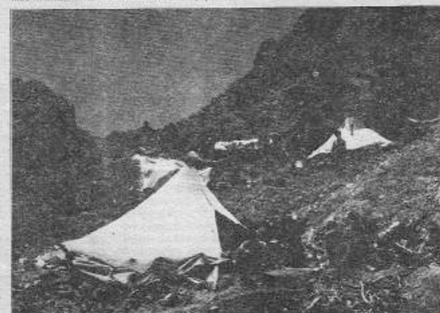
21 yıldır Halk Demokrasi, Bağımsızlık, Sosyalizm ve yüce Komünizm dogrultusunda Başkomutan İbrahim KAYPAKKAYA'nın çizdiği güzergahta her gün biraz daha gelişip güçlenerek ilerleyen TİKKO (Türkiye İşçi Köylü Kurtuluş Ordusu) ülherin bozkırlarını düzene karşı ateşlemiş ve emekçi ezilen halkın umut kaynağı haline gelmiş silahların namularından çıkan ateşlerle kılışturmaya devam ediyor. Yukarıda TİKKO'nun bir gerilla birliği geçici kamp esnasında görülmetedir.

Yeter ki halk, partimize destek olma- ya ve bu son savaşa hazırlanmaya devam etsin. Beylerim saraylarını yıkarak zor olmayacaktır.