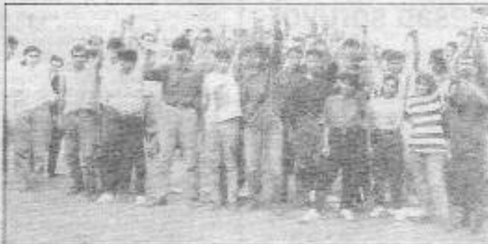
Deri işçilerinin kır gezisinde insanlar kaynaşmışlar, eğlendiler, devrimci duygularla coştular.

Bu gezile yönelik eleştiriler ise kitlesinin düşük olması, organizasyonun daha güçlü olması gerektiği ve Grup Munzur'un programının kısa kesilmesiydi.