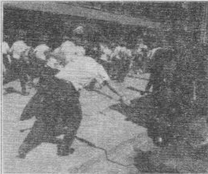
Polis Necatibey'de acımasızca kitleye saldırdı.

Adana Kamu Çalışanları Platformunda yer alan sendikalar; Demiryol-Sen, Eğitim-Sen, Sağlık-Sen, Emek-Sen, Maden-Sen, Tüm Haber-Sen, Tüm Banka-Sen, Tüm Sağlık-Sen, Eğitim-İş, Enerji-Sen, Orkani-Sen, Tüm Bel-Sen, Tüm Sosyal-Sen ve Tüm Maliye-Sen'den oluşuyor.