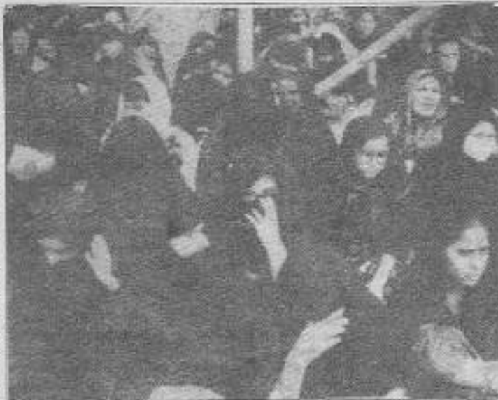
İslamiyete, erkeğin 3 kez "boş of" sözüyle du kalan kadınların yaşamları çarşafı gibi karadır