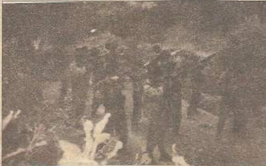
Kızıl Siyasi İktidarlar için savaşan TIKKO gerillaları.