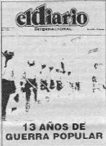
El Diario'nun Avrupa'da yayınlanan nüshalarından biri.

Halklarımızın dayanışmasını daha çok güçlendirmek için çalışıyoruz. Bunun için, özellikle El Diario'da bunu formüle eden yazılar yayımlanıyor. Ben Mayıs 1993 tarihli sayısında çıkan bir yazının İngilizce çevirisini ve bu sayının İspanyolca ve İngilizce birer nüshalarını size sunmak istiyorum. Bundan önceki sayıya da, bir Barbara Anna Kistler ile ilgili olmak üzere iki yazı yayımlandı. Gazetemiz İngilizce, Fransızca ve İspanyolca dillerden yayınlanıyor ve aşağı yukarı bütün kıtalara dağıtılıyor. Amerika, Latin Amerika, Asya, Afrika ve Avustralya'da ve toplam 40'ün üzerinde ülkede dağıtılıyor. Bu görüşmelerimiz daha yakın ilişkiler ve dayanışma için büyük önem taşıyor. Bunun için teşekür ediyor ve mücadelemizde başarılar diliyoruz.