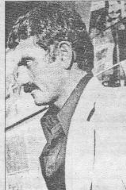
Yılmaz GÜNEY: Mahpuslarda susturulamayan bir yürekli

Devamla; "Yılmaz Güney yurt dışına göçtüktan sonra Paris'in varoşlarında keyif çatmadı ve orda da mücadelesine devam etti, boş durmadı. Bir taraftan film çalışmalarını yürütürken bir taraftan da faşizme karşı mücadelede üzerine düşeni yapmaktan geri kalmadı. Bir mücadele adamı olarak toplantılarda, eylemlerde yerini aldı. Hasta olmasına rağmen Türkiye'deki özgürlük mahkumlarının işkenceye ve idamlara karşı başlattığı açık grevlerine destek amacıyla Avrupa'da başlatılan uzun yürüyüşte yer aldı, faşizmi