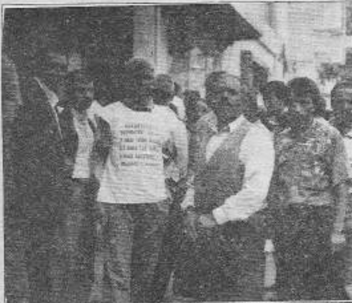
4 aydır maaşları ödenmeyen Küçükçekmece Belediyesi işçileri gitgide radikalleşen eylemlerini sürdürüyorlar.

Küçükçekmece işçileri bu yazı baskıya girildiğinde daha radikal bir eylemi tartışıyorlardı. Bu direniş gerçekleştirmek için şimdiden komiteler kurup çalışmalara başladılar. Bundan böyle belediye işçilerinin direnişlerine daha çok sık tank olacağız.