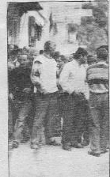
İşçiler hep bir ağızdan bağırıyor: "Küçükçekmece işçisi köle değildir."

Uzun süredir sendikal rekabete soyunan Genel-İş işçileri duygu-sal yönden sömürerek üye yaptı. Ancak şimdiki işçilerin çoğu geri dönmek istiyor. Bu geri dönüşler-de biri 7 Eylül günü yapılan yürüyüşte yaşandı. Bir sürü işçiyi Ge-