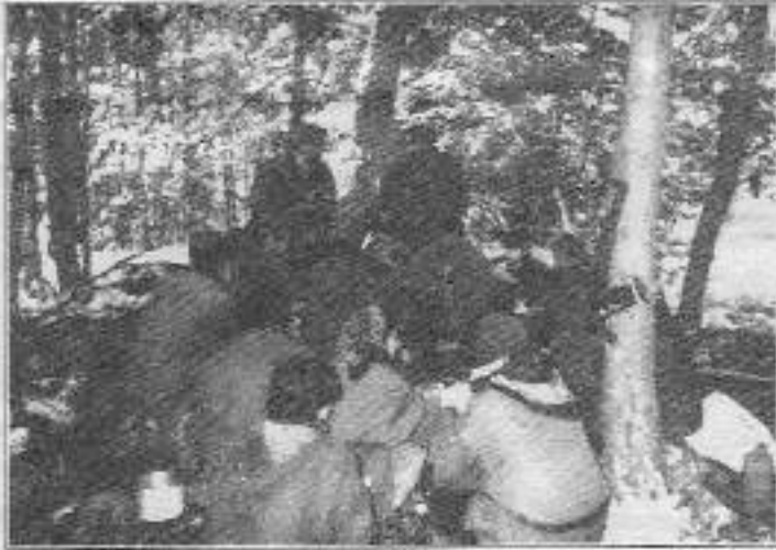
TİKKO: "Yitirdiğimiz yoldaşların bayraklarını ellerimizde dalgalandıracağız söz veriyoruz"

"Her iki yoldaşımızı çok ama çok erken yitirdik. Yoldaşlarımızın acısı yüreğimizi sızlatıyor. Kendilerini bilhçerlerimize ve yüreklerimize gömmüyoruz. Bayrakları yine ellerde dalgalanıyor. Ve söz veriyoruz. Dalgalandırılmaya devam edeceğiz. Topamlar ve Kaçkarlar bizim kalelerimiz olacaktır. Kalelerimizden zağedeceğiz şehitleri..."