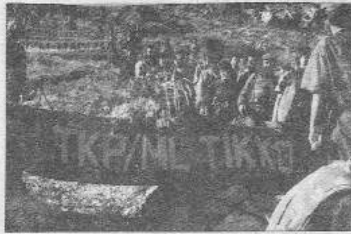
TKP/ML-TIKKO partizanları Olağanüstü 1. Parti Konferansı'na katılarak görüşüyor.

Çünkü, bu suçları işleyen her kimsenin devrim değil, karşı devrimci hizmet etmiş demektir ki, bu da ihanettir.