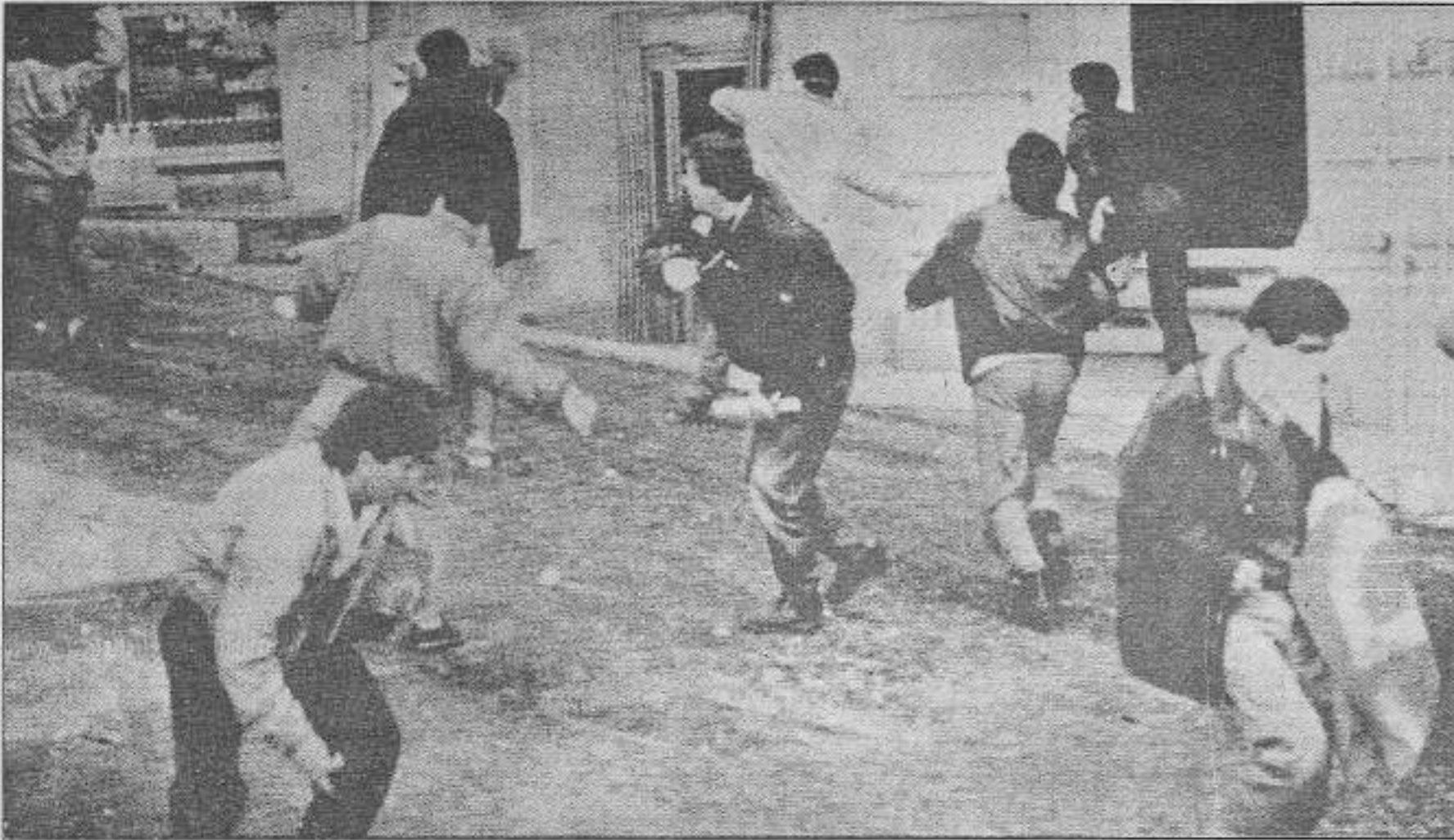
1 Mayıs İşçi Sınıfının Birlik Dayanışma ve Mücadele Gününde, 1990'da İstanbul'da Şişhane-Tarlabası yoluyla Taksim Meydanı'na çıkmak isteyen devrimcileri polis beldirerek engelledi. Ancak 'göstericiler' 1 Mayıs alanına çıkmakta ısrarlıydılar. Bu nedenle polise çatışma çıktı.

kal mücadelenin buralarda hangi temelde ve nasıl ifadelendirileceği sorunudur. Bu sorun boyutlu bir tartışmayı gerektirmekle birlikte aynı zamanda konumuzu dağıtacağından bir belirlemede bulunup geçiyoruz; o da bu sorunda proletarya partisinin çizgisi berraktır. Sorun bu çizginin pratiğe geçirmesinde yatmaktadır. Radikal mücadeleyi savunan küçük burjuva akımlar açısından ise çizgi sorununda yatmaktadır. Bu sorun hemen hergün yanlışlığını ispatlamaktadır.