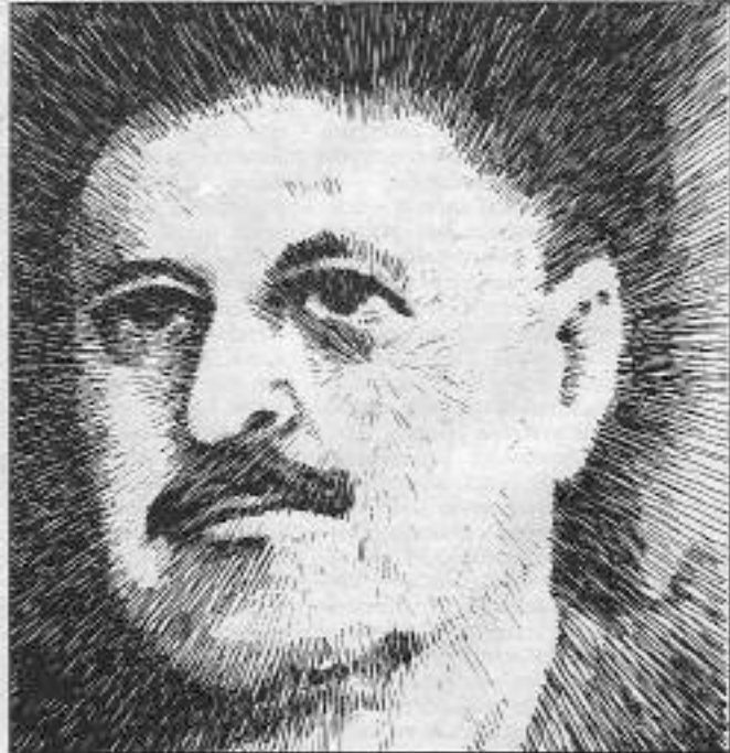
Nazım Hikmet vatan hainliğine devam ediyor hâlâ...

Kültür alanındaki tabuları, yasakları yıkmaya ant içmiş yiğit Kültür Bakanımız (!) Fikri Sağlar da kampanyanın destekçilerinden. Sağlar, imza metinlerini Bakanlar Kuruluna götürüp, olumlu bir karar çıkartılmak