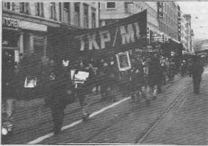
8 Mart Dünya Emekçi Kadınlar Günü tüm dünyada kutlandı. Yurtdışındaki Türkiye'de devrimci de İsviçre'de yürüyüşe eşlik etti.

Karanlıkta 15.30'a kadar devam eden şenlik daha sonra "Baskılar bizleri yıldırılmaz" sloganları ve alkışlı protestolarla sona erdirildi.