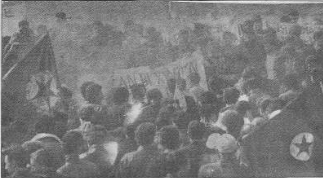
Newroz'un öünü çarptıranlara karşı meydanlar Kürçe sloganlarla inatıldı, aleşlerle ışıklara boğuldu, halaylarla coştu.

Tuzla: TKP/ML-TİKKO, TKİH, TDKP Tuzla'da eylem birliği temelinde ortak bir Newroz