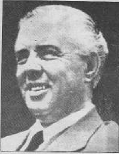
Enver Hoca, AEP'nin lideriydi.