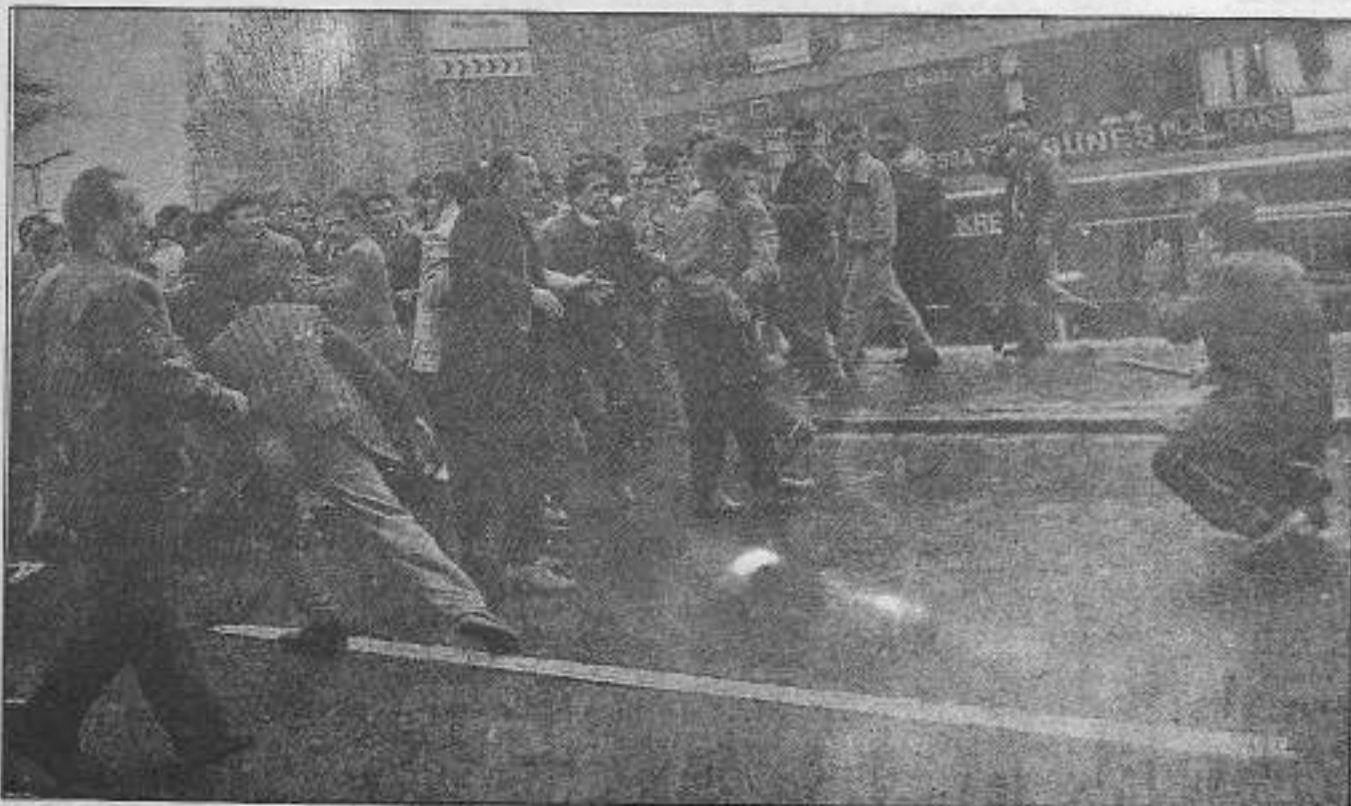
Pois kurşunlarına karşı taşla sopayla savaşmaya bilen bir halk nihai hesaplaşmada zafere çıkmaya bilecektir.

Şehirlerde ise düşman çok daha az çabayla çok daha az muharebe kazanarak bunun üzerinde psikolojik üstünlük sağlamayı becerebiliyor. Burada bir çelişkinin olduğu söylenebilir. Ancak bunun yanı sıra "orada silahlı mücadele var, bundan dolayıdır" demekle verilmaz. Diğer taraftan bu yanıt silahlı mücadeleye önem verir gibi görünse de aslında mücadelenin diyalektiğini kavramayan bir anlayıştır. Yani böyle bir yanıt şehirlere barışçıl mücadeleyi kafan biçme hatasına götürür. Yine de böyle bir yanıt bir sıkıntıya işaret etmektedir. Bu sıkıntı silahlı mücadelenin şehirlerde olması gerektiği noktada olmalıdır. Şehirlere barışçıl mücadele önerilmeyeceğine göre, radi-