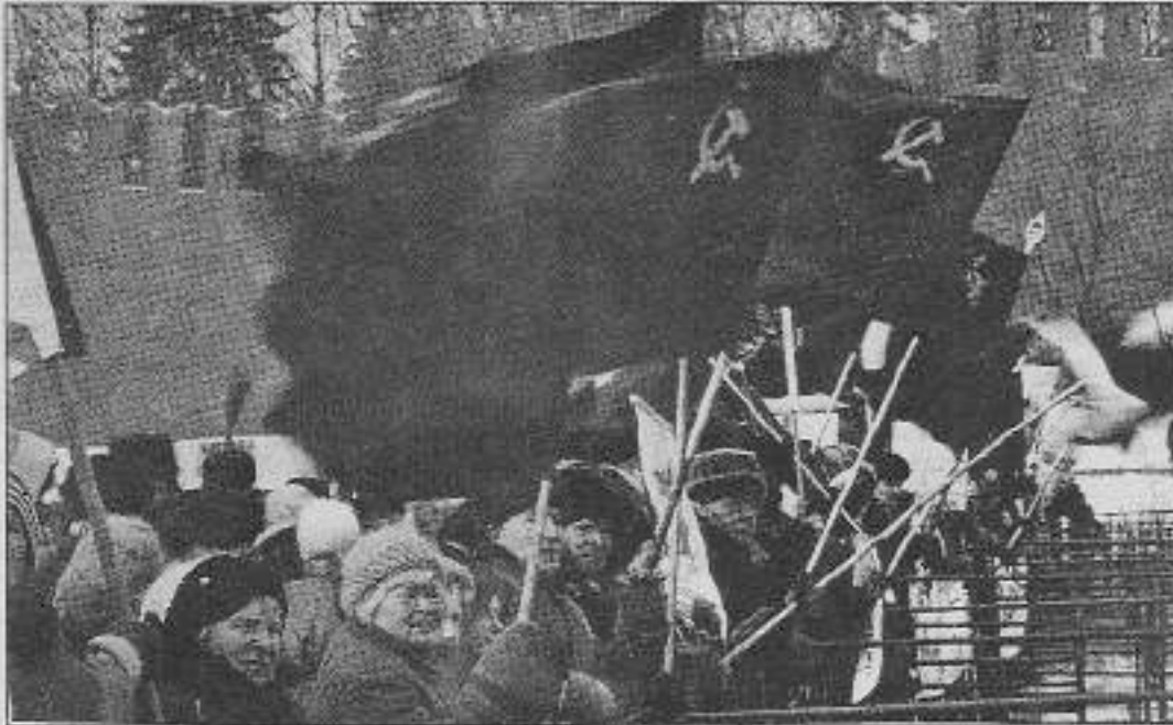
150 yıl önce burjuvazinin yıkılığını kaçırın "komünizm heyulası" bugün Rusya'da Kızıl duvarlarını zorlamaktadır.

Dış Haberler Servisi-Komünist Manifesto şöyle başlıyordu: Avrupa'da bir heyula dolaşıyor: Komünizm heyulası... Eski Avrupa'nın bütün güçleri, hayaleti defetmek için kutsal ittifaklara girdi.