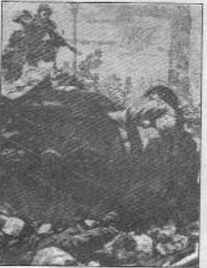
Barikattaki son kadın nefes, idam mangasına gülen genç kız. Komün'ün onlara kısa bir süre de olsa verdiği özgürlük için ölüyor.

"Petrolcüler", Komün'ün yenilmesi sırasında, yenik yaşamaktansa yığıtçe vuruşup ölümü göğüslemeyi yeğlemiş-lerdi.