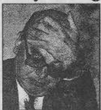
Eski Başbakanlardan Bettino Craxi