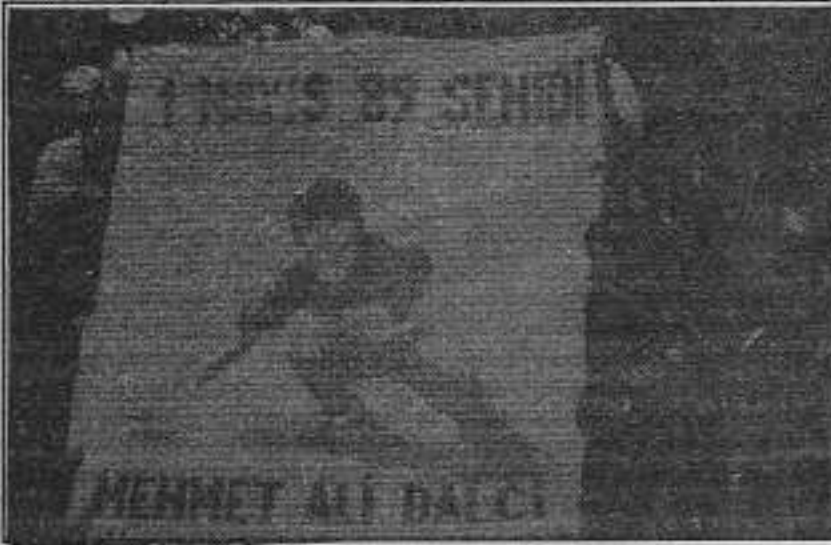
1 Mayıs enternasyonalist ruhun büyük simgesidir. Bu simgeye şehitler verilir.

runuzun her zamankinden yakası duruma getirdiği. Hakim ulus şovenizmini kavuran, faşizmin resmi politikasına can çektiiren, siyasal krizine daha bir derinlik kazandıran, onu hem daha çok kudurtup hem de çok daha ciddi düşünmeye zorlayan bir gelişme oldu. Devlet kumaylan toplantı üstüne toplantı yapıp yeni taktikler saptamaya çalışırken olayların yoğunlaştığı Mardin ili ve yaygınlaşma eğilimi gösterdiği Botan bölgesinde olağanüstü halli çok aşan bir uygulama, adı konmamış sıkıyönetim, asker-polis özel timlerin İsrail ordusuna taş çıkartan vahşeti, Nusaybin-Cizre katliamının dehşeti, yüzler ve binlerce gözaltı, buna karşılık halkın çeşitli biçimlerde direniş istiryor.