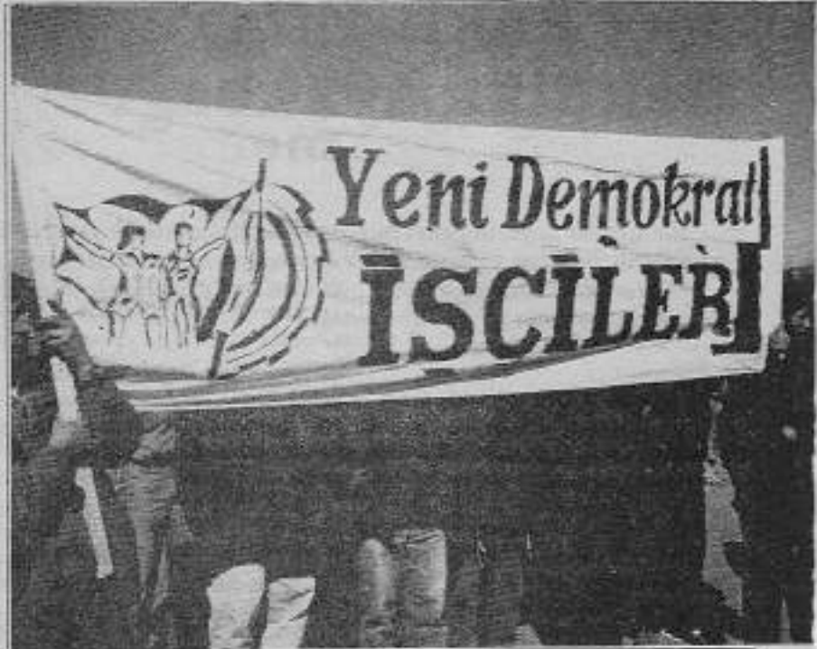
Meydanlara taşan sınıfın mücadelesi faşist düzeni ürkütüyor.

tık sınıf içinde yavaş yavaş tecrit oluyor. Yol-İş yönetiminin Kutlutaş işçileri arasındaki prestiji artık sifıra düşmüş, işçi arasına çıkamaz olmuşlardır. Bu sevindirici bir gelişme. Bir işçi bir sendika genel başkanından daha çok bir prestije ve iyi bir intibaya sahipse ve bir işçi konuştuğunda alkış tufanı, bir sendikacı konuştuğunda yuh sesleri yükseliyorsa o sendika yönetiminin işlevi bitmiş demektir. Evet Kutlutaş işçileri için Yol-İş yönetiminin işlevi kalmamıştır.