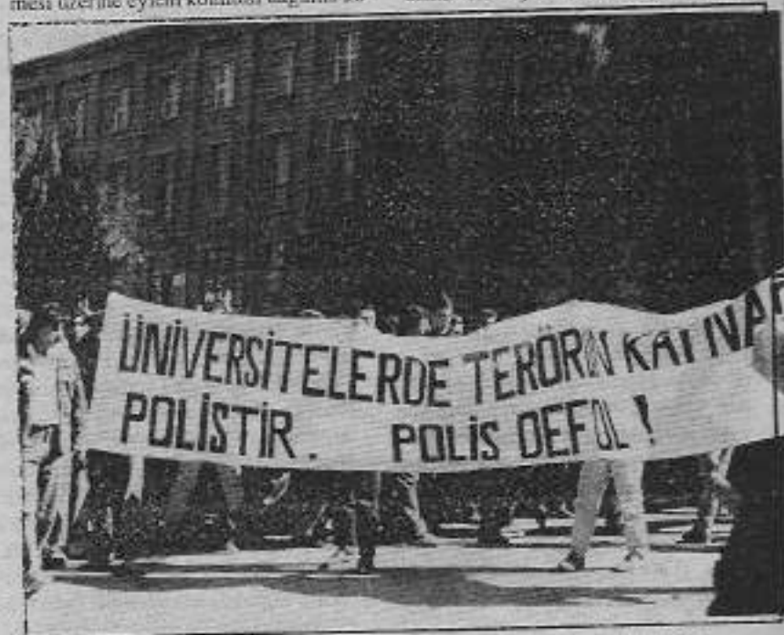
Ankara'daki öğrenci gençlik, üniversitelerdeki terörün odağının polis olduğuna vurgu yapıyor

Daha sonra arkadaşları eleştirip de özleştiri istediğimizde, "yavuz hırsız, ev sahibini bastırır" misali bir özleştirme (!) althk "Hatalıydık ama haklıyız" biçiminde