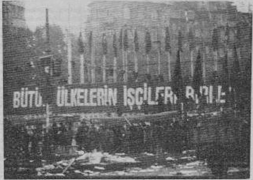
'Protentolar, mitingler, yürüyüşler Genel Greve hizmet eder'

Genel grev; 12 Eylül'den sonra kanunla yasak olması ve daha önceden de öz deneyimlerin yaşanmamış olması nedeniyle ülkemizde çok büyük bir olay şeklinde uygulanmaktadır. Bu bir yerde doğal. Ayrıca kendi koşulları içinde olmadığı da doğrudur. Genel grev, sınıf mücadelesinde işçilerin önemli bir silaha olarak görülüp devrimci ciddiyet ve sorumlulukla kullanılmalı gereken, siyasi muhtevazı, örgütlülüğü, disiplin içinde uygulanma ve saldırlara göğüs germe koşulları bakımından önemsenmesi şart olan bir eylem çeşididir. Bütün bunlara karşın, adı üstünde, grevin bir işyeri veya işkolu yerine genelde uygulanmasından başka bir şey de değildir. Devrimin zafere ilerlediği dönemlerde en ileri siyasal içerik ve en radikal mücadele yöntemleriyle bir ayaklanma provası olarak hayata geçirilmesi, yoğun sokak çatışmaları, fabrika işgalleri ve barikat savaşlarıyla birlikte yürütülmesi de sözkonusudur. Ancak hiç bir zaman ayaklanmanın kendisi değildir genel grev. Devrimin toplu ayaklanma stratejisine izlediği ülkelerde olsun, halk savaşıyla geliştirildiği ülkelerde olsun, zafer saati yaklaşmadan önce yapılan genel grevler ne kadar güçlü bir siyasi içeriğe sahip olsalar