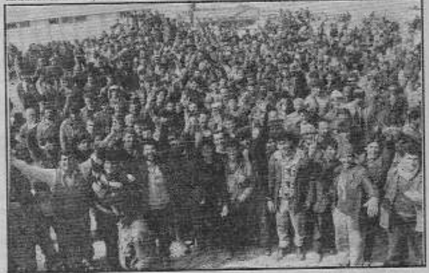
"Ambarlı Kutlutaş işçileri: Yol İş Sendikasının sarı yüzünü görünce İşçi Komitesi oluştu. Onlar haklarına işçi komitesi ile alma mücadelesi v eriyorlar."