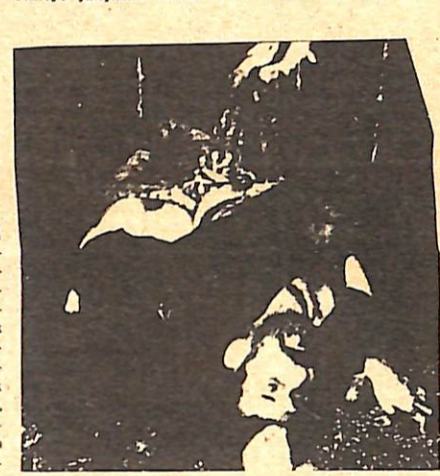
Maraş katliamının sorumlusu komprador patron-ağa devletidir.

la da yetinmeyip, bu çalmayı devrimcilerin kıskırttığı aşığı yalanını yaydılar. CHP'li işçileri bakanı faşist Özalp'ın, «bu karışıklığı başlatanlar devrimcilerdir» dedi. O-bunu söylemekle, 12 Mart açık faşizminin eli kanlı bir sıkıyönetim pasajı olduğunu bir kez daha ispatladı. Bu katliamın sorumlusu devlet, kendisini halkın gözünden saklamak için sahte bir mahkeme kurdurdu. Bu mahkemelerde bizzat sairiyaya uğrayıp kendini savunmaları yargılanıyor. Bu mahkemelerde feodal ve faşist ideolojinin etkisinde kalmış yoksullar yargılandılar. Hakım sınıflar sözde adalet dağıtıyor. Halkımız devrimci uyanışını koltremek için, faşist terörü artırmak için yoksul emekçileri birbirine kırdırıyorlar, daha sonra adalete maskesini takarak onları «yargılanmaktalar!»