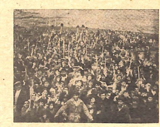
Çileşek köylülüğümüz D.H.Devrim yolunda yiğitçe savaşılıyor.

lü ve devrimci bu dönemde gözaltına alınmış; un-lardan 20 kadara tutulanak aralarca sabitiz delilsiz zindanlara tutumuyordu. Köylülerin işgal ettiği hazine toprakları sıkıyönetimin süngüsü altında bu dönemde yeniden sürülmüştür. Faşist CHP hükümetinin istifasıyla onun yerine geçen faşist AP azınlık hükümetinin de baskı, sömürü ve zulümde başka köylülere vereceği hiç bir şey yoktur. Çünkü Demirel ve AP'sini tüm halkımız olduğu gibi, köylülerimiz de artık çok iyi tanıyor! Aynı Demirel ve AP değilmiydi yıllarca halkımıza kan kusturarak, jandarma dipçisi, komando zulmünü köylülerin üzerinden eksik etmeyen? Demirel olsun, Ecevit olsun AP, CHP olsun; oralar hiç bir zaman köylülere toprak ve özgürlük veremezler. Çünkü bizzat kendileri toprak ağalarının temsilcileri, sözcükleridir. Onların menfaatleri köylülerin