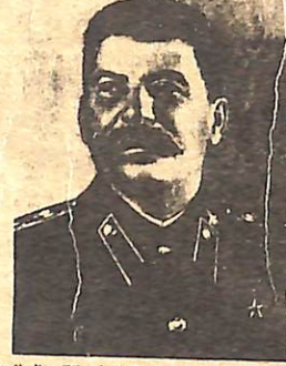
J.V. Stalin'in Fikirleri Yolumuzu Aydınlatıyor!

«HERKESİN İMZALADIĞI SUYA SABUNA DOKUNMAYAN BİR AÇIKLAMA Hazırlanan ikinci taslak diğer bir çok partiye olduğu gibi, bu kez AMLP'ne de gönderildi. Bu 'değişik' tavrın sobesi AMLP'nin 'kardes parti' olduğunu