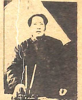
Mao Zedung'un Fikirleri Ölümsüzdür!

26 Aralık 1979, Mao Zedung yoldaşın 86. doğum yıldönümüdür. O, uluslararası proletaryanın arasından ayrılmıştı. Ama Mao Zedung'un Marksizm-Leninizmden ayrı olmayan görüşleri sonsuza dek yaşayacaktır. Çünkü Marksizm-Leninizm proleter dünya devriminin yanılmaz yol göstericisi olarak yaşayan bir bilimdir. Çünkü, dünya çapında emperyalizme, sosyal emperyalizme ve onların uşaklarına karşı proleter dünya devriminin ateşi yandı; bu zorlu mücadelede proletaryanın sıra neferleri ve aynı zamanda öncülüğü Marksizm-Leninizm yolundan yürüdükçe Mao Zedung'un eseri daima canlı kalacaktır.