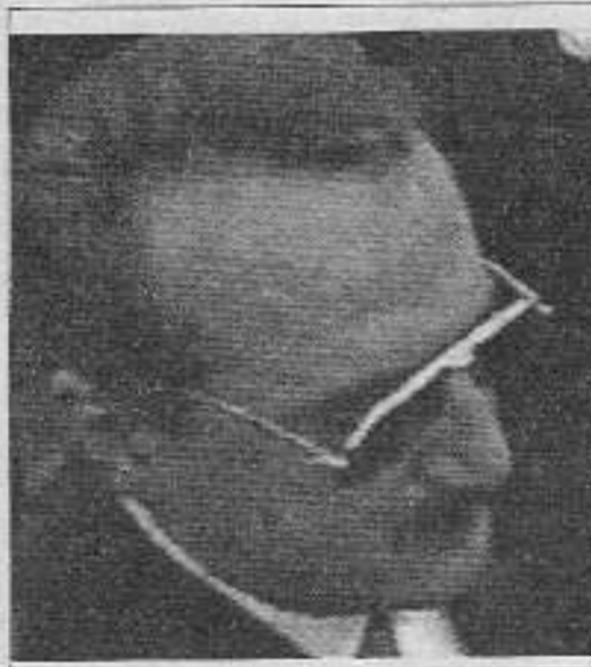
Yeni Adalet Bakanı Tescilli İşkenceci Mehmet AĞAR

Esir kamplarına saldırıların yaşanacağı, bu alanda muharebenin çetin olacağı kesindir. Esir savaşçıları teslim almak için düşman, tüm yöntemleri denemekten geri durmayacaktır. Sürgün ve sevklerin devreye sokulacağı, tecridlerle baskıların yaşanacağı, savaş esirlerinin aileleri üzerindeki baskıların artacağı, hak gasplarının yaşanacağı ve yaşatılmaya çalışılacağı açıktır. Bunun başarılabileceğini tartışma konusu değildir. Başaramadılar, başaramıyorlar ve başaramayacaklar. Esir savaşçıları teslim alınamaz. Ancak, nasıl olsa esir savaşçıları teslim alınamaz deyip, yaşanacak saldırılar karşısında hazırlıksız durmak, karşı-devrimci saldırı taktiğine karşı bu saldırıları püskürtme taktiği doğrultusunda, dışarıda üzerimize düşen hazırlıklan yapmamak düşmana hizmet etmek demektir. Ümraniye esir kampına yapılan saldırı sonrası geliştirilen sokak pratiğinin daha üst boyutuna yakalamak için gerekli alt yapısal çalışmaların bitirilip hazırlıklı olunması şarttır.